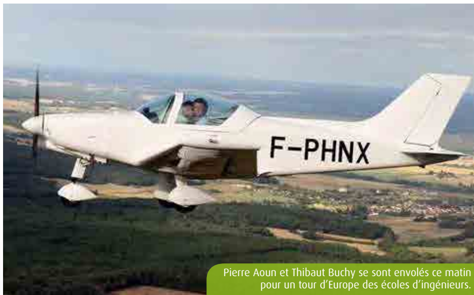
Pierre Aoun et Thibaut Buchy se sont envolés ce matin pour un tour d'Europe des écoles d'ingénieurs.

Cinq ans après la pose de la première pièce (1) -le Covid a sérieusement ralenti le chantier-, un an après son homologation officielle, six mois après son inauguration en grande pompe, le P300 s'envole pour une grande aventure. Nom de code : Build2Fly. Pierre Aoun et Thibaut Buchy, qui se sont largement investis dans le projet,