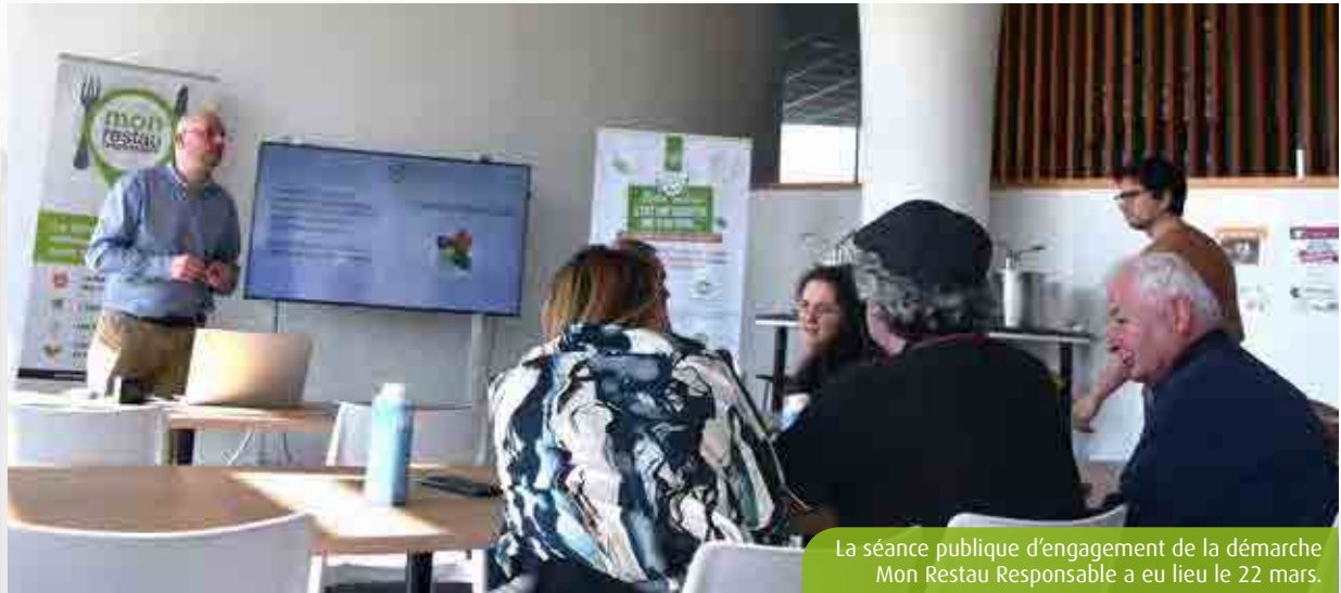
La séance publique d'engagement de la démarche Mon Restau Responsable a eu lieu le 22 mars.

Le restaurant administratif de l'IH2EF, à Chasseneuil, n'en finit plus de se transformer. L'établissement fraîchement rénové fait désormais partie de la démarche Mon Restau Responsable, visant à accélérer la transition écologique et sociale.