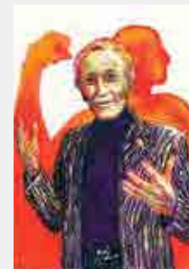
Entrée libre mais réservation conseillée sur emf.fr.