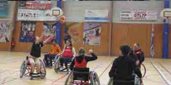
Plusieurs journées sont organisées pour permettre aux jeunes de s'immerger dans les Jeux olympiques et paralympiques.

leur assiduité aux activités sportives proposées par l'Accueil jeunes de Dissay.