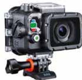
CAMÉRA DE SPORT À PARTIR DE 159 €