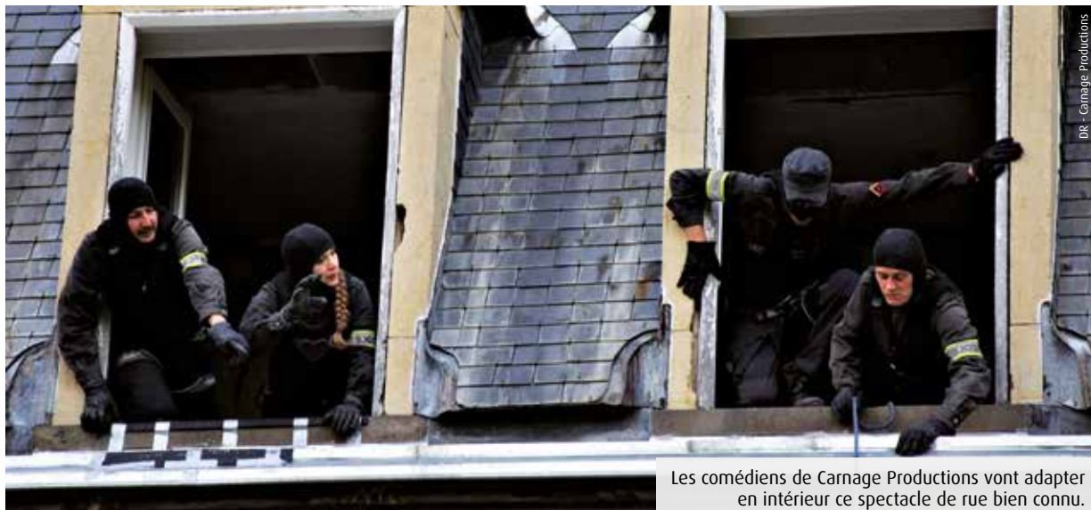
Les comédiens de Carnage Productions vont adapter en intérieur ce spectacle de rue bien connu.

Carnage Productions revient pour la deuxième fois préparer le réveillon du Nouvel An avec les 3T-Scène conventionnée de Châtellerauld. Au programme, GIGN, un spectacle de rue qui sera donné... au Nouveau Théâtre ! Un vrai défi pour ce GIGN loufoque.