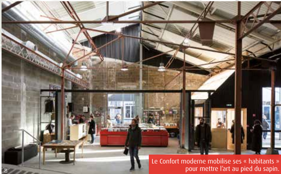
Le Confort moderne mobilise ses « habitants » pour mettre l'art au pied du sapin.

A Poitiers, la lettre au Père Noël du Confort moderne n'est pas banale et tient plutôt de l'exhortation. « Arrête de digger (creuser, ndr) sur les fleuves de l'Internet les derniers gadgets qui ne passeront pas l'Épiphanie. Inutile de chercher une place en centre-ville pour te procurer le fameux kit écharpe-bonnet-gants chez Moche&Moche en pensant que ça me fera plaisir. Oublie tes chocolats industriels, ton énième tire-bouchon, ton DVD trouvé à la vavite. » Pour faciliter la tâche au vieux monsieur, le Confort moderne, avec la complicité de Jazz à Poitiers, la Fanzinothèque et la boutique de disques Transat,