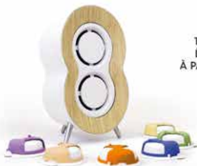
DIFFUSEUR D'HUILES ESSENTIELLES CONNECTÉ 99 €