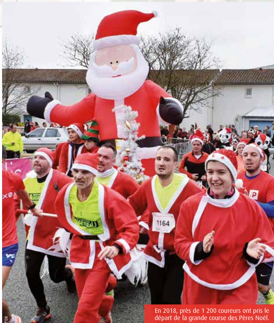
En 2018, près de 1 200 coureurs ont pris le départ de la grande course des Pères Noël.

La traditionnelle course des Pères Noël de Saint-Benoît se déroule samedi. Organisée par le comité des fêtes de la ville, la manifestation en est à sa 20 e édition et devrait encore rencontrer un joli succès.