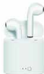
OREILLETES BLUETOOTH 24,90€