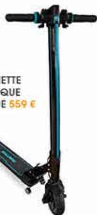
TROTINETTE ÉLECTRIQUE À PARTIR DE 559 €