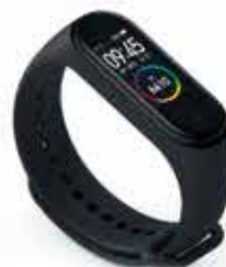
TRACKER D'ACTIVITÉ À PARTIR DE 44,90 €