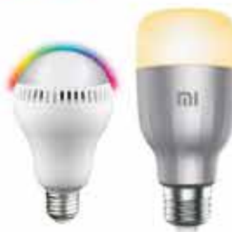
AMPOULE CONNECTÉE À PARTIR DE 29,90 €