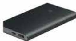
BATTERIE EXTERNE 10000 MAH 29,99€