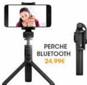
PERCHE BLUETOOTH 24,99€