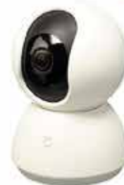
CAMÉRA DE SURVEILLANCE À PARTIR DE 45 €