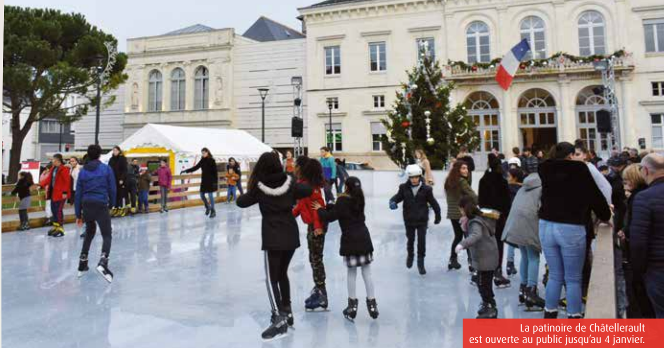
La patinoire de Châtellerauld est ouverte au public jusqu'au 4 janvier.

A quelques jours du réveillon, les rues de Châtellerauld et de Poitiers sont toujours à la fête. Marché, manèges, rencontres avec le Père Noël... Tour d'horizon des animations qui vous attendent dans les prochains jours.