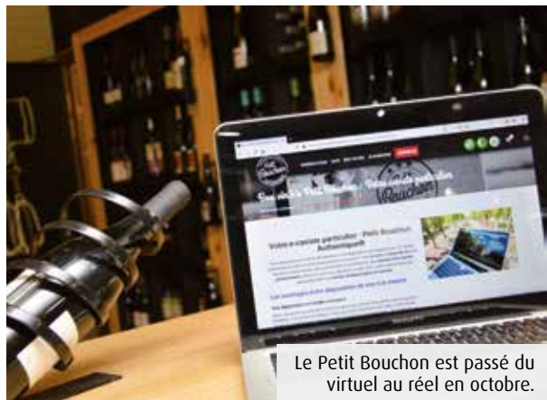
Le Petit Bouchon est passé du virtuel au réel en octobre.

Comment donner confiance aux consommateurs quand on gère une plateforme de vente de vin en ligne ? Le Petit Bouchon et Miss and Wine, deux initiatives portées par des Poitevins, misent sur le bouche-à-oreille et le contact direct.