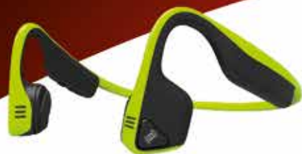
CASQUE AUDIO À CONDUCTION OSSEUSE - 99 €

Un large choix de cadeaux high-tech à mettre au pied du sapin.