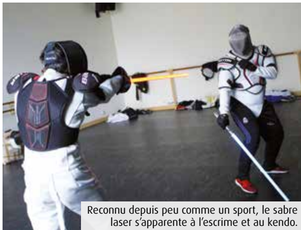
Reconnu depuis peu comme un sport, le sabre laser s'apparente à l'escrime et au kendo.

« Originaire des Etats-Unis, la Sport Saber League est arrivée en France en 2015 pour y ins-