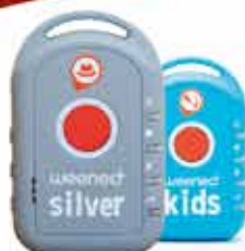
TRACEUR GPS (ENFANT, SENIOR, CHIEN, CHAT) À PARTIR DE 59,90€