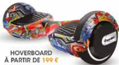
HOVERBOARD À PARTIR DE 199 €