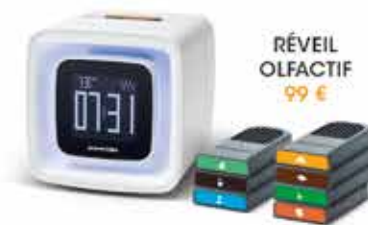
RÉVEIL OLFACTIF 99 €