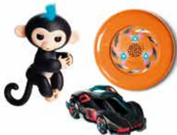
JEUX ET JOUETS CONNECTÉS À PARTIR DE 19 €