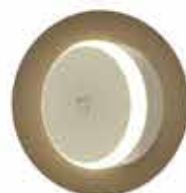
VEILLEUSE À DÉTECTION DE MOUVEMENTS 14,99€