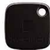
PORTE-CLÉS CONNECTÉ 25 €