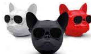
ENCEINTE CONNECTÉE (JEAN-MICHEL JARRÉ, MARSHALL, MUSE...) À PARTIR DE 69,90 €