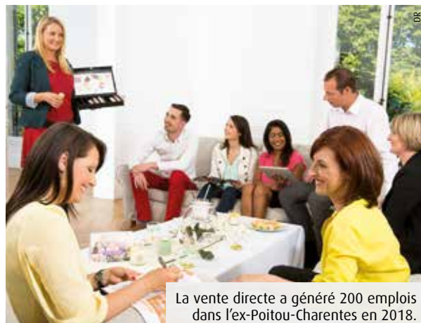
La vente directe a généré 200 emplois dans l'ex-Poitou-Charentes en 2018.

La vente directe, à domicile ou pas, a recruté près de 7 000 collaborateurs en 2018, dont 200 dans l'ex-Poitou-Charentes. La plupart sont indépendants et gèrent donc leur temps. Mais attention, ce statut n'est pas fait pour tout le monde.