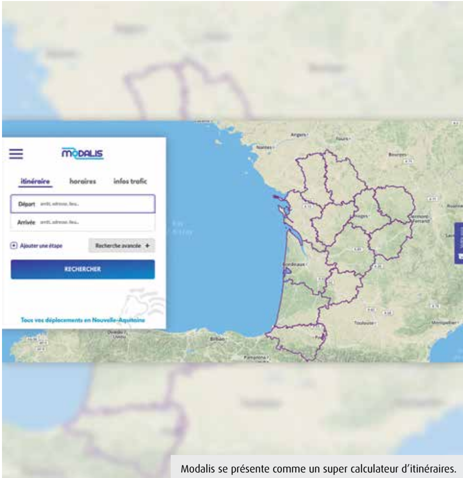
Modalis se présente comme un super calculateur d'itinéraires.

Depuis la rentrée, la Région Nouvelle-Aquitaine propose à tous ceux qui se déplacent de préparer leur itinéraire via la plateforme modalis.fr . Du bus de ville au TER, tous les moyens de transports y sont répertoriés.