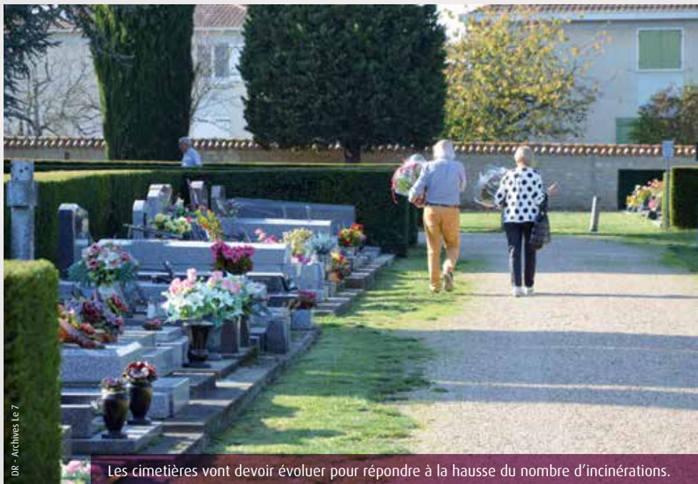
DR - Archives Le 7