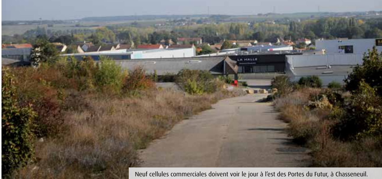
Neuf cellules commerciales doivent voir le jour à l'est des Portes du Futur, à Chasseneuil.