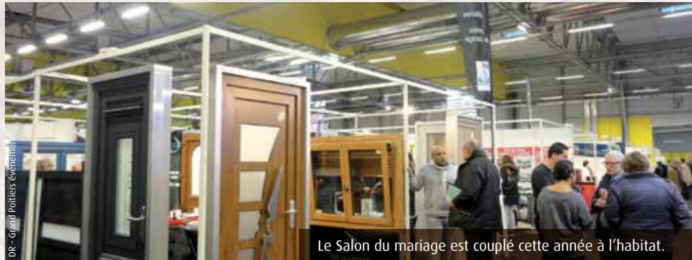
Le Salon du mariage est couplé cette année à l'habitat.

de la communication du parc. Côté animation, l'organisation a invité les acteurs locaux du vintage à mettre en avant leur passion. Les visiteurs pourront ainsi se faire tailler la barbe à l'ancienne par l'enseigne Radikal Hair Shop, profiter des jeux rétro (flipper, bornes d'arcade, baby-foot...), installés dans le hall B, ou encore admirer les voitures de collection exposées entre les deux bâtiments.