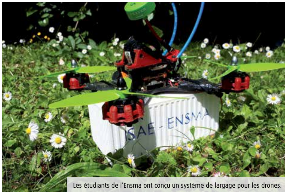
Les étudiants de l'Ensma ont conçu un système de largage pour les drones.

Ultra-tendances, les drones seront au cœur des festivités du 70 e anniversaire de l'Isae-Ensmas, le samedi 13 octobre prochain, de 10h à 17h30. Parmi les quatre types de courses programmés, le « dronathlon » suscitera à coup sûr l'enthousiasme du public. « A l'image du biathlon à ski, les pilotes alterneront entre du circuit et trois épreuves de largage jusqu'à vingt mètres au-dessus d'une cible (notre photo). Les échecs