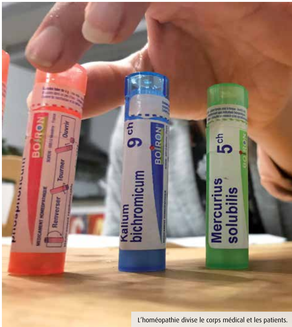
L'homéopathie divise le corps médical et les patients.

Entre menaces de déremboursement et enseignement remis en cause dans certaines facultés, les homéopathes se mobilisent, même si leurs représentants se veulent rassurants.