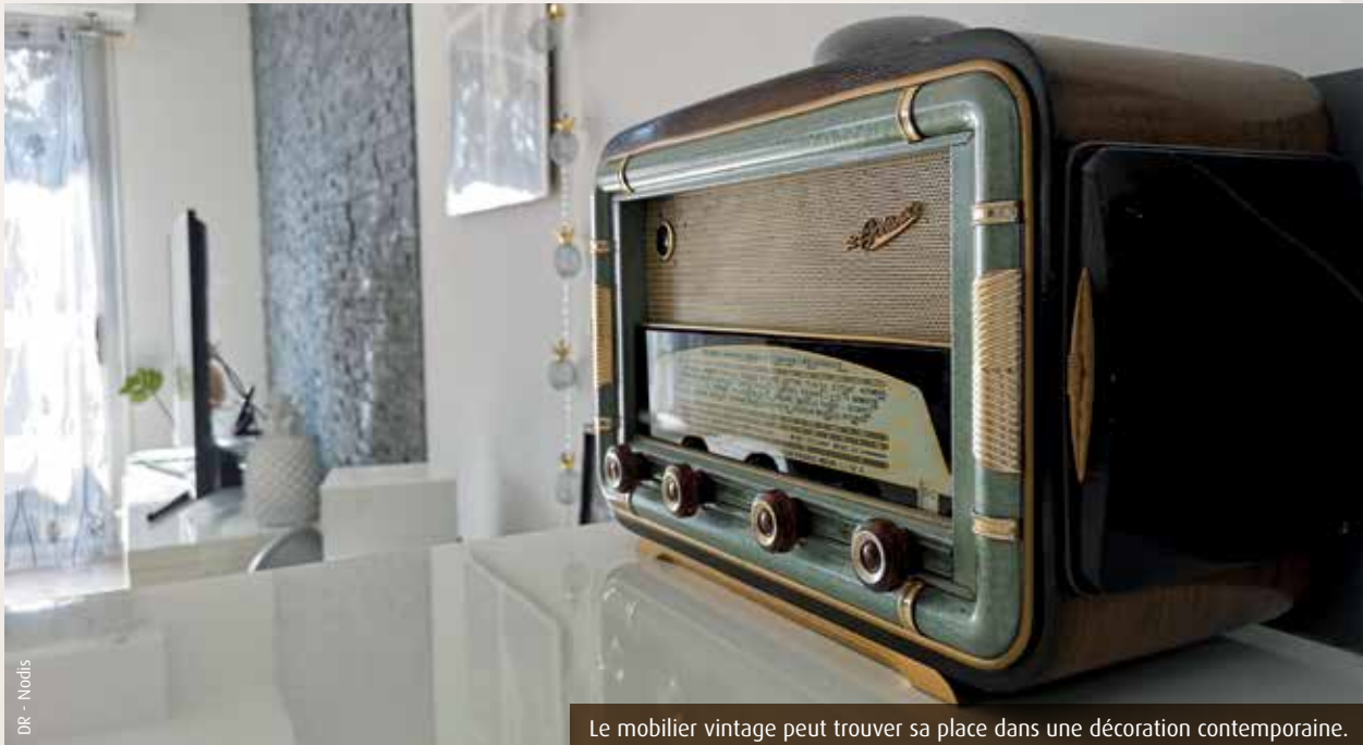
DR - Noods

Retrouvez l'intégralité du programme sur grandpoitiers-evenements.com