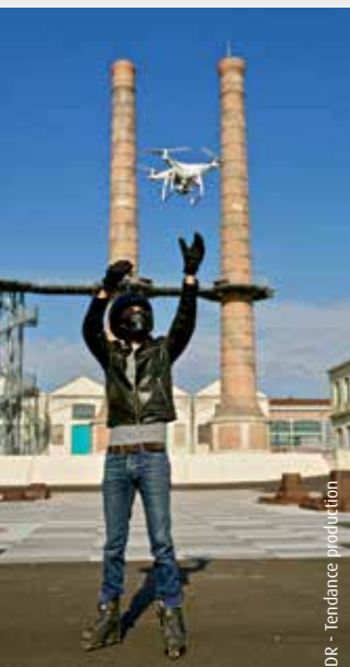
DR - Tendance production