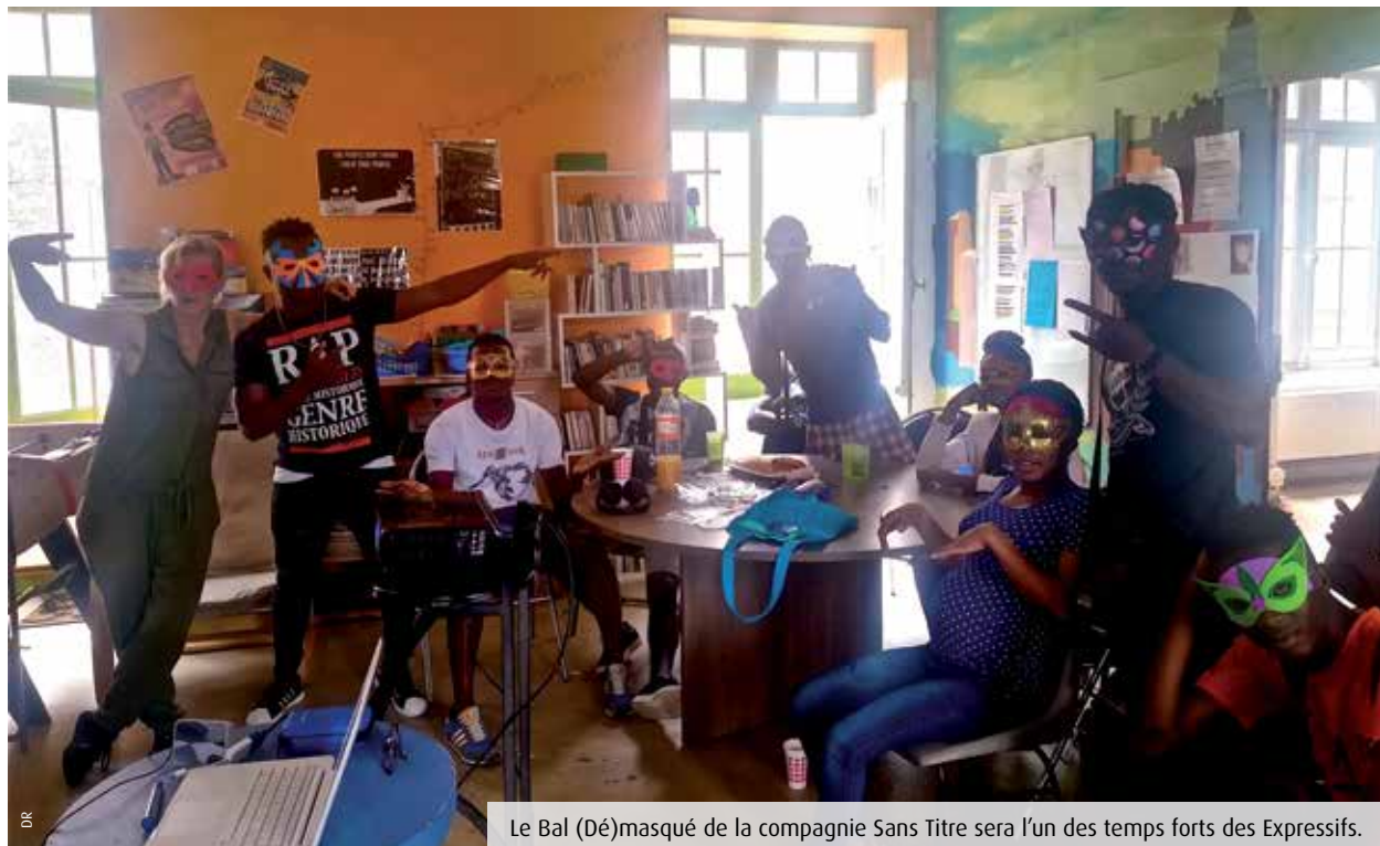
Le Bal (Dé)masqué de la compagnie Sans Titre sera l'un des temps forts des Expressifs.