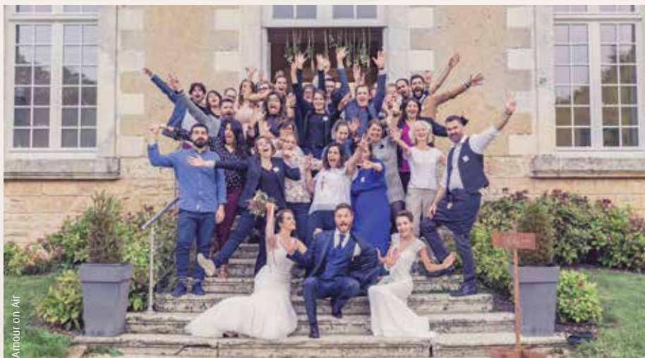
DK - Amour on Air

Pour se démarquer, Amour on Air mise sur le professionnalisme de ses prestataires et sur les nombreuses animations du week-end (défilés, bar à maquillage, à coiffure, à vinyes, food trucks...). « Nous mettons l'accent sur la décoration du lieu et sur la sélection de nos exposants. Notre objectif est de proposer une expérience de visite originale, en cassant l'esprit