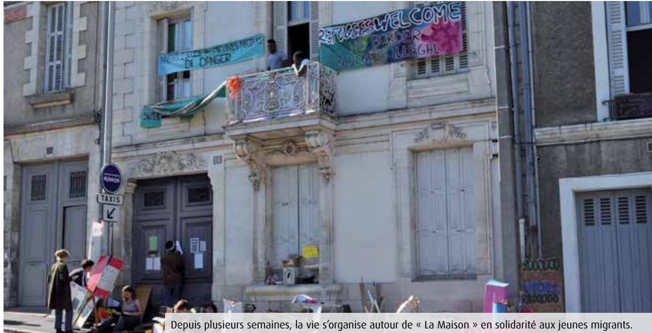
Depuis plusieurs semaines, la vie s'organise autour de « La Maison » en solidarité aux jeunes migrants.

Depuis plusieurs semaines, de jeunes migrants sont barricadés au 22, voie André-Malraux, à Poitiers. Ils contestent la décision du juge des enfants qui les déclare majeurs, donc non éligibles aux services de l'Aide sociale à l'enfance.