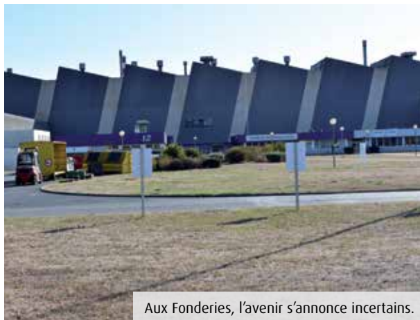
Aux Fonderies, l'avenir s'annonce incertain.

L'usine, qui emploie 330 salariés et environ 70 intérimaires, produit des composants en aluminium,