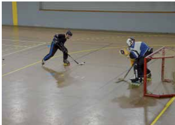
Si les charges sont interdites, la frappe du palet reste redoutable.