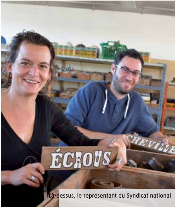
Là-dessus, le représentant du Syndicat national

Installée depuis 2013 à Poitiers, la Regratterie a déménagé cet été à Migné-Auxances. La recyclerie créative rouvrira ses portes au public le 13 octobre, avec une nouveauté : sa matériauthèque.