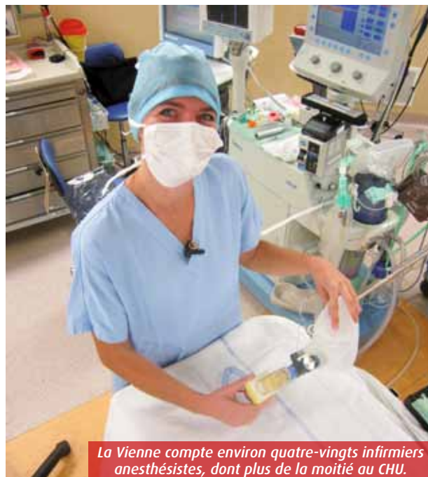
La Vienne compte environ quatre-vingts infirmiers anesthésistes, dont plus de la moitié au CHU.

ces hommes et femmes de l'ombre (un tiers-deux tiers au CHU) ne se trouvent jamais très loin de leur médecin de tutelle, du chirurgien et de la panseuse. Et comme dans tout métier médical, les sujets de réflexion autour de la prise en charge de l'obésité, des douleurs post-opératoires ou encore la chirurgie ambulatoire nourrissent leur réflexion.