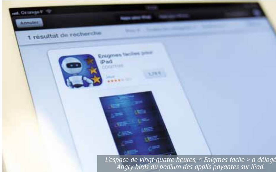
L'espace de vingt-quatre heures, « Enigmes facile » a délogé Angry birds du podium des applis payantes sur iPad.

760 000 téléchargements en janvier 2012, plus d'1,2 million un an plus tard. Sur ses terrains de jeu favoris, l'iPhone et l'iPad, Cogitème s'éclate comme jamais. Dernier épisode en date, à la mi-janvier. « J'ai organisé un coup de pub avec AppGratis, un annonceur assez connu sur iPhone,