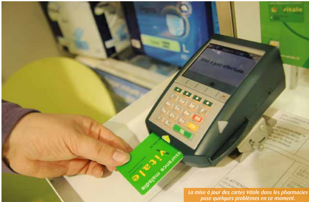
La mise à jour des cartes Vitale dans les pharmacies pose quelques problèmes en ce moment.

N° ISSN : 2105-1518 Dépôt légal à parution Tous droits de reproduction textes et photos réservés pour tous pays sous quelque procédé que ce soit. Ne pas jeter sur la voie publique.