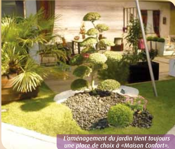
L'aménagement du jardin tient toujours une place de choix à «Maison Confort».