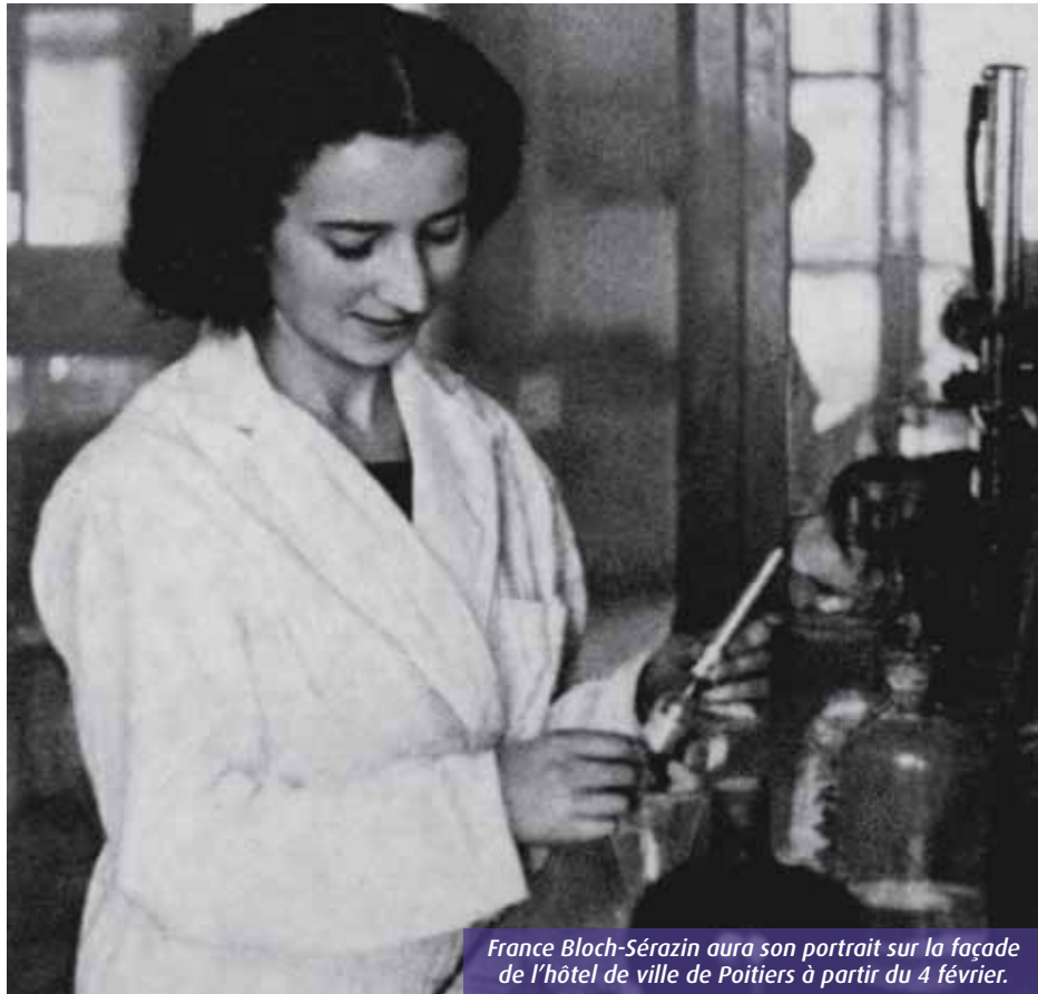
France Bloch-Sérazin aura son portrait sur la façade de l'hôtel de ville de Poitiers à partir du 4 février.

Du 4 au 15 février, Poitiers fêtera les cent ans de la naissance et les soixante-dix ans de l'exécution de France Bloch-Sérazin. Plongée dans l'histoire fascinante de cette grande résistante.