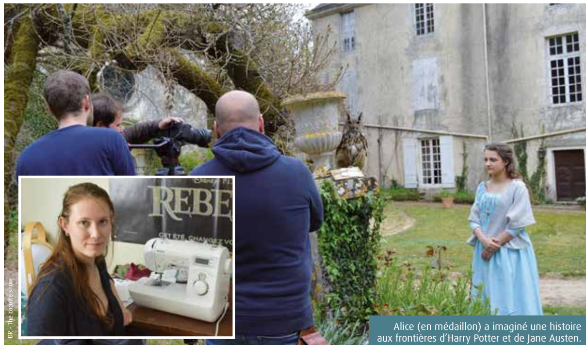
Alice (en médaillon) a imaginé une histoire aux frontières d'Harry Potter et de Jane Austen.

POISSON (19 FÉVRIER > 20 MARS) Les amours sont un peu en berne cette semaine. Vos défenses immunitaires ont besoin de ressort. Associations et contrats retiennent toute votre attention.