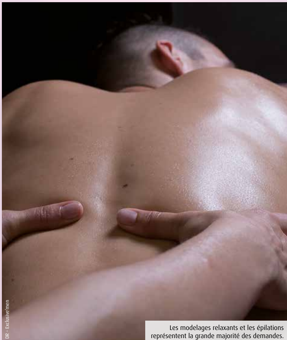
Les modelages relaxants et les épilations représentent la grande majorité des demandes.

Soins du corps, massage, épilation... Les femmes sont les principales clientes des instituts de beauté. Pourtant, depuis quelques années, de plus en plus d'hommes franchissent la porte des salons spécialisés.