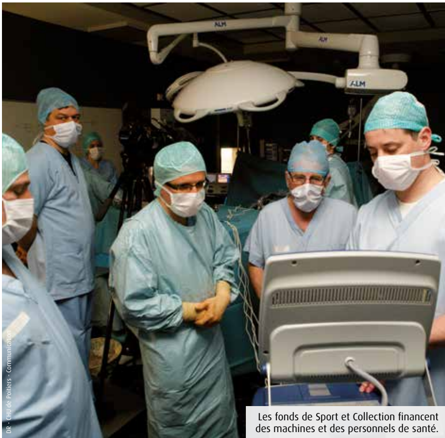
Les fonds de Sport et Collection financent des machines et des personnels de santé.

La 25 e édition de Sport et Collection se déroulera de jeudi à dimanche, sur le circuit du Vigeant. Cet événement familial rapporte chaque année près de 300 000€ à la recherche contre le cancer. Passage en revue des projets en lice.