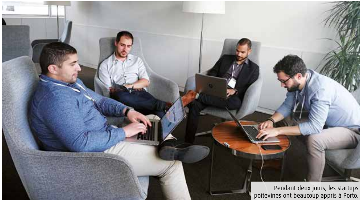
Pendant deux jours, les startups poitevines ont beaucoup appris à Porto.

Point d'orgue de la Start'Innov Academy mise en place par le SPN, la rencontre européenne organisée la semaine passée à Porto a offert à huit startups de Poitou-Charentes, dont trois basées dans la Vienne, une immersion de deux jours dans l'écosystème numérique international.