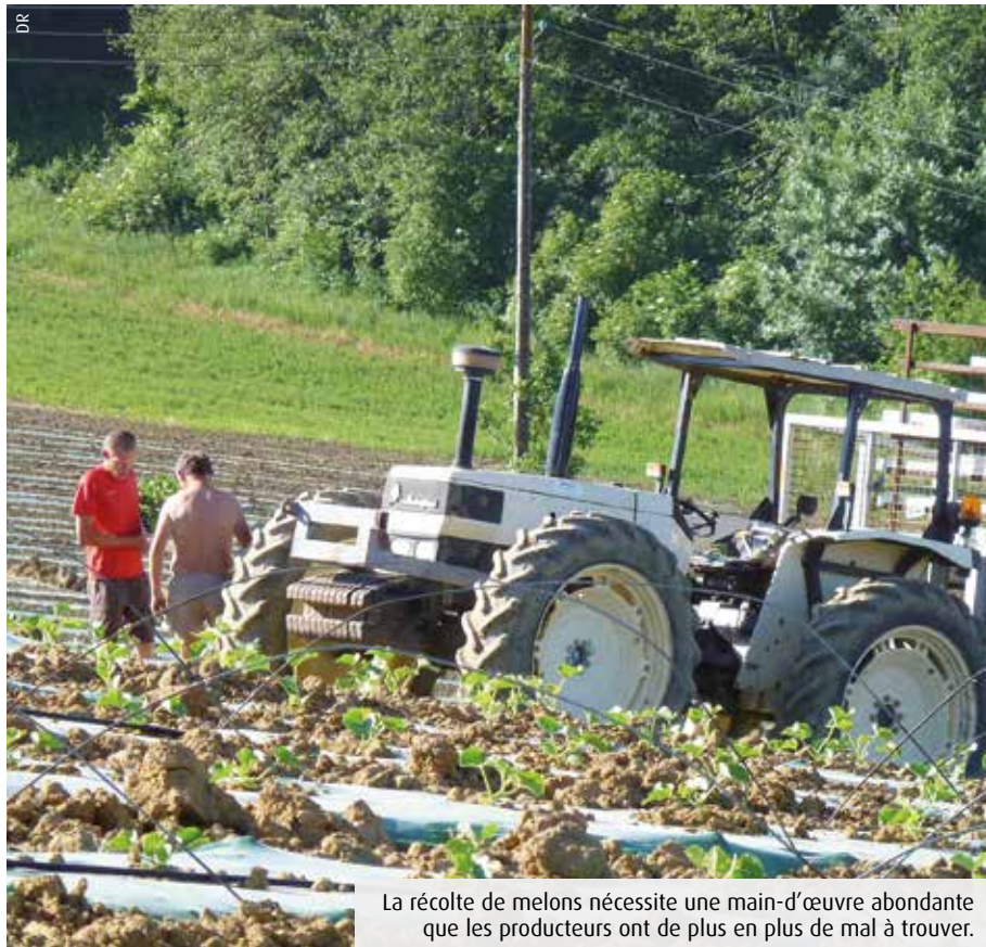
La récolte de melons nécessite une main-d'œuvre abondante que les producteurs ont de plus en plus de mal à trouver.

A la veille de la saison haute, les producteurs de melons du Haut-Poitou s'inquiètent du manque de main-d'œuvre récurrent. Ils ont mis en place une Maison de la saisonnalité de manière à répondre aux problématiques d'hébergement des saisonniers.