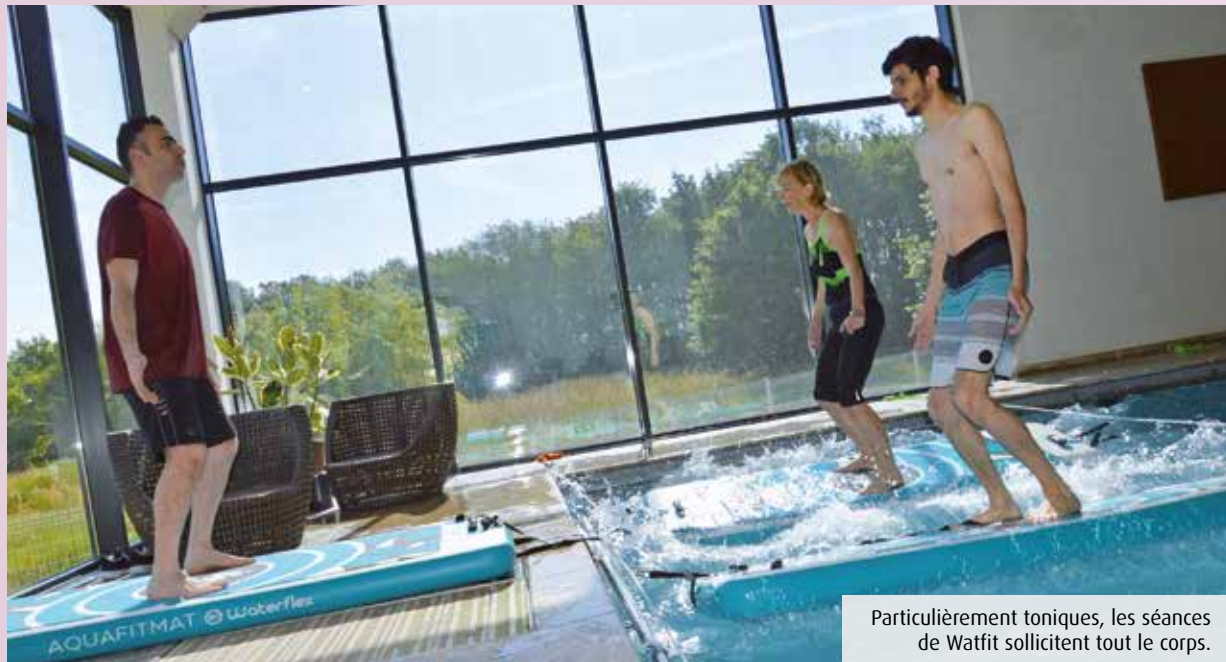
Particulièrement toniques, les séances de Watfit sollicitent tout le corps.

Depuis septembre, le centre spa et bien-être Relaxéo, basé à Mignaloux-Beauvoir, propose une nouvelle activité aquatique : le Watfit, qui consiste en des exercices de fitness sur tapis flottant. Découverte, en immersion.