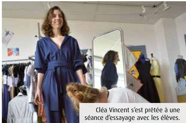
Cléa Vincent s'est prêtée à une séance d'essayage avec les élèves.

La chanteuse Cléa Vincent, l'une des figures montantes de la scène musicale french pop, a confié la réalisation de pièces de sa garde-robe aux élèves du lycée des métiers de la mode du Dolmen, à Poitiers. Une résidence d'artiste riche d'échanges.