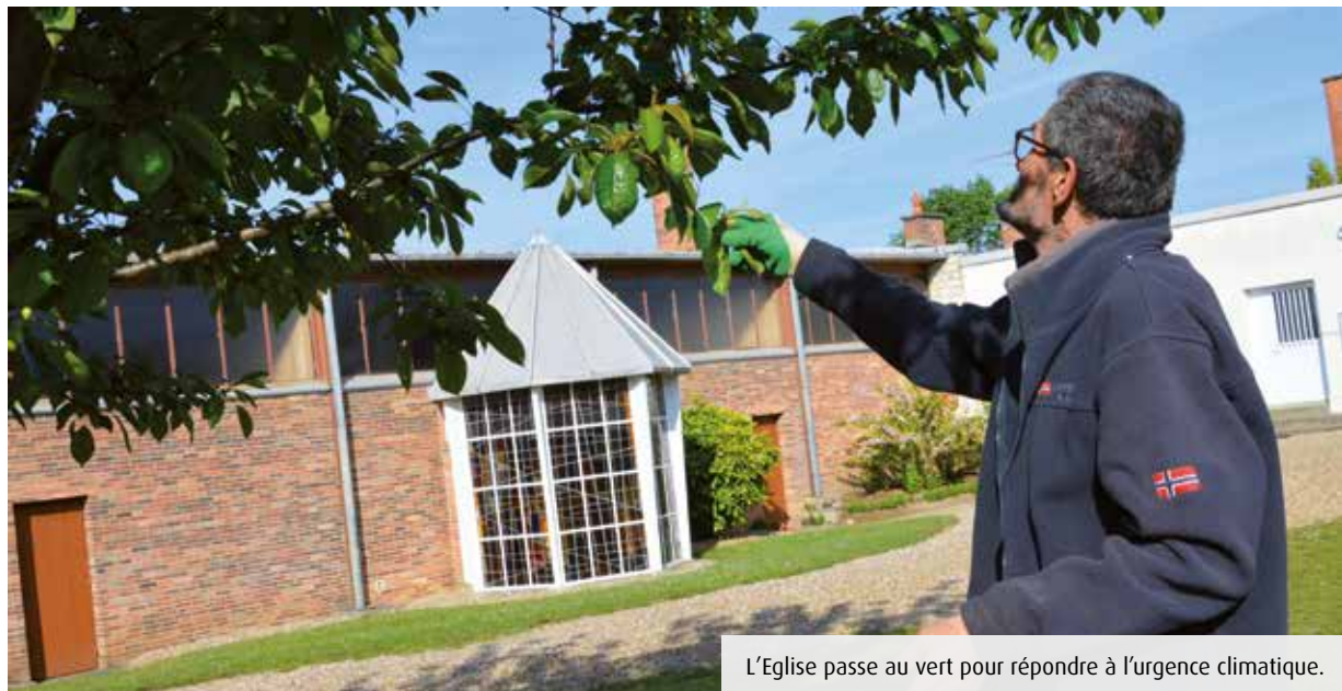
L'Eglise passe au vert pour répondre à l'urgence climatique.