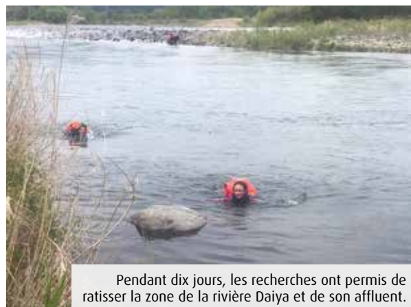
Pendant dix jours, les recherches ont permis de ratisser la zone de la rivière Daiya et de son affluent.