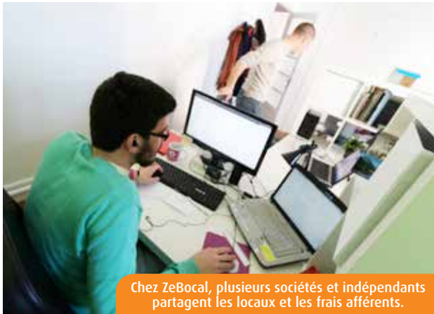
Chez ZeBocal, plusieurs sociétés et indépendants partagent les locaux et les frais afférents.

En cette période de crise économique, les modèles coopératifs gagnent du terrain. Colocation, covoiturage, coworking... Aujourd'hui, tout se partage. Un mode de vie que de plus en plus de Poitevins adoptent pour limiter les frais.