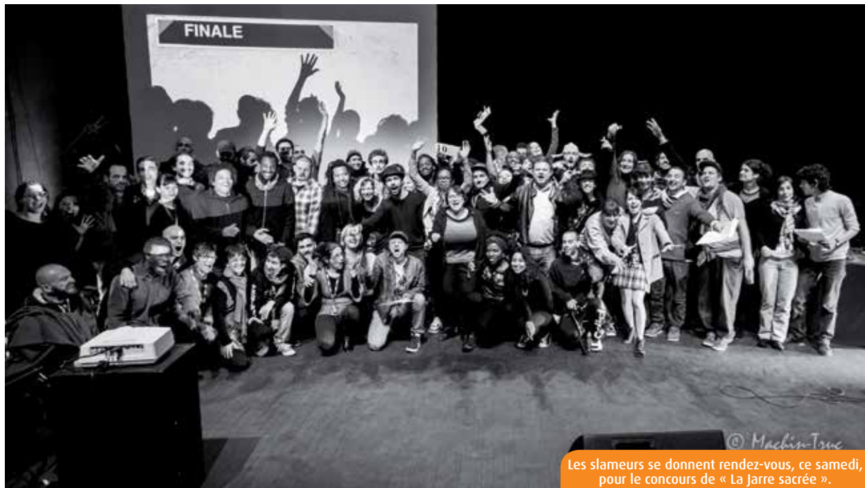
Les slameurs se donnent rendez-vous, ce samedi, pour le concours de « La Jarre sacrée ».