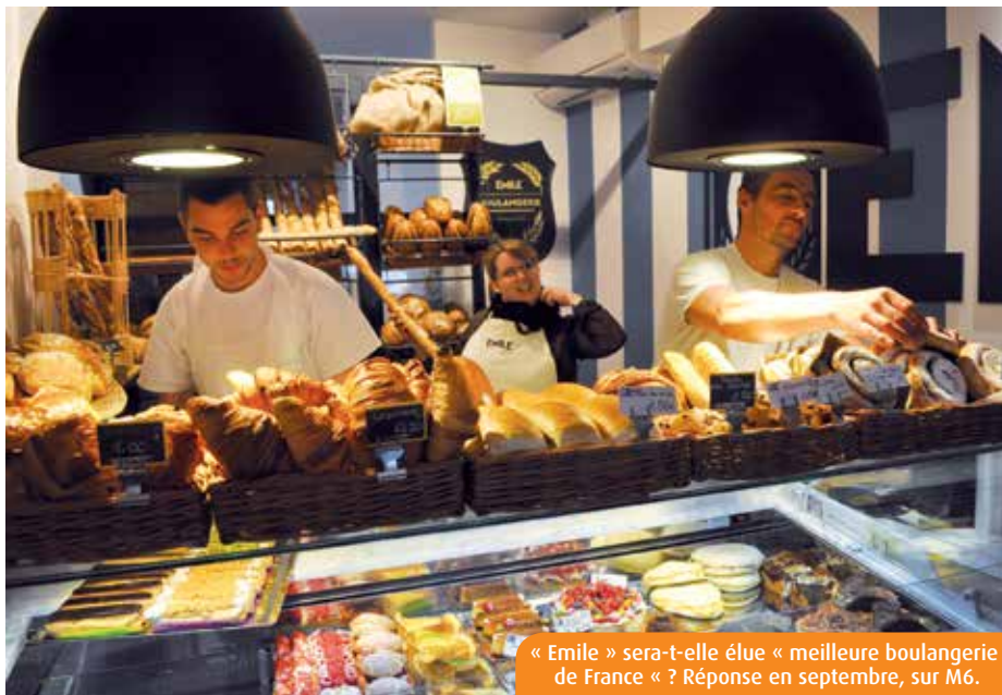
« Emile » sera-t-elle élue « meilleure boulangerie de France » ? Réponse en septembre, sur M6.

Une question reste en suspens. Remporteront-ils les 3000€ mis