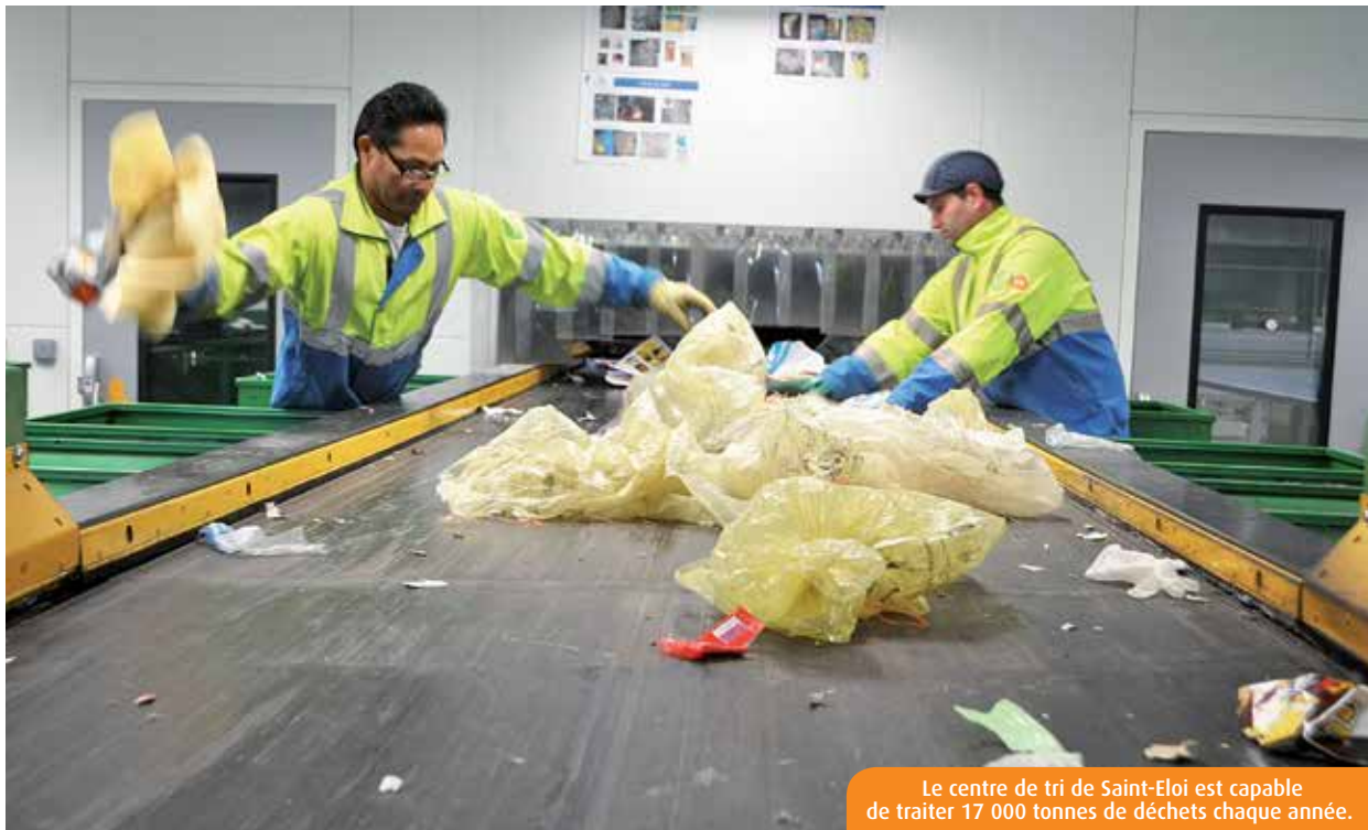
Le centre de tri de Saint-Eloi est capable de traiter 17 000 tonnes de déchets chaque année.

Vendredi 29 mai, à 20h30, place Pierre-d'Amboise à Dissay. Inscription obligatoire au plus tard le 25 mai : 05 49 50 42 59.