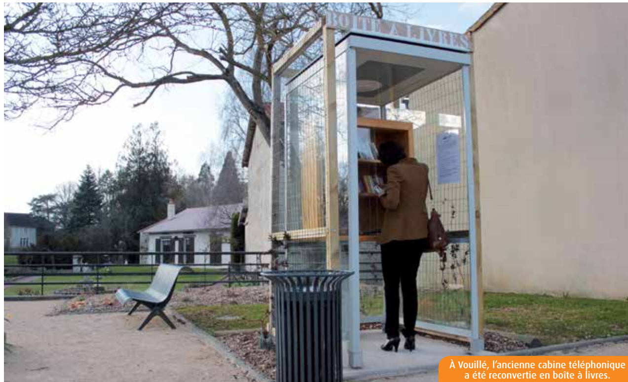
À Vouillé, l'ancienne cabine téléphonique a été reconvertie en boîte à livres.

Trois ans après l'installation de la première « boîte à livres », à Poitiers, de nouvelles bibliothèques communautaires s'installent dans l'agglomération et le reste du département. Avec un objectif clair : démocratiser la lecture.