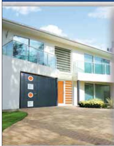
Portes de garage