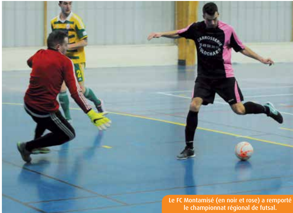
Le FC Montamisé (en noir et rose) a remporté le championnat régional de futsal.

La section futsal du FC Montamisé (plus de deux cents licenciés sur gazon) compte une trentaine de pratiquants répartis en deux équipes. La première, championne régionale donc, et