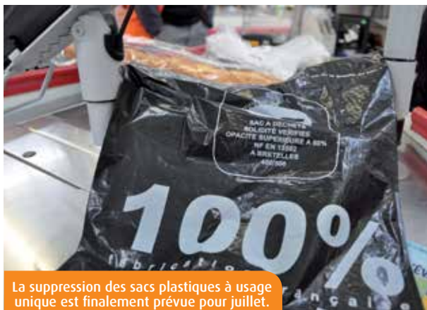
La suppression des sacs plastiques à usage unique est finalement prévue pour juillet.