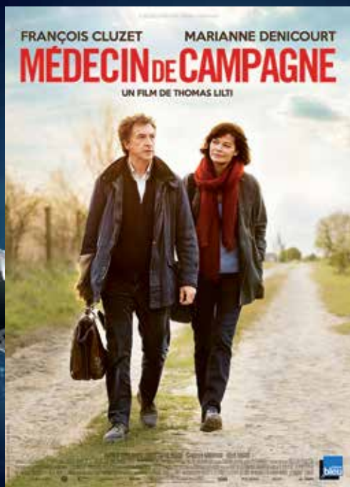
Comédie dramatique de Thomas Lilti avec François Cluzet, Marianne Denicourt, Isabelle Sadoyan (1h42).