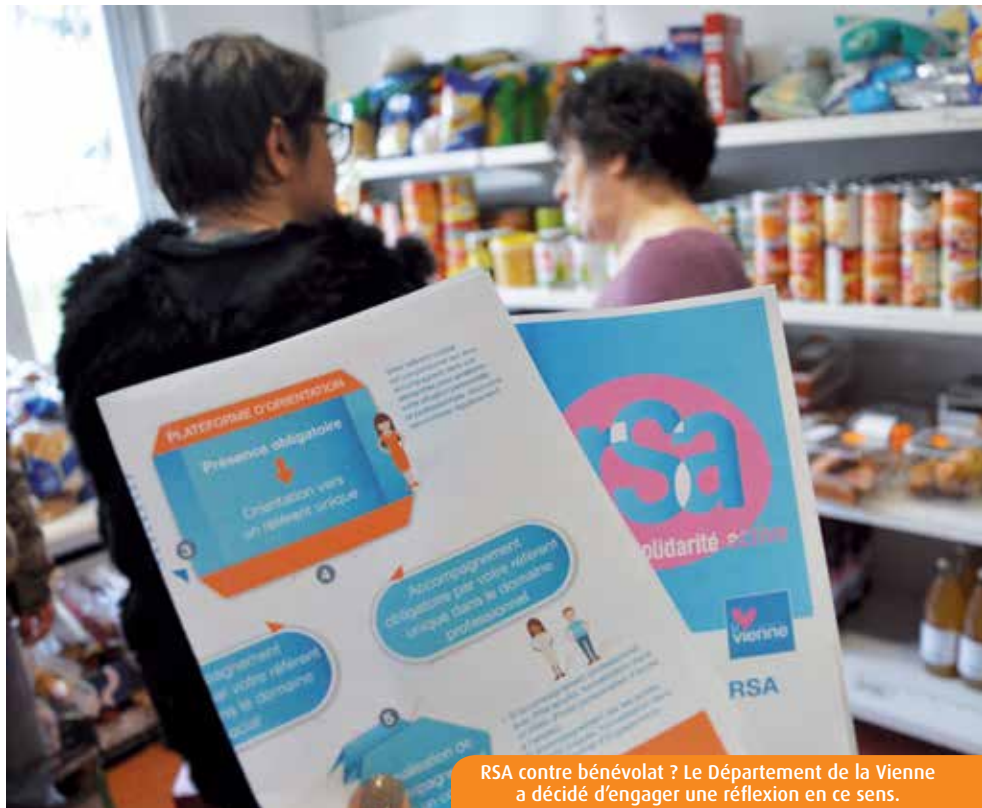
RSA contre bénévolat ? Le Département de la Vienne a décidé d'engager une réflexion en ce sens.