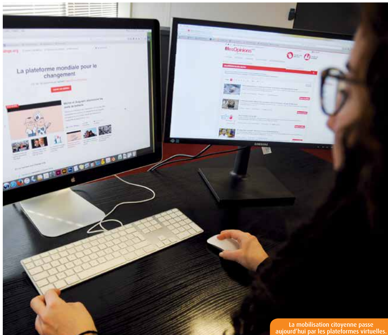
La mobilisation citoyenne passe aujourd'hui par les plateformes virtuelles.

Sur le terrain de la mobilisation citoyenne, les initiatives passent désormais par le Net. Plusieurs plateformes se partagent le marché des pétitions en ligne. Change.org et Mesopinions.com fédèrent de plus en plus d'internautes. Dont des milliers de Poitevins soucieux de défendre leur cause avec une audience élargie.