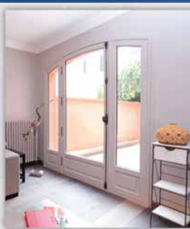
Fenêtres BOIS, PVC, ALU