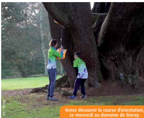
Venez découvrir la course d'orientation, ce mercredi au domaine de Givray.

Tarif : 4€/course. Dates et réservations sur www.poitiersco.org .