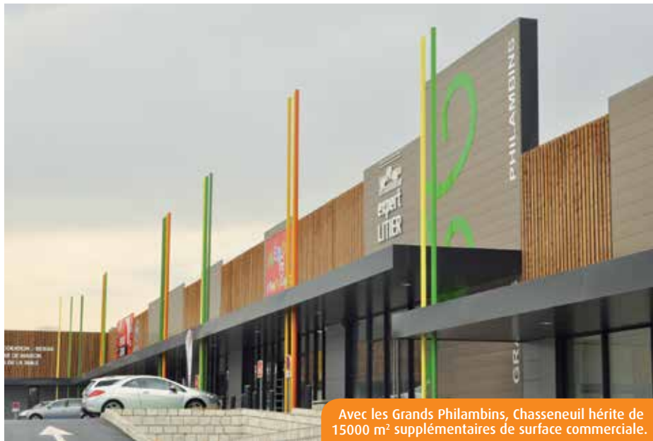
Avec les Grands Philambins, Chasseneuil hérite de 15000 m 2 supplémentaires de surface commerciale.

Eurodif, spécialiste de la mode et de la maison, Imaginéa, magasin de décoration et des arts de la table, Expert Litier,