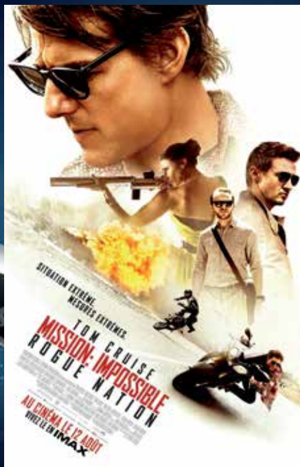
Film d'action américain de Christopher McQuarrie avec Tom Cruise, Jeremy Renner, Simon Pegg, Rebecca Ferguson (2h12).