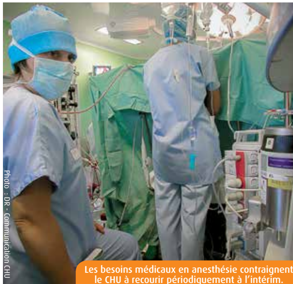
Les besoins médicaux en anesthésie contraignent le CHU à recourir périodiquement à l'intérim.