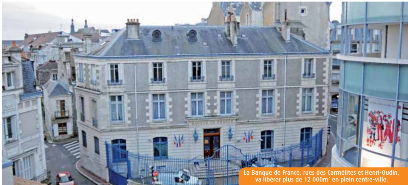
La Banque de France, rues des Carmélites et Henri-Oudin, va libérer plus de 12 000m 2 en plein centre-ville.