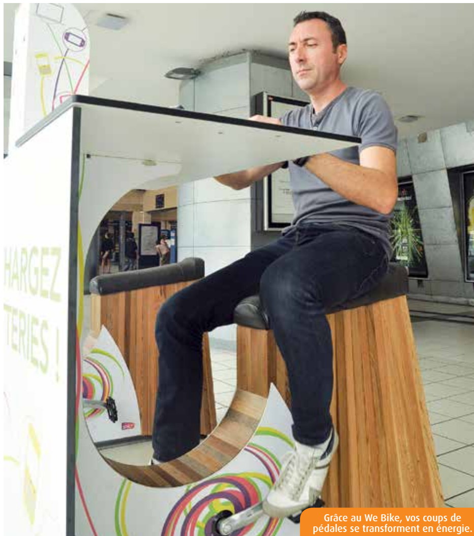
Grâce au We Bike, vos coups de pédales se transforment en énergie.

Les usagers semblent apprécier cette manière de « faire passer le temps ». « Mon train arrive dans vingt minutes. Plutôt que