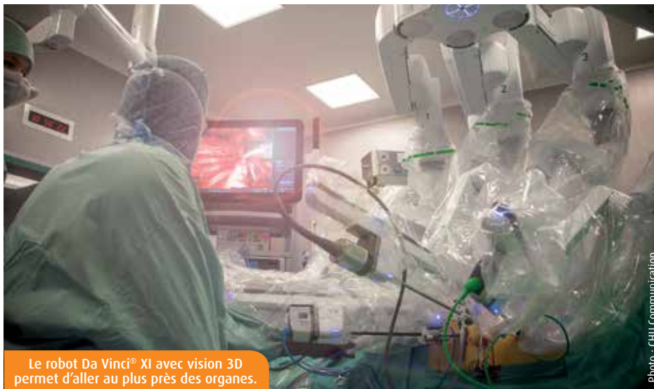
Le robot Da Vinci® XI avec vision 3D permet d'aller au plus près des organes.

Les démonstrations grand public suffisent à mesurer les potentialités offertes aux chirurgiens du cru. « L'association des capacités de rotation à 360° des deux bras télescopiques et de leurs pinces, et de l'imagerie 3D grossissante