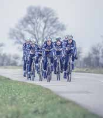
7apoitiers.fr ▶ N°294