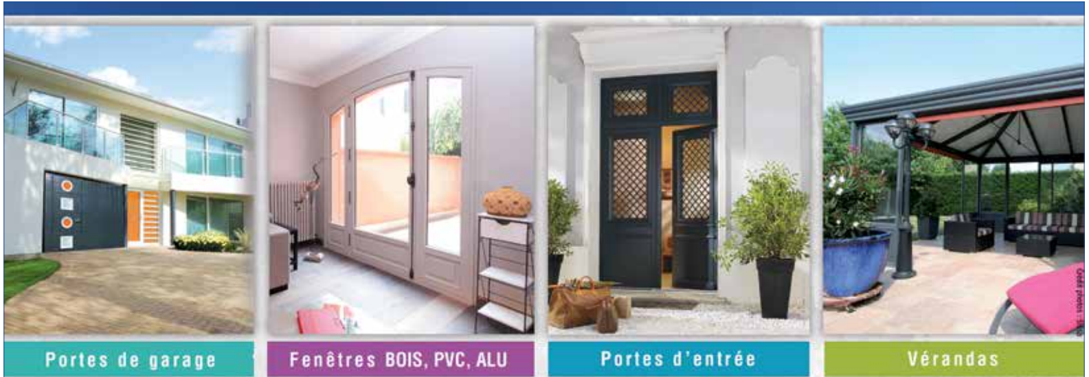
Portes de garage