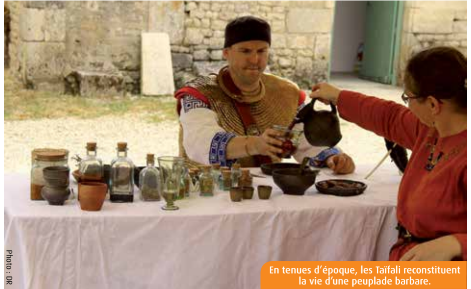
En tenues d'époque, les Taifali reconstituent la vie d'une peuplade barbare.

Depuis 2008, l'association Taifali reconstitue la vie d'une peuplade d'Europe de l'Est, arrivée en Poitou au IV e siècle. Au fil de leurs recherches historiques et archéologiques, les membres reproduisent tenues et objets à l'identique et se mettent en scène en public.