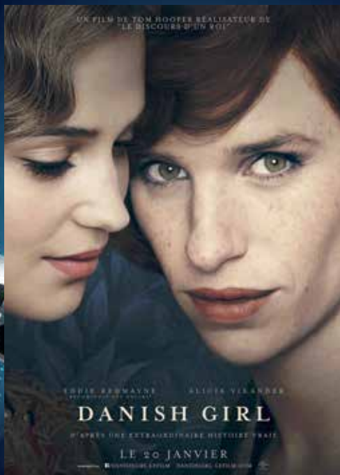
Tom Hooper, avec Eddie Redmayne, Alicia Vikander, Ben Whishaw (2h).