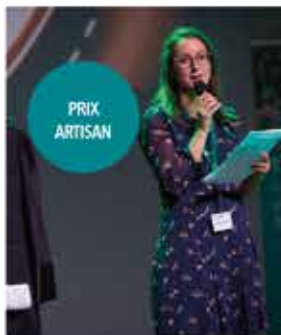
LA ROBE D'AUDIENCE