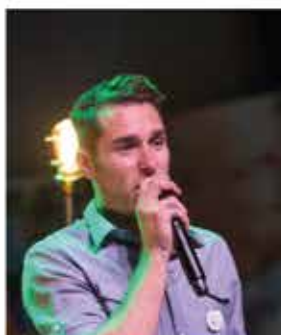
FISH AND CO