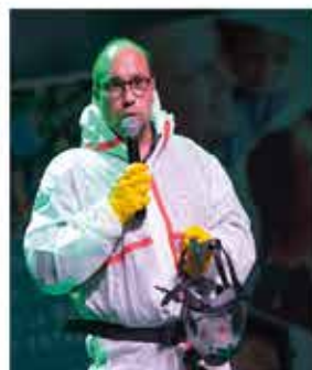
AMIANTE SOLUTION SERVICE