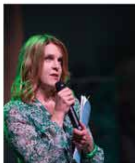
DANS LE MÊME PANIER