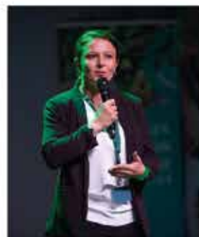
EPICERIE DE CHARROUX