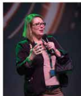
MYSTERIE Z EVENTS

Félicitations aux finalistes : Avec beaucoup d'émotion et de talent, chacune de leur prestation a suscité l'intérêt du public, du jury et des internautes.