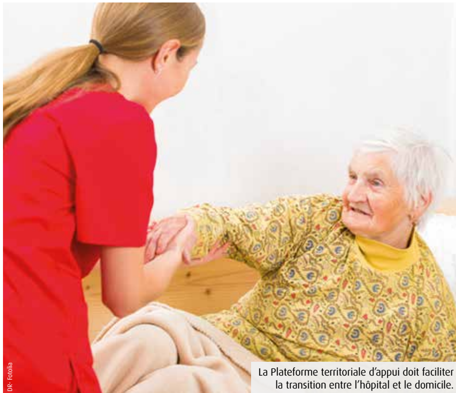
La Plateforme territoriale d'appui doit faciliter la transition entre l'hôpital et le domicile.

L'Agence régionale de santé a mis en place dans tous les départements de la Nouvelle-Aquitaine une Plateforme territoriale d'appui. L'objectif consiste à faciliter le maintien à domicile et le parcours de soins des patients avant ou après une hospitalisation. Un seul numéro : 0809 109 109.