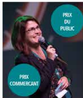
LES FILLES D'ARIANE