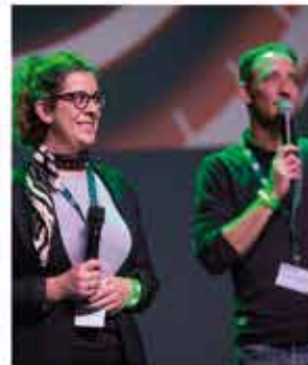
MY FRENCH EPICERIE