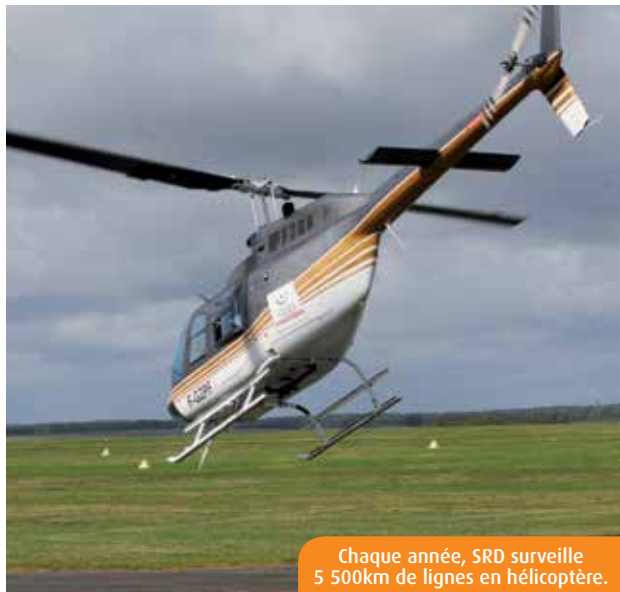
Chaque année, SRD surveille 5 500km de lignes en hélicoptère.

Pour faciliter la surveillance de ses lignes électriques aériennes, SRD, gestionnaire du réseau de distribution du Syndicat Energies Vienne, procède chaque année à un survol en hélicoptère. Une opération certes coûteuse, mais qui permet de prévenir deux tiers des pannes potentielles.