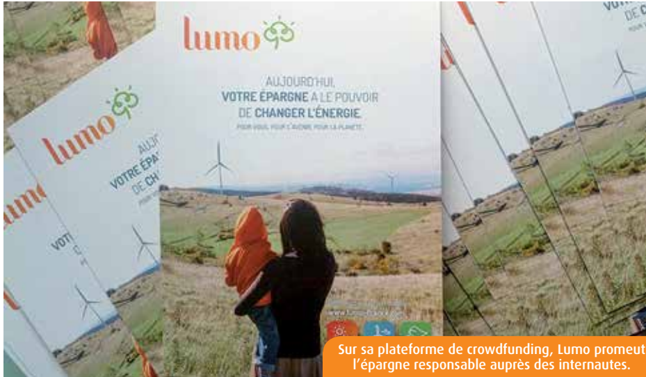
Sur sa plateforme de crowdfunding, Lumo promeut l'épargne responsable auprès des internautes.

Dans la Vienne, Autour des Plantes, L'Alterbative, l'Etoile