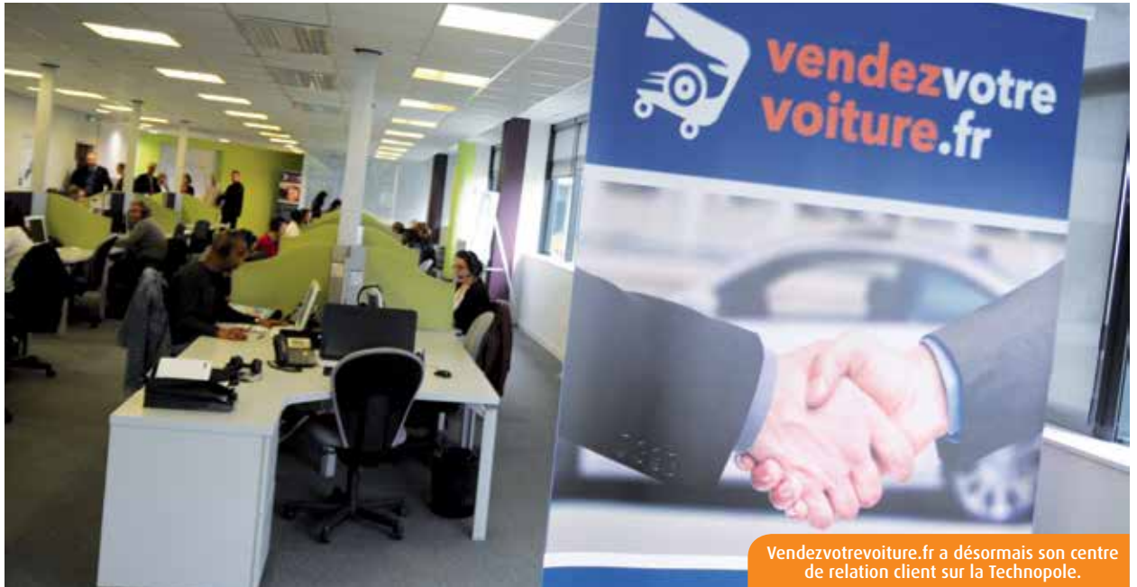
Vendezvotrevoiture.fr a désormais son centre de relation client sur la Technopole.