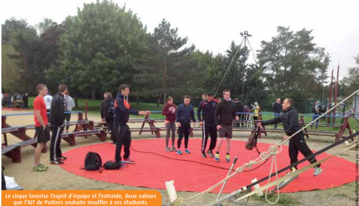
Le cirque favorise l'esprit d'équipe et l'entraide, deux valeurs que l'IUT de Poitiers souhaite insuffler à ses étudiants.

La Ligue des optimistes de France a été créée en 2010 pour « valoriser l'optimisme et l'attitude mentale positive dans tous les compartiments de la société ». En lien avec une poignée de dirigeants poitevins, l'association organise, mardi prochain, à 19h30, à la Tomate Blanche, un « dîner des optimistes ». La soirée est ouverte à tous. Renseignements au 06 18 16 64 72.