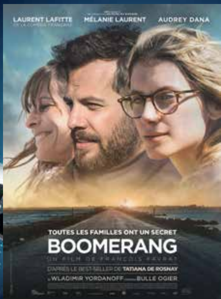
Film de François Favrat avec Laurent Lafitte, Mélanie Laurent, Audrey Dana (1h45)