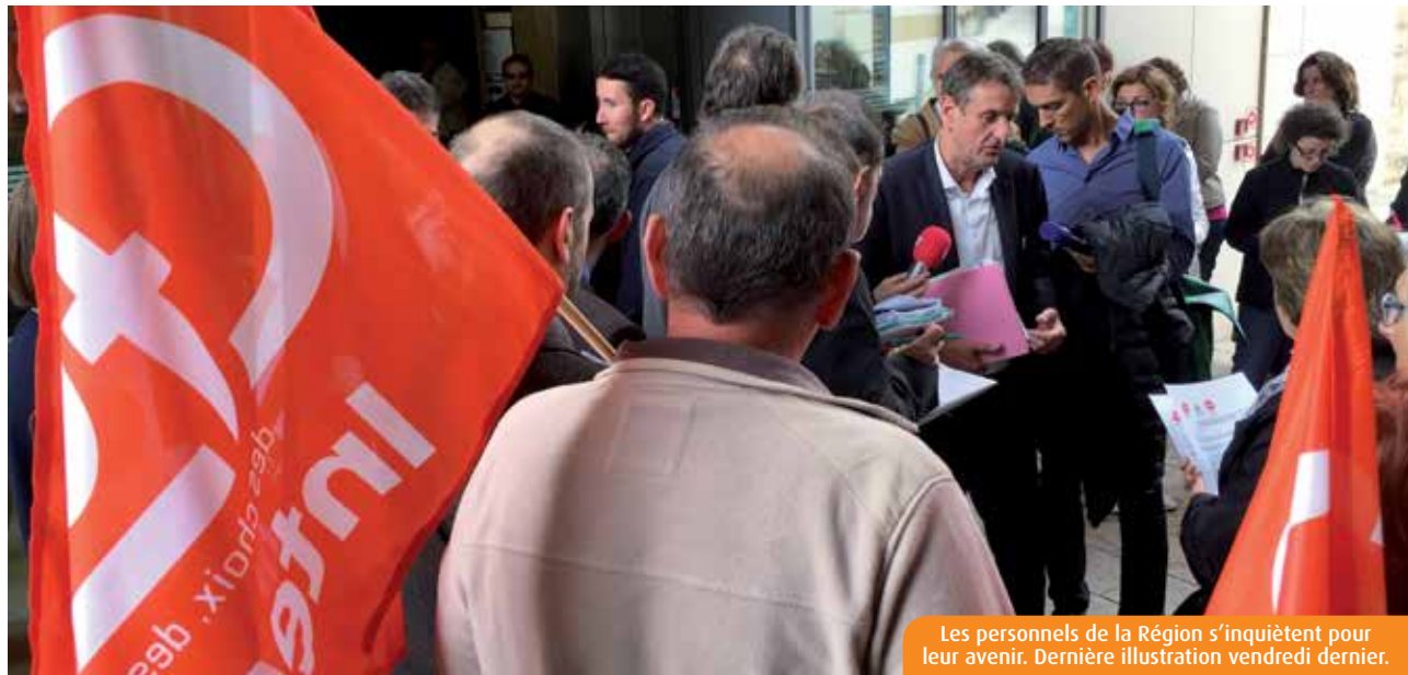
Les personnels de la Région s'inquiètent pour leur avenir. Dernière illustration vendredi dernier.