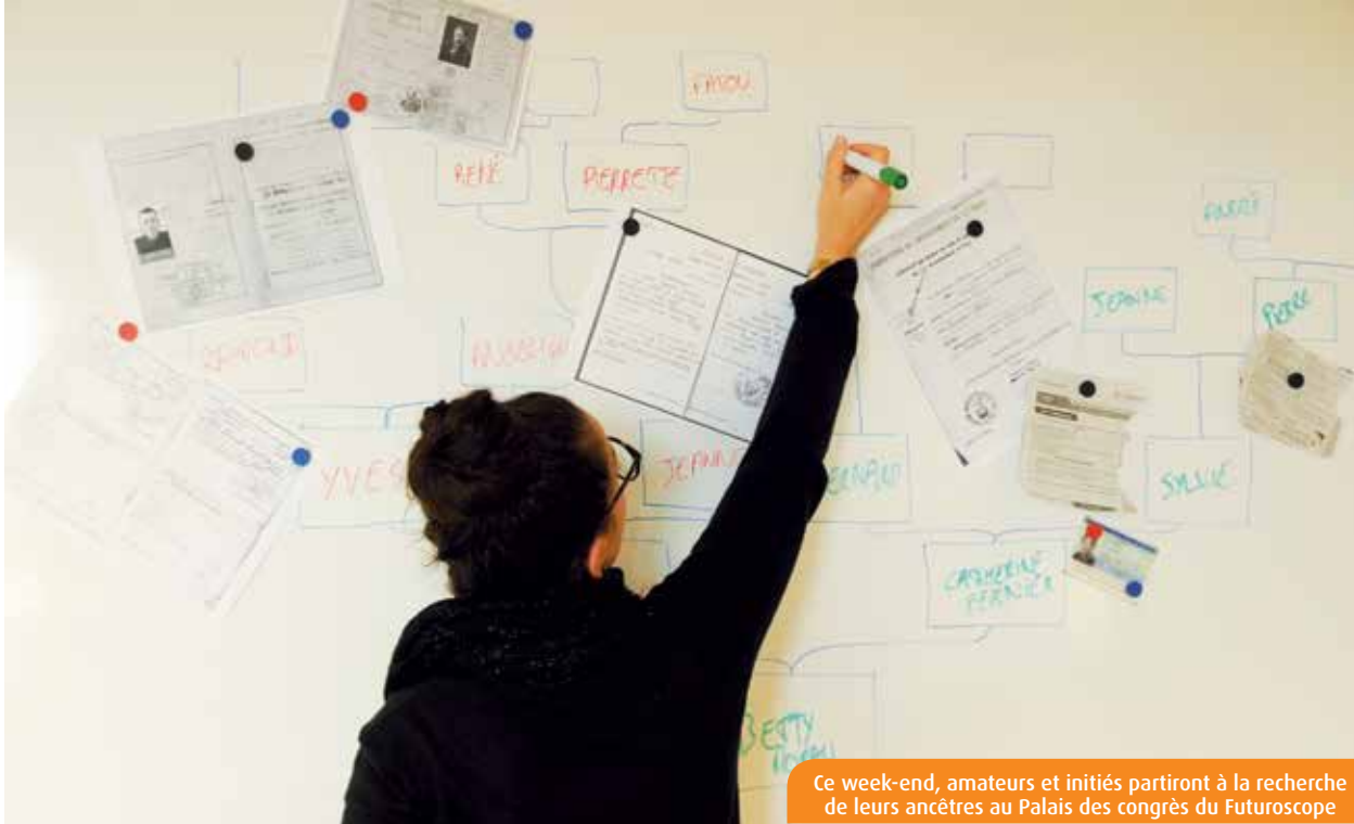
Ce week-end, amateurs et initiés partiront à la recherche de leurs ancêtres au Palais des congrès du Futuroscope

De vendredi à dimanche, le Palais des congrès du Futuroscope accueille, pour la première fois, le Congrès national de généalogie. Une manifestation résolument ouverte à tous, qui espère la visite de cinq mille amateurs et curieux.