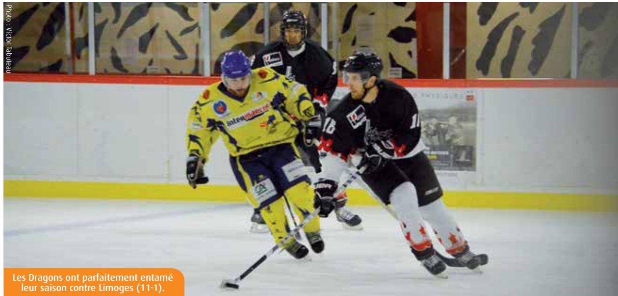
Les Dragons ont parfaitement entamé leur saison contre Limoges (11-1).