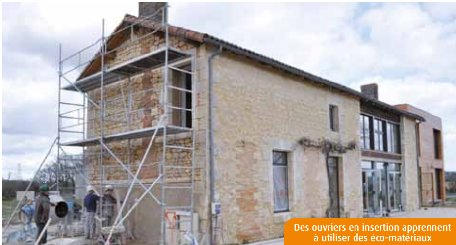
Des ouvriers en insertion apprennent à utiliser des éco-matériaux

Transformer une ancienne maison de ferme en médiathèque municipale, grâce à des éco-matériaux. Telle est la mission de l'association Vienne et Moulière Solidarité. Le samedi 22 mars, le chantier, situé à Savigny-Lévescault, sera ouvert au public. « L'objectif est de montrer aux habitants du territoire qu'il est possible de rénover sa maison à moindre coût et surtout avec des matériaux qui ne sont pas nocifs pour l'environnement », explique Jean-Paul Pallueau, président de VMS. Le sol est recouvert d'une dalle chaux-chanvre, reconnue pour ses propriétés isolantes. En parlant d'isolation, la fibre de bois et la laine de chanvre ont été préférées à la ouate de cel-