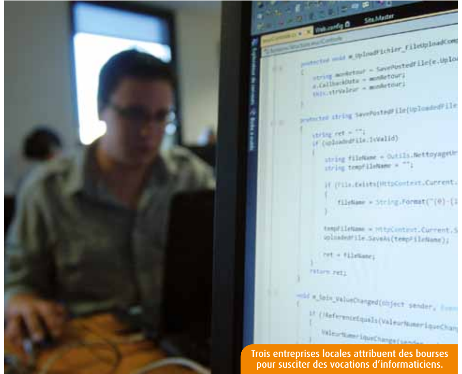
Trois entreprises locales attribuent des bourses pour susciter des vocations d'informaticiens.

Ses compétences de très haut niveau dans le développement de logiciels en langage Java amènent Serli à travailler pour des clients comme Google et Oracle. Pour s'assurer un vivier de jeunes ingénieurs au top niveau, l'équipe s'est toujours fortement impliquée dans la vie des établissements locaux, en donnant des cours ou en participant à des jurys de thèse... Désormais, Jérôme Petit passe