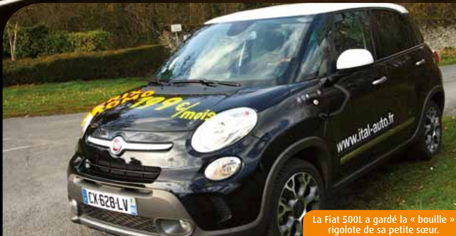
La Fiat 500L a gardé la « bouille » rigolote de sa petite sœur.

A vec plus d'un million d'exemplaires vendus dans cent pays en à peine cinq ans, la Fiat 500 bénéficie d'un indiscutable capital de sympathie auprès des clients. Et surtout des conductrices. Le constructeur italien a voulu surfer sur cette vague en déclinant ce design original en plusieurs monospaces. Mais à vrai dire, seuls l'avant et les gros phares ronds de la 500L rappellent ceux de sa petite sœur. Pour le reste, cette géante de 4,15m (voire 4,27m pour la Trekking et 4,35m pour la Living 7 places) possède un physique de « bodybuilder » qui lui ouvre de nouveaux marchés. La Fiat 500L, c'est d'abord une Fiat 500, avec un vrai coffre de 343 litres équipé du « cargo magi-