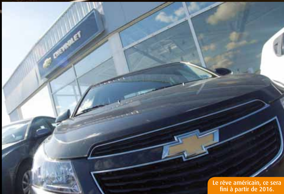
Le rêve américain, ce sera fini à partir de 2016.