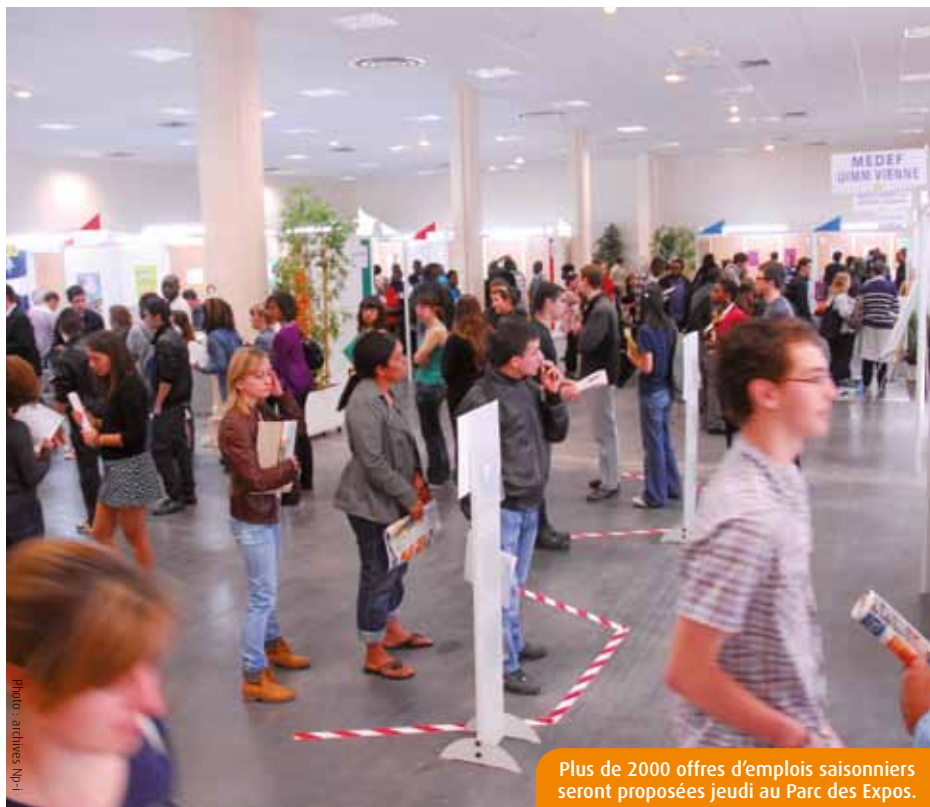
Plus de 2000 offres d'emplois saisonniers seront proposées jeudi au Parc des Expos.