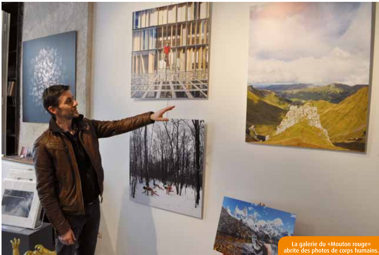
La galerie du «Mouton rouge» abrite des photos de corps humains.