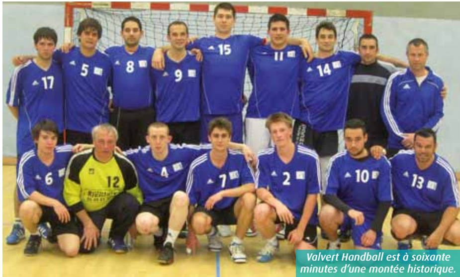
Valvert Handball est à soixante minutes d'une montée historique.

Née, il y a deux ans à peine, de la fusion entre les sections de Saint-Georges et Jaunay-Clan, « VH » se retrouve, presque malgré elle, aux portes d'un exploit retentissant. L'équipe 1 masculine du club est en effet