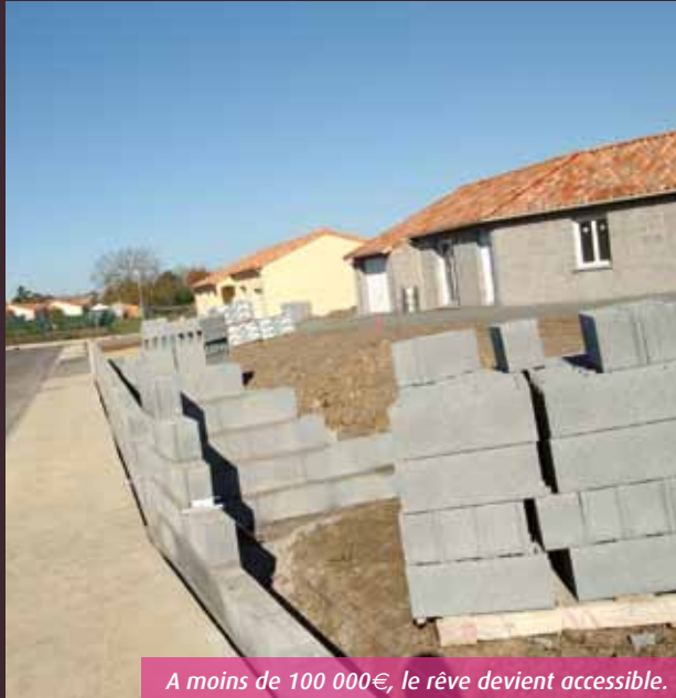
A moins de 100 000€, le rêve devient accessible.

Certains constructeurs ont développé de véritables stratégies pour réduire le prix de leurs maisons, tout en conservant des normes de qualité. A Poitiers, Mikit et Maison Uno trouvent peu à peu leur clientèle.