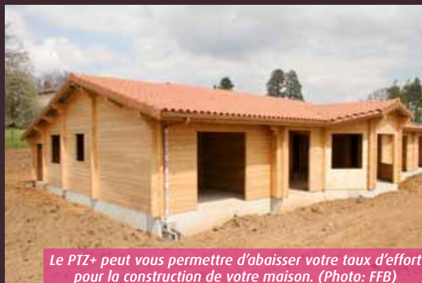
Le PTZ+ peut vous permettre d'abaisser votre taux d'effort pour la construction de votre maison.

Pour prétendre au PTZ+, l'acquéreur ne doit pas avoir été propriétaire de sa résidence principale au cours des deux années précédant l'offre de prêt. Il doit en outre respecter un certain plafond de res-