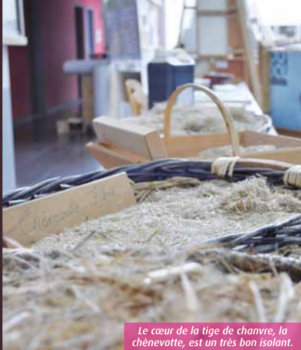
Le cœur de la tige de chanvre, la chènevotte, est un très bon isolant.