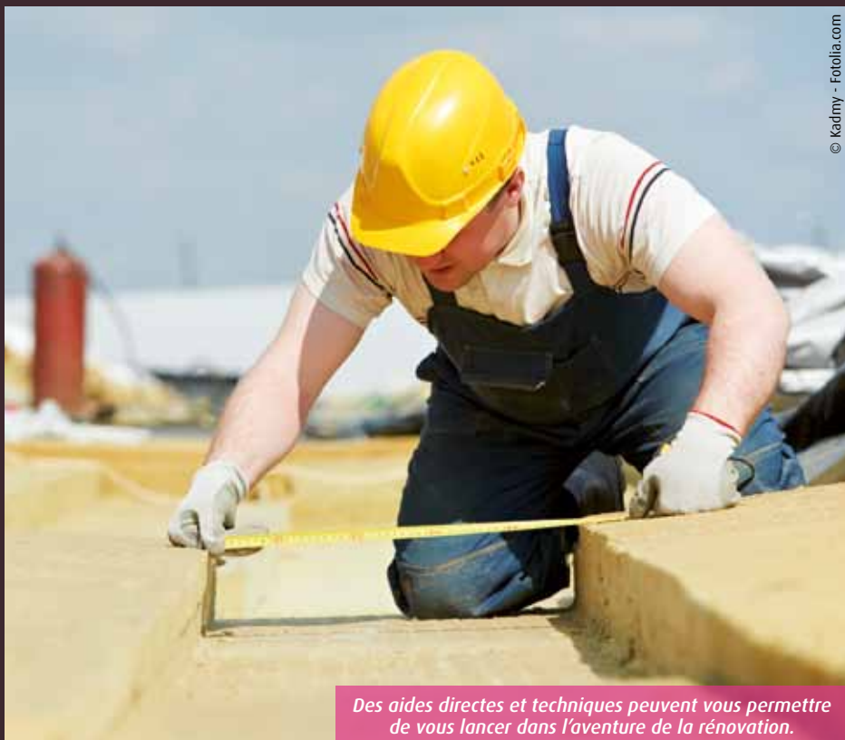
Des aides directes et techniques peuvent vous permettre de vous lancer dans l'aventure de la rénovation.

Selon Madame la préfète, « les dispositifs d'aides directes et techniques sont légion, mais trop peu de particuliers y ont recours ». Et pourtant. Avec l'élargissement, au 1 er juin, des barèmes d'éligibilité, c'est désormais la moitié des ménages de la région qui peut bénéficier de ces coups de pouce. Encore faut-il le savoir !