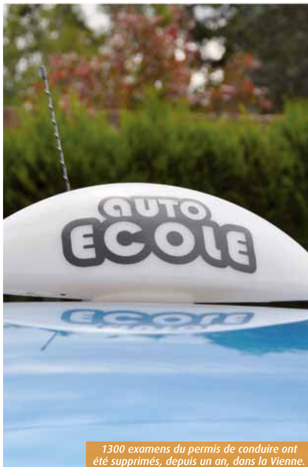
1300 examens du permis de conduire ont été supprimés, depuis un an, dans la Vienne.

Leurs enseignes ont depuis longtemps pignon sur rue à Poitiers et dans son agglomération. Ils ont pourtant préféré se réfugier derrière l'étendard de leurs syndicats (Unic, CNPA, Fnecc (*) ...) pour expectorer leur douleur. « Il est possible que certains de nos confrères ne se plaignent pas de leurs conditions de travail, mais nous sommes une grande majorité à frôler l'asphyxie et à craindre pour la pérennité de notre activité. » A l'origine de ce cri du cœur, le non remplacement d'un inspecteur du permis de conduire, agressé par un candidat, l'été dernier, du côté de Châtelleraut. « Ces inspecteurs étaient huit, ils ne sont plus que sept, éclairent les patrons d'auto-écoles. Depuis près d'un an, cette seule perte a entraîné la suppression de 1300 heures d'examen et, par