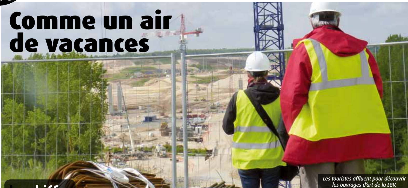
Les touristes affluent pour découvrir les ouvrages d'art de la LGV.