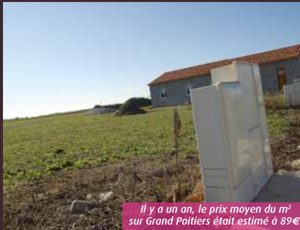
Il y a un an, le prix moyen du m 2 sur Grand Poitiers était estimé à 89€.

Cette mesure, on l'aura compris, ambitionne de relancer la construction, par la mobilisation de réserves foncières jusque-là conservées « au chaud » par leurs propriétaires. Elle n'est toutefois ni en vigueur, ni même votée. Dans l'attente, les candidats à l'achat doivent donc se résoudre à affronter les prix, parfois exorbitants, imposés par les vendeurs, particuliers, communes et lotisseurs privés.