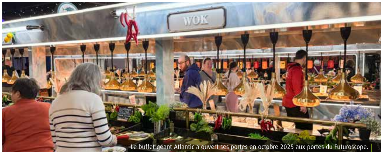
Le buffet géant Atlantic a ouvert ses portes en octobre 2025 aux portes du Futuroscope.

Des débuts encourageants Depuis son ouverture, Atlantic