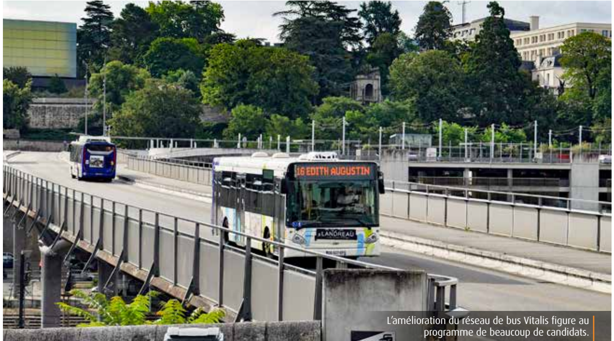
L'amélioration du réseau de bus Vitalis figure au programme de beaucoup de candidats.

Rendre les bus gratuits pour les moins de 12 ans. C'est la mesure phare du programme d'Anthony Brottier, lequel veut étendre la gratuité sur le réseau au mercre-