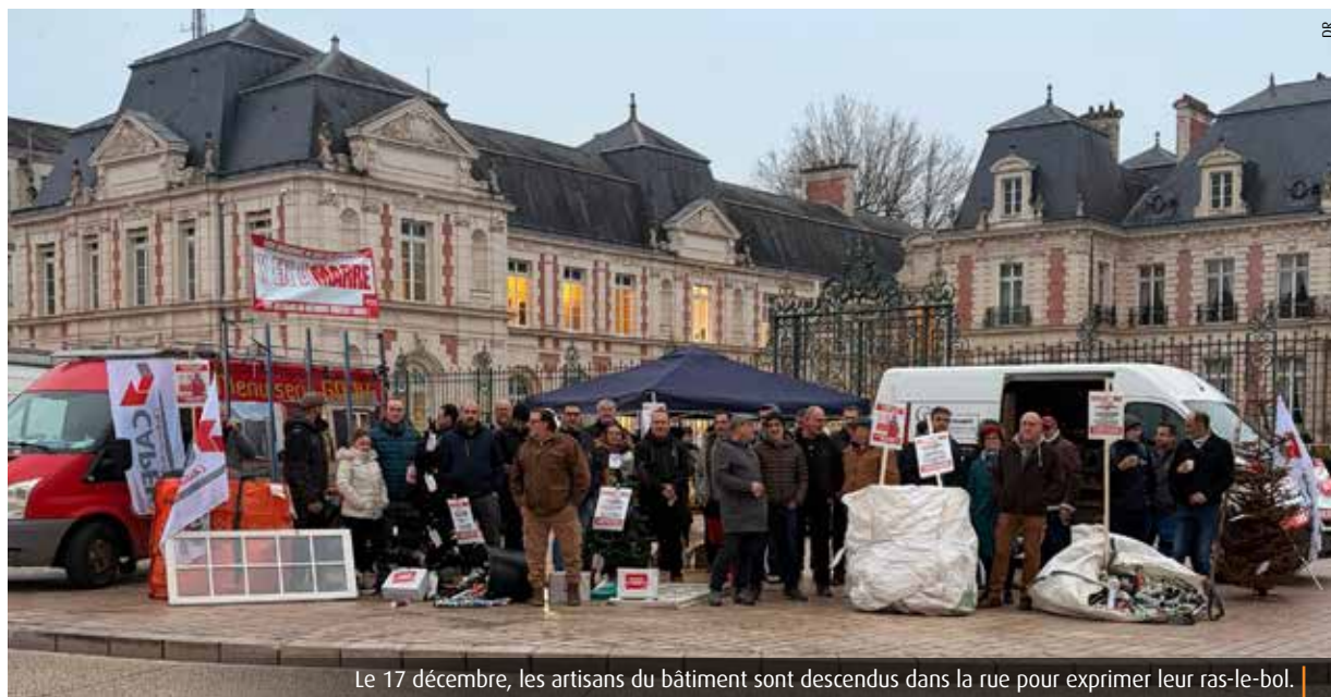
Le 17 décembre, les artisans du bâtiment sont descendus dans la rue pour exprimer leur ras-le-bol.

C'est la somme allouée par la Région Nouvelle-Aquitaine à la société coopérative Ielo, située à Bonneuil-Matours. La Scic développe et commercialise une solution d'isolation française 100% naturelle à partir de paille de blé. La Phi® est déjà déployée sur plus de trente chantiers à l'échelle nationale, dont La Caserne, à Poitiers (cf. photo). Ielo compte aujourd'hui 171 sociétaires, 8 salariés et affichait en 2024 un chiffre d'affaires de 300 000€ contre 17 000€ un an plus tôt.