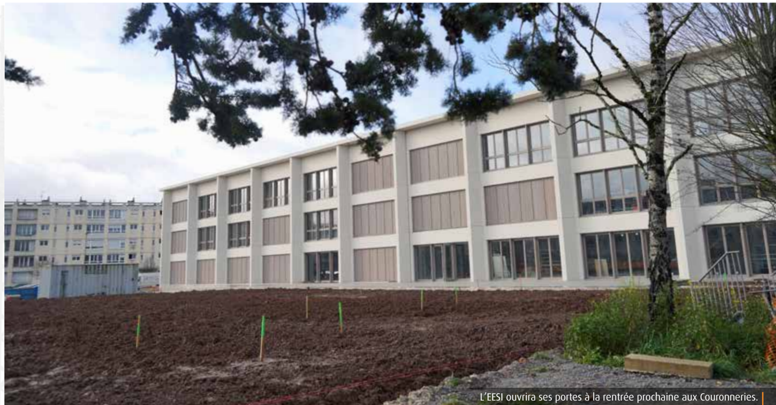
L'EESI ouvrira ses portes à la rentrée prochaine aux Couronneries.

Aux Couronneries, à Poitiers, les locaux de l'Ecole européenne supérieure de l'image prennent peu à peu forme. Les 4 451m 2 de locaux responsables et durables de l'établissement seront investis, dès la prochaine rentrée, par 120 étudiants et une trentaine d'enseignants et de personnels.