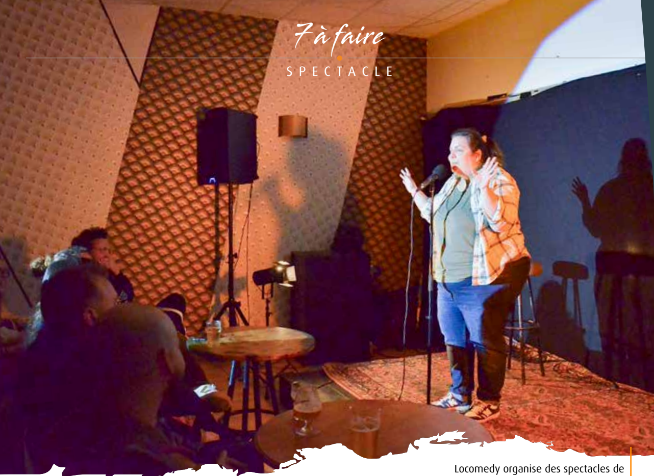
Locomedy organise des spectacles de stand-up dans les bars de Poitiers.