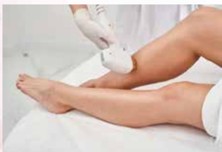
Épilation définitive laser

Une qualité premium • Une équipe d'expertes à votre service