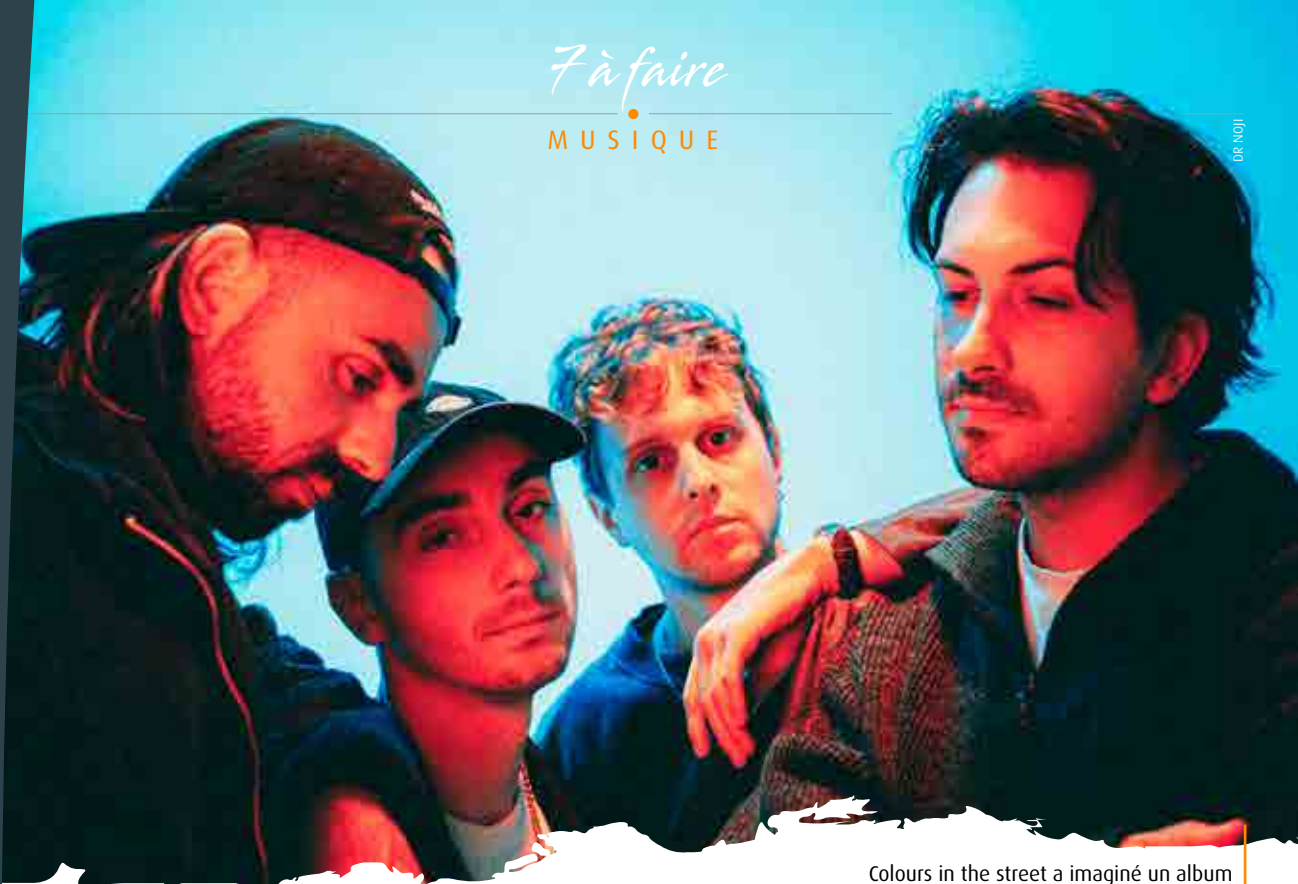
Colours in the street a imaginé un album en forme de bande-son de nos vies.