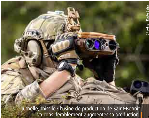
Jumelle, missile : l'usine de production de Saint-Benoît va considérablement augmenter sa production.

« Sur ces dispositifs, notre volume de production doit être multiplié par deux d'ici la fin d'année. » Ces équipements, appelés autodirecteurs, sont fabriqués dans les usines de Saint-Benoît puis assemblés à Montluçon. Ils équipent éga-