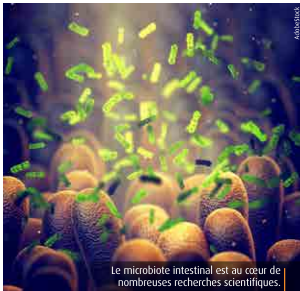
Le microbiote intestinal est au cœur de nombreuses recherches scientifiques.

Une étude menée par des médecins du CHU de Poitiers et publiée dans la revue internationale Gut remet en question la pertinence des tests de microbiote intestinal proposés en libre accès par certains laboratoires (1) . Selon leurs travaux, ces analyses, vendues sans prescription médicale et à des tarifs élevés (entre 150 et 250€), présenteraient un manque de fiabilité susceptible d'induire les patients en erreur. Le microbiote intestinal (l'ensemble des micro-organismes présents dans l'intestin) fait l'objet de nombreuses recherches scientifiques. Son déséquilibre est associé à plusieurs pathologies, notamment