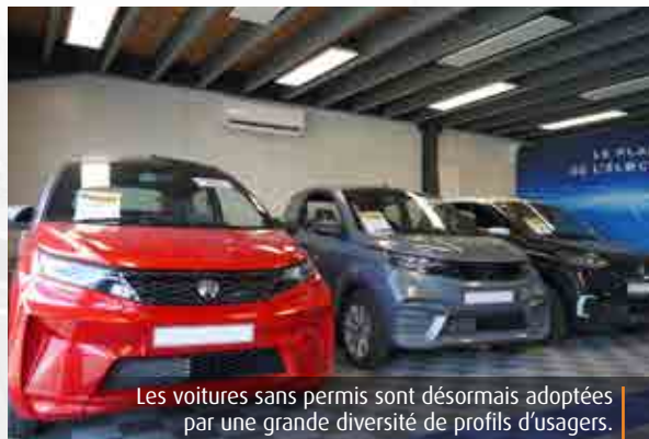
Les voitures sans permis sont désormais adoptées par une grande diversité de profils d'usagers.

Alors, qui compose réellement le cœur de clientèle ? « Cela va de 14 à 80 ans. Cette