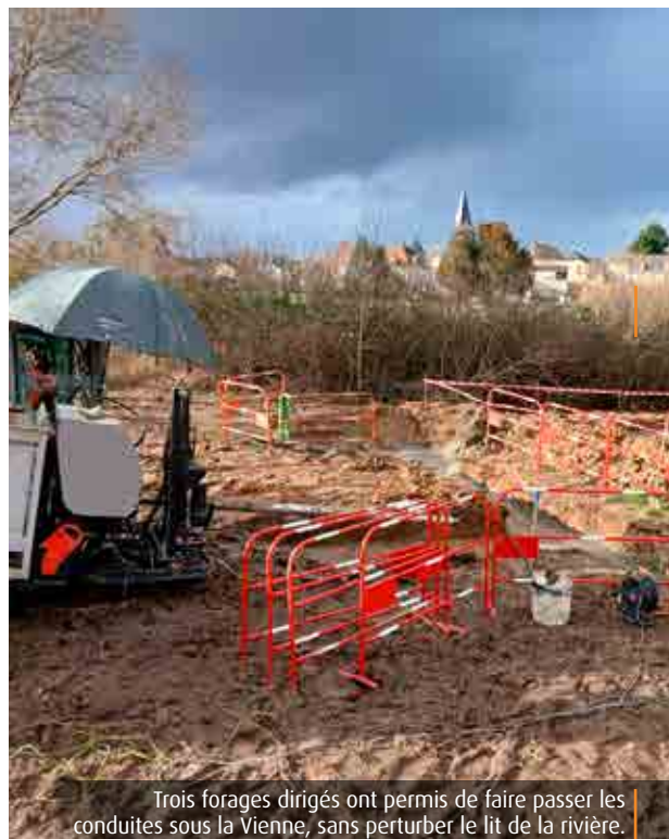
Trois forages dirigés ont permis de faire passer les conduites sous la Vienne, sans perturber le lit de la rivière.

Au nord de Châtellerauld, un vaste chantier de modernisation des réseaux d'eau potable et d'assainissement est en cours. Trois forages ont été réalisés sous la Vienne afin de sécuriser l'alimentation en eau de dizaines de milliers d'habitants du Châtellerauldais.