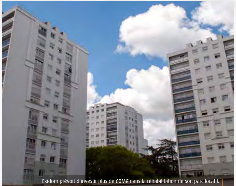
Ekidom prévoit d'investir plus de 60M€ dans la réhabilitation de son parc locatif.

Au total, 225 logements seront livrés en 2026 sur le territoire de Grand Poitiers. Parmi les projets majeurs figure Garden