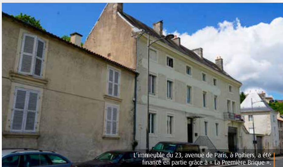
L'immeuble du 23, avenue de Paris, à Poitiers, a été financé en partie grâce à « La Première Brique ».

En cinq ans d'existence, ce sont quelque 850 projets qui ont été menés à bien partout en France et pas moins de 380M€ financés grâce à l'épargne des