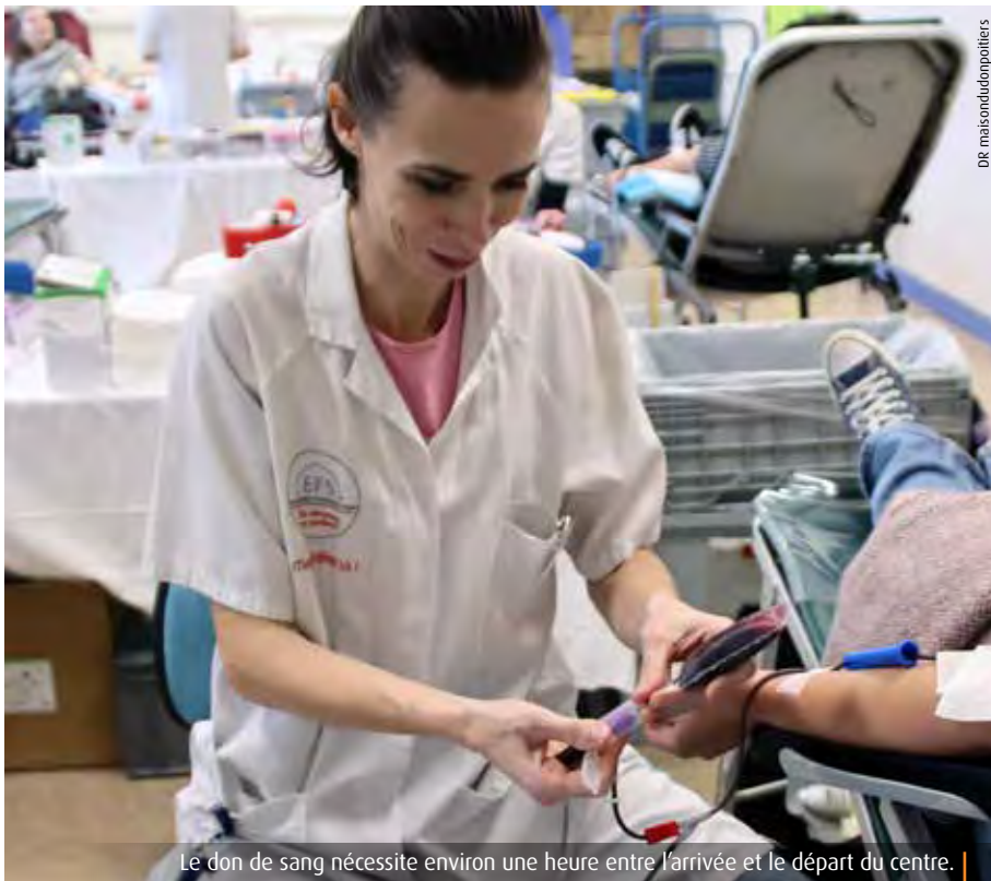
Le don de sang nécessite environ une heure entre l'arrivée et le départ du centre.