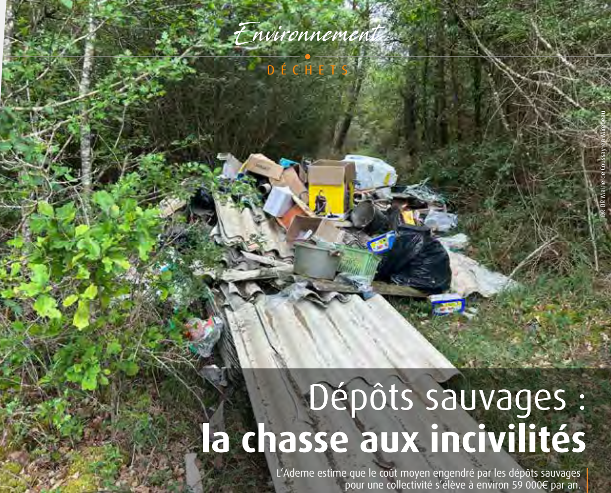
Maire de Coussay-en-Touraine