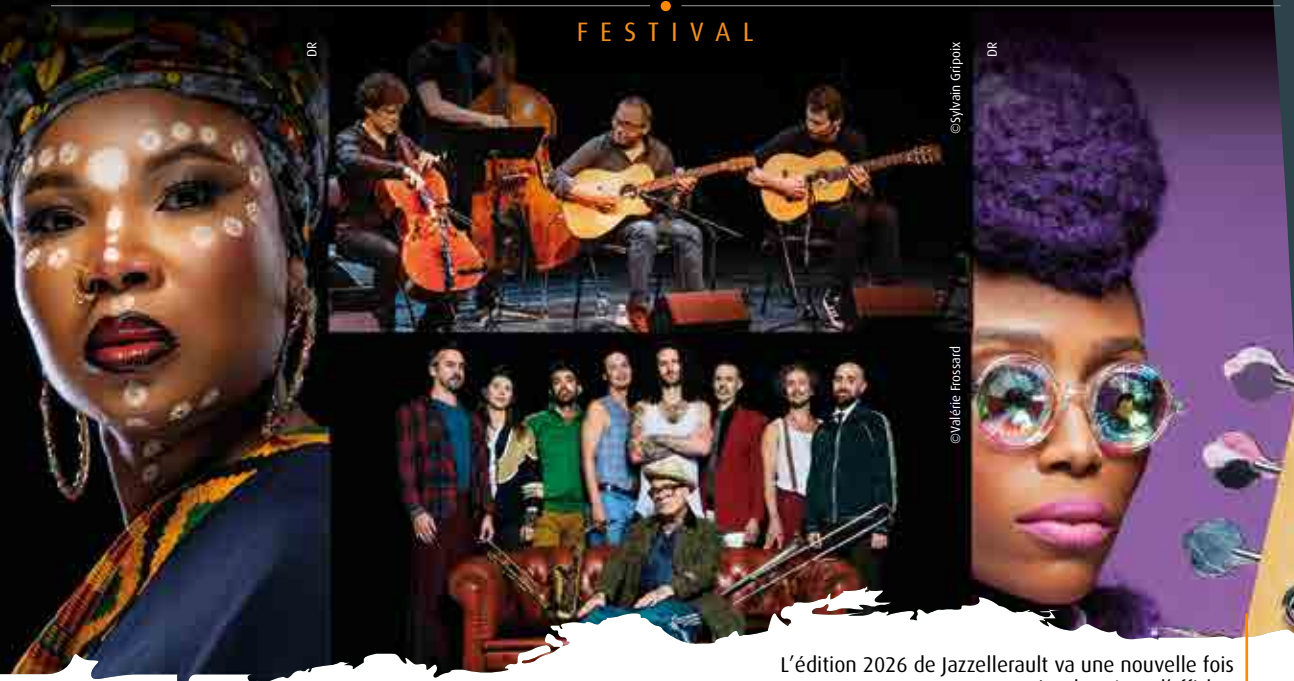
L'édition 2026 de Jazzelleraut va une nouvelle fois attirer les têtes d'affiche.