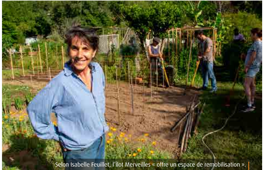
Selon Isabelle Feuillet, l'îlot Merveilles « offre un espace de remobilisation ».