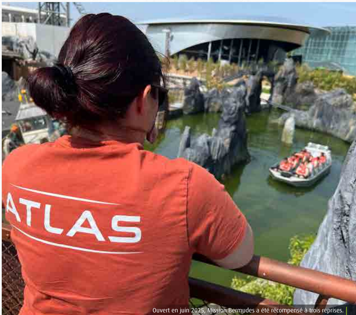
Ouvert en juin 2025, Mission Bermudes a été récompensé à trois reprises.