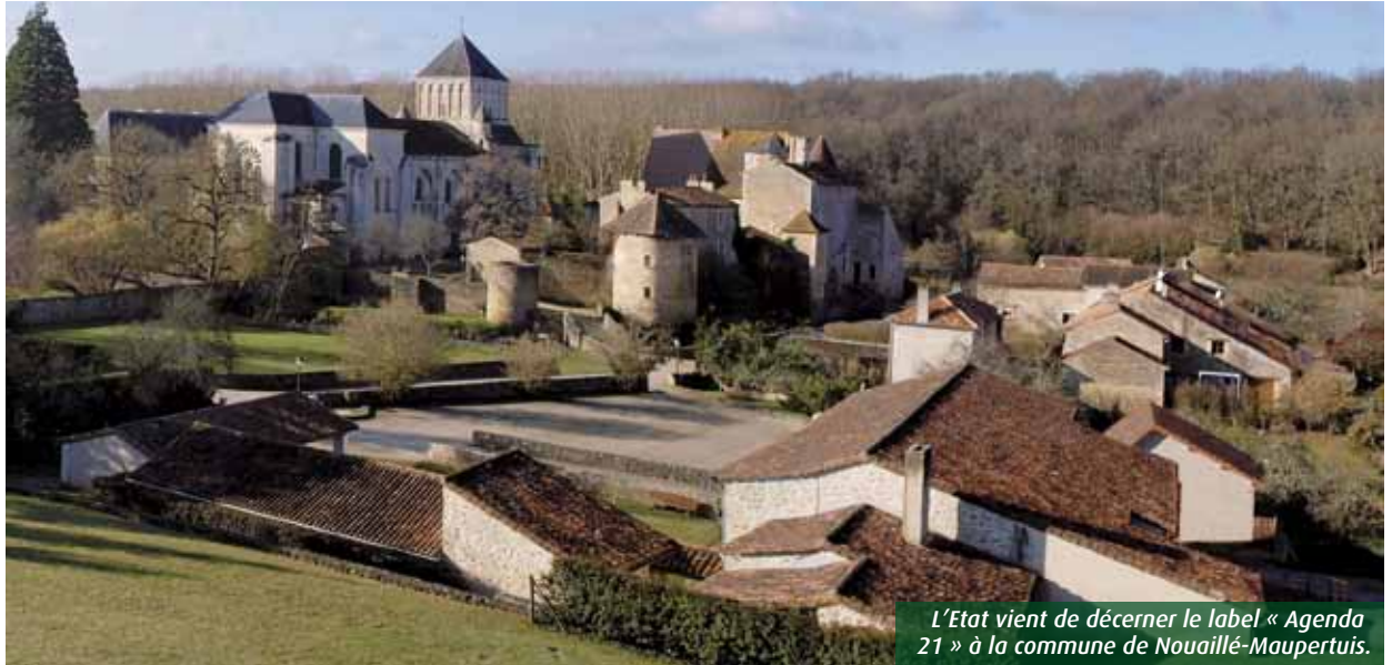
L'Etat vient de décerner le label « Agenda 21 » à la commune de Nouaillé-Maupertuis.

La commune de Nouaillé-Maupertuis vient de décrocher le label « Agenda 21 ». La municipalité doit désormais remplir plusieurs objectifs en matière de développement durable.