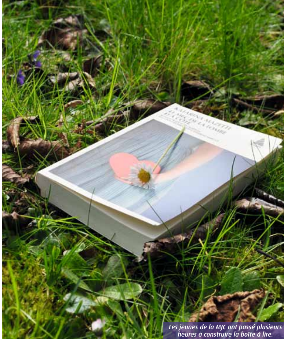
Les jeunes de la MJC ont passé plusieurs heures à construire la boîte à lire.

Totalement conquise par cette étonnante idée, la Poitevine a lancé le collectif « Libérez le livre ». « Nous avons envie de donner une seconde vie à ces ouvrages, romans, encyclopédies... » Pour concrétiser ce beau projet, les quatre membres ont décidé de construire une « boîte à lire ». Il s'agit d'une petite bibliothèque, déposée dans un lieu public, où tout le monde peut donner ou prendre à sa guise. Le travail de réalisation a été confié aux jeunes de la rési-