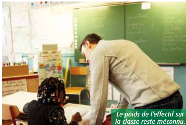
Le poids de l'effectif sur la classe reste méconnu.