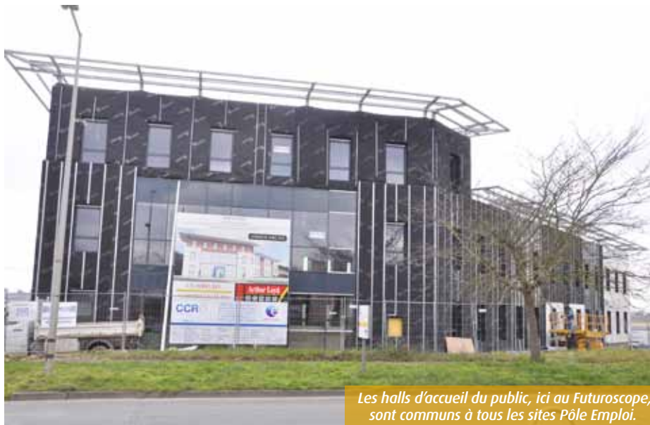
Les halls d'accueil du public, ici au Futuroscope, sont communs à tous les sites Pôle Emploi.

■ Nicolas Boursier nboursier@7apoitiers.fr