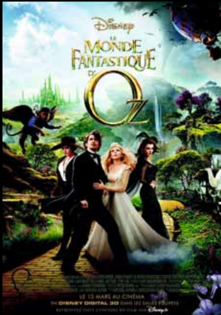
Film fantastique de Sam Raimi avec James Franco, Mila Kunis, Rachel Weisz (2h07).