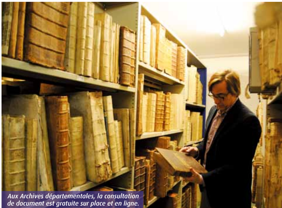
Aux Archives départementales, la consultation de document est gratuite sur place et en ligne.