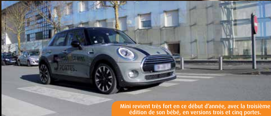
Mini revient très fort en ce début d'année, avec la troisième édition de son bébé, en versions trois et cinq portes.

Treize ans après la mise en circulation de son premier modèle, produit par BMW, Mini revient très fort en ce début d'année, avec la troisième édition de son bébé, en versions trois et cinq portes. Toujours aussi belle, pétillante et agile, elle est aussi bien plus performante et confortable que ses grandes sœurs. Une ligne sportive et urbaine, un châssis retravaillé, un habitacle plus soigné qu'autrefois... Le résultat, fruit de la collaboration entre les constructeurs du groupe BMW (Rolls Royce, Mini, BMW), est éclatant. Même si les équipements de