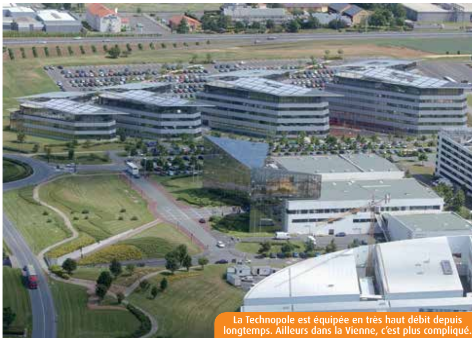
La Technopole est équipée en très haut débit depuis longtemps. Ailleurs dans la Vienne, c'est plus compliqué.

Dans la Vienne, aménagement du territoire rime avec investissements numériques. Le Département et ses partenaires vont déboursier 47M€ à l'horizon 2020, mais les effets resteront limités sur l'accès à Internet dans les zones les plus reculées.