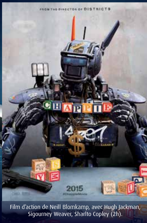
Film d'action de Neill Blomkamp, avec Hugh Jackman, Sigourney Weaver, Sharlito Copley (2h).