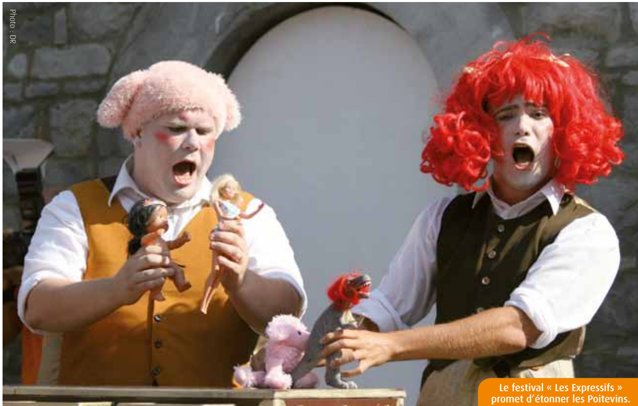
Le festival « Les Expressifs » promet d'étonner les Poitevins.

Le festival pluri-disciplinaire « Les Expressifs » se tient de jeudi à dimanche, à Poitiers. Les habitants devront mettre la main à la pâte et se joindre à des « projets participatifs ». Pour le meilleur et pour le rire !