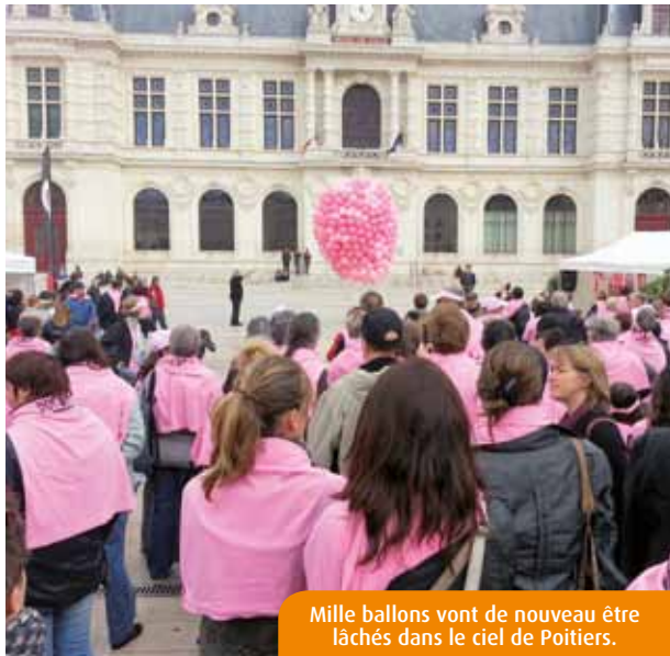
Mille ballons vont de nouveau être lâchés dans le ciel de Poitiers.