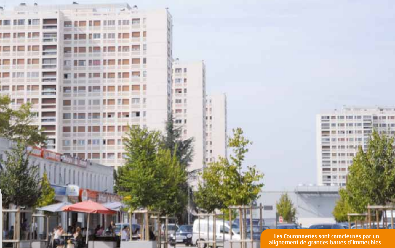
Les Couronneries sont caractérisés par un alignement de grandes barres d'immeubles.