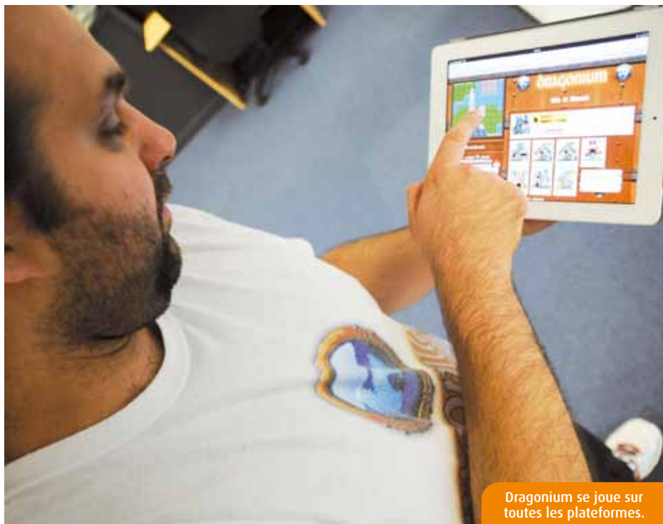
Dragonium se joue sur toutes les plateformes.

Aujourd'hui, cent cinquante aficionados s'échinent à rejoindre des guildes, à amasser des pièces