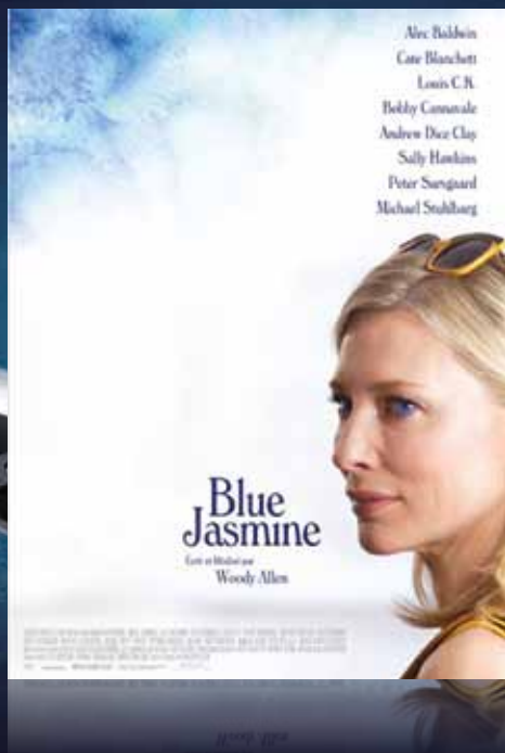
Comédie dramatique de Woody Allen avec Alec Baldwin, Cate Blanchett, Sally Hawkins (1h38).