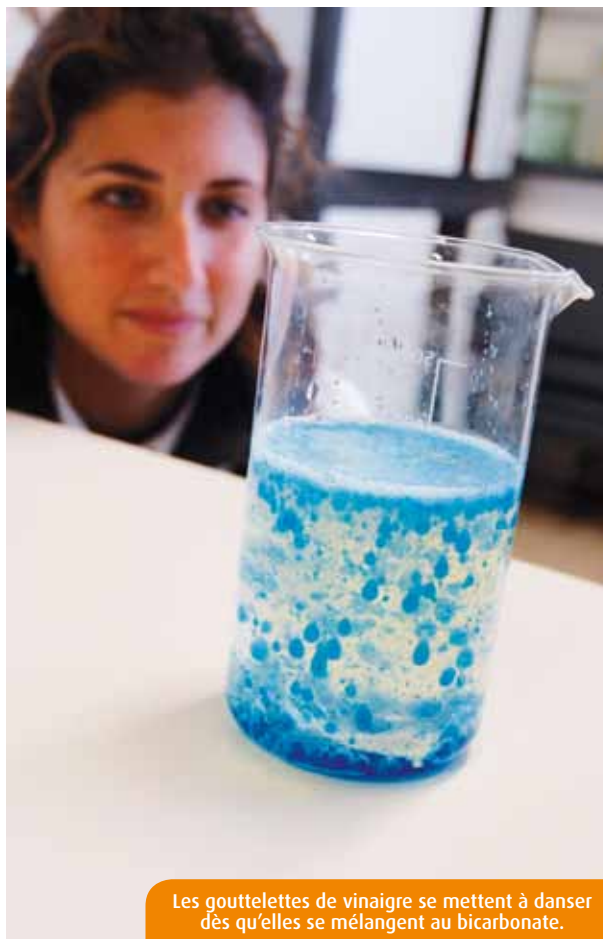
Les gouttelettes de vinaigre se mettent à danser dès qu'elles se mélangent au bicarbonate.

Versez deux cuillères à café de bicarbonate de soude en remplissant le fond du pot. Complétez avec une bonne dose d'huile. Si des particules remontent, vous pouvez rajouter du bicarbonate. Dans un petit récipient à part, versez le vinaigre blanc et le colorant alimentaire. Notez bien que le seul risque de cette manipulation est de se repeindre les mains. Versez la solution obtenue dans le grand pot de confiture.