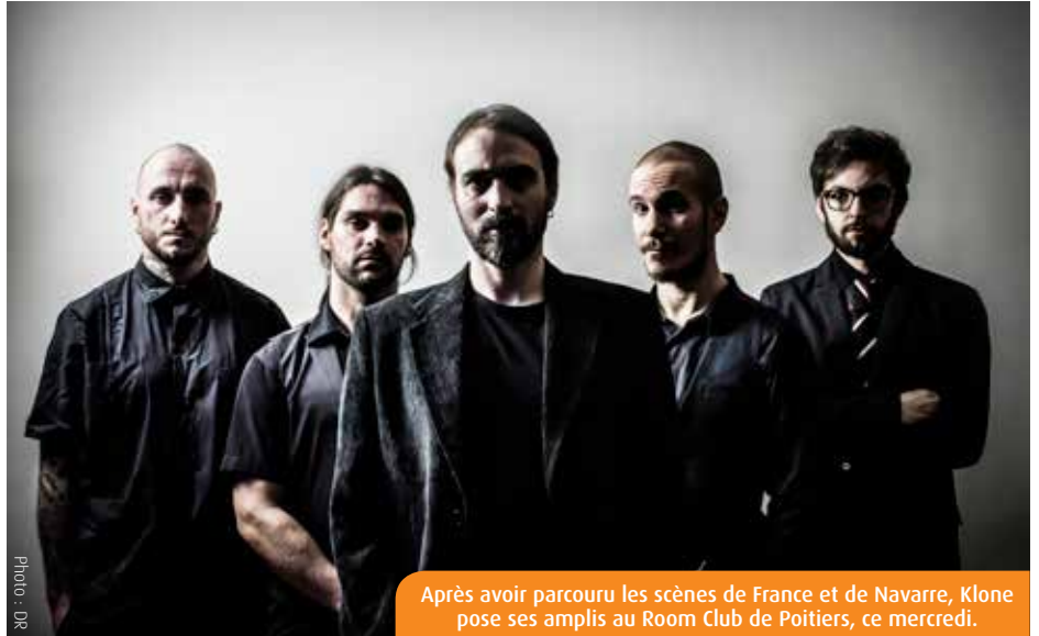
Après avoir parcouru les scènes de France et de Navarre, Klone pose ses amplis au Room Club de Poitiers, ce mercredi.

« En tournée, nous vivions dans un bus et enchaînions les dates. Pour nous remettre à composer, il fallait nous poser. Nous avons pris un an pour préparer ce sixième opus en studio. Depuis début 2015, nous sommes remontés sur scène à une trentaine