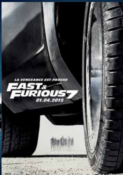
Film d'action de James Wan avec Vin Diesel, Paul Walker, Jason Statham, Michelle Rodriguez (2h17).