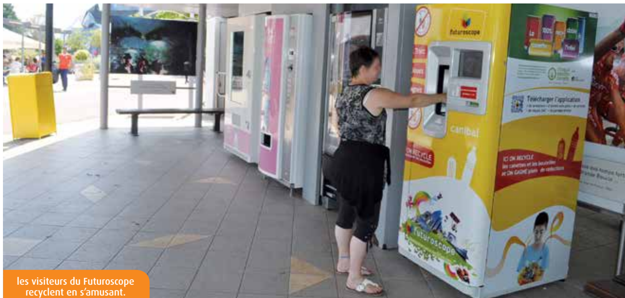
les visiteurs du Futuroscope recyclent en s'amusant.