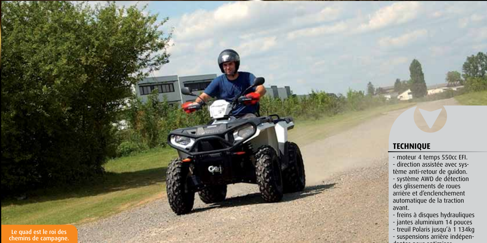
Le quad est le roi des chemins de campagne.

En forêt ou à la campagne, le quad est un véhicule aussi bien utilisé par les adeptes des balades en pleine nature que par les professionnels travaillant au grand air. Le couple de son moteur est si puissant qu'il permet de franchir toutes les difficultés.