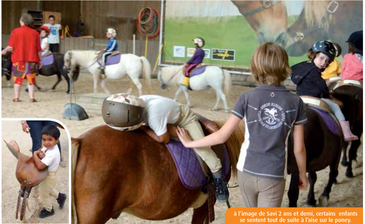
à l'image de Savi 2 ans et demi, certains enfants se sentent tout de suite à l'aise sur le poney.

• mardi 26 , de 10h30 à 13h30, mairie de Saint-Benoît ; de 15h30 à 18h30, mairie de Buxerolles.