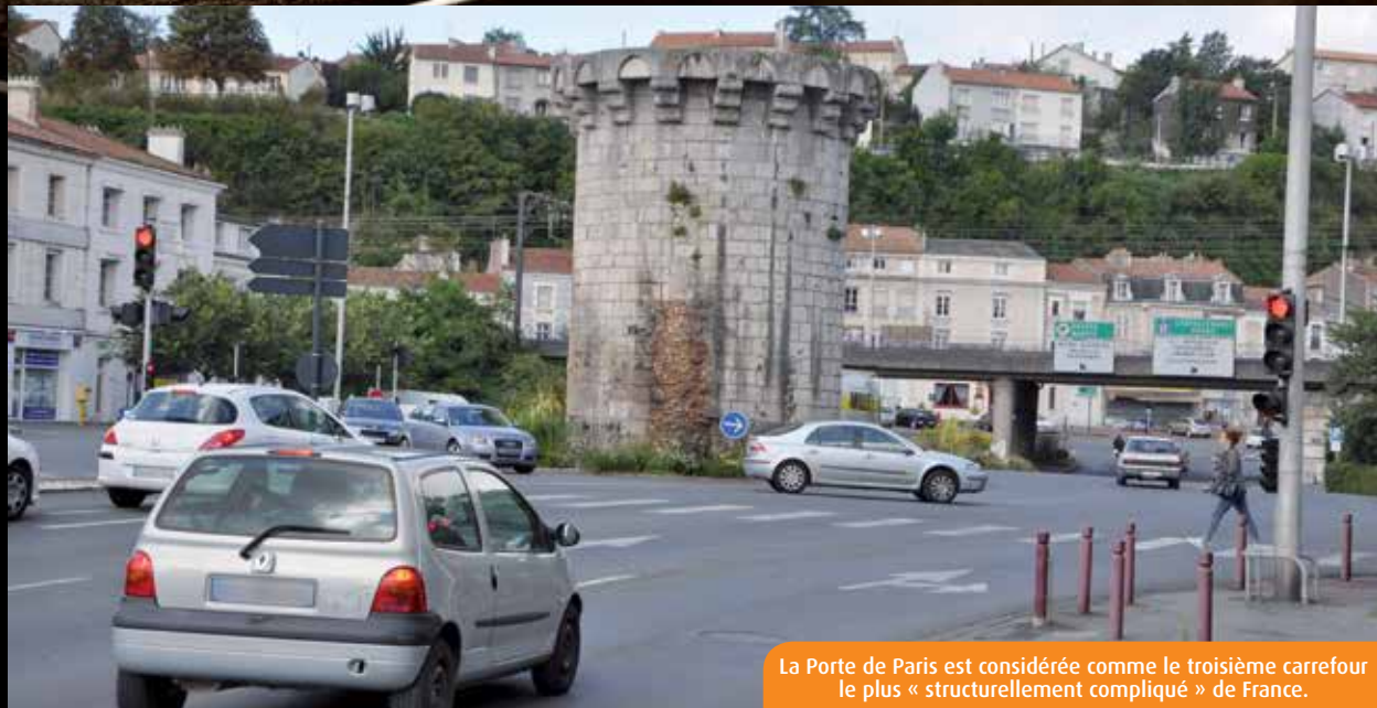
La Porte de Paris est considérée comme le troisième carrefour le plus « structurellement compliqué » de France.

Les services compétents de Grand Poitiers travaillent actuellement à l'intégration de données nouvelle génération, le flowing data. Ces données, transmises par un grand nombre d'appareils communicants et connectés, comme les smartphones ou certains GPS, peuvent être interprétées à des fins de calcul de temps de parcours. Une fois interfacées avec le Poste central de régulation de trafic, elles constitueront, à terme, une source supplémentaire d'informations sur les pratiques de chaque automobiliste et, de fait, un nouvel outil d'amélioration de la régulation du trafic.