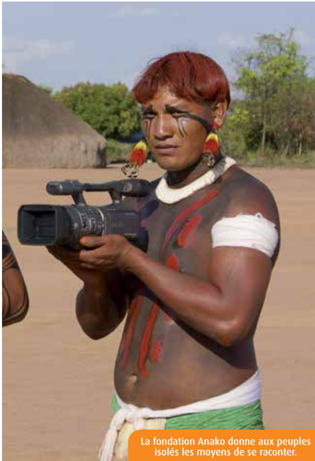
La fondation Anako donne aux peuples isolés les moyens de se raconter.