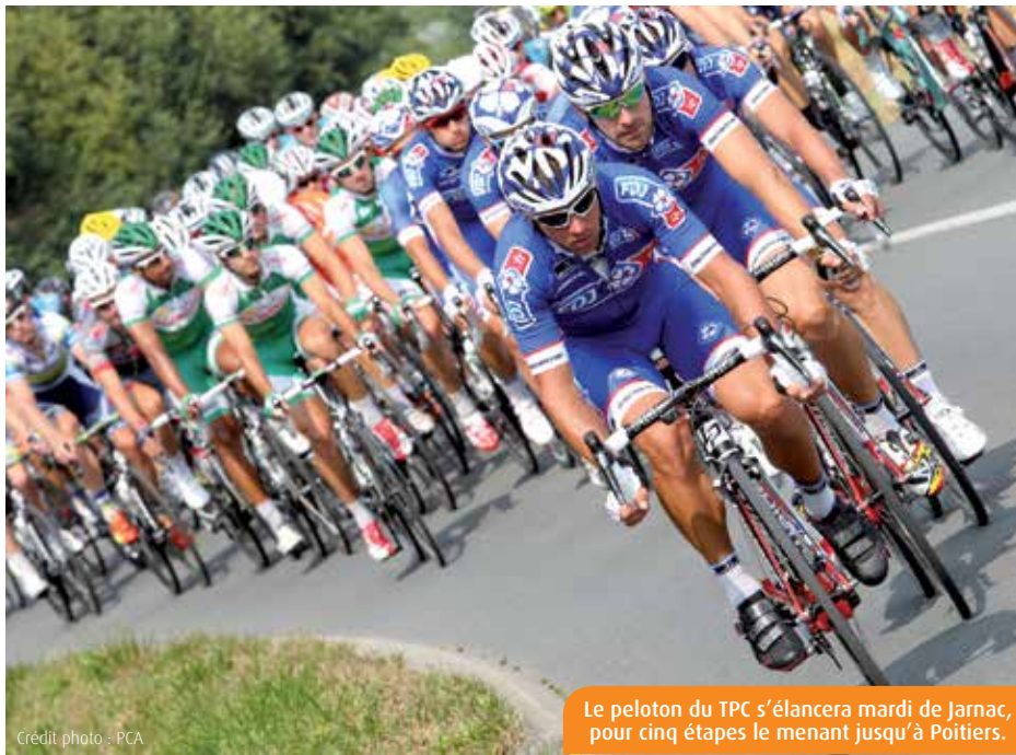
Le peloton du TPC s'élançera mardi de Jarnac, pour cinq étapes le menant jusqu'à Poitiers.

Avec Jean-Christophe Péraud, deuxième du dernier Tour de France, Sylvain Chavanel et Thomas Voeckler, doubles vainqueurs de l'épreuve, et Luke Durbridge, lauréat en 2012, la 28 e édition du Tour Poitou-Charentes s'annonce sous les meilleurs auspices. Départ mardi prochain de Jarnac.