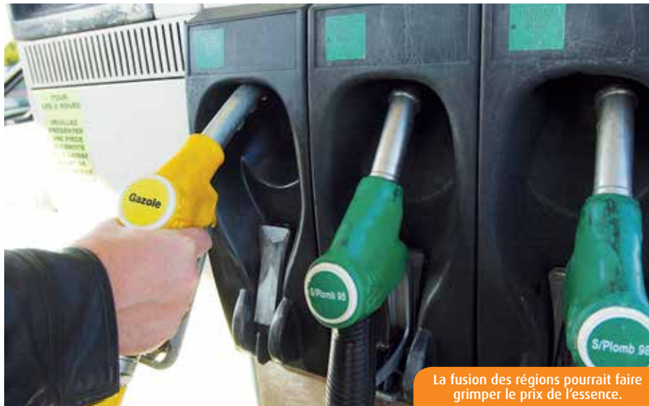
La fusion des régions pourrait faire grimper le prix de l'essence.

Début juillet, les députés ont adopté le rapprochement avec l'Aquitaine et le Limousin qui,