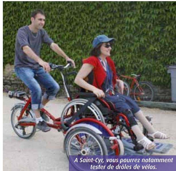
A Saint-Cyr, vous pourrez notamment tester de drôles de vélos.

La deuxième édition de «S'Handi Férence» investit le parc de Saint-Cyr, ce week- end. Au menu de ce rendez-vous pleine nature, une pluie d'animations sportives, ludiques et culturelles axées sur le handicap mais... accessibles à tous.