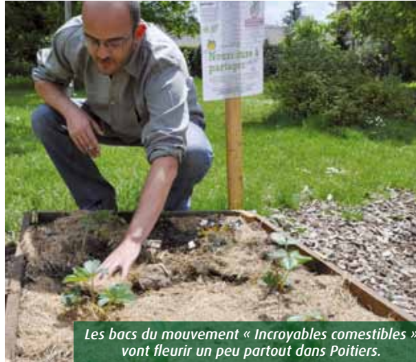
Les bacs du mouvement « Incroyables comestibles » vont fleurir un peu partout dans Poitiers.

Imaginez un monde où l'on pourrait pénétrer dans le potager du voisin pour lui piquer deux salades frisées et une grappe de tomates bien mûres. Impossible ? Pas pour les membres d'« Incroyables comestibles ». Venu d'Angleterre, ce mouvement solidaire prêche pour une alimentation locale et gratuite. « Se nourrir n'est pas un droit, mais une nécessité », argumente Cédric Sanglier, ambassadeur du mouvement à Poitiers. Pour le moment, seuls quelques bacs à