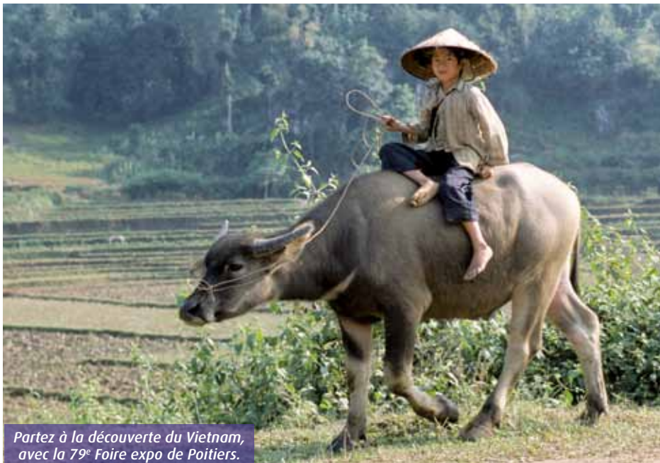
Partez à la découverte du Vietnam, avec la 79 e Foire expo de Poitiers.