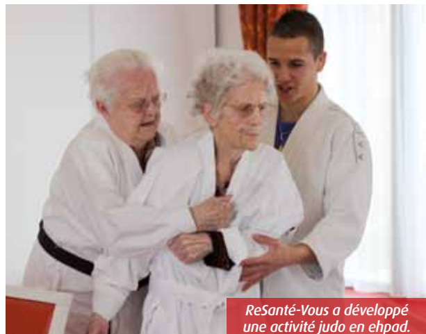
ReSanté-Vous a développé une activité judo en ehpad.

Créée en 2007 sous forme associative, l'entreprise poitevine ReSanté-Vous a rapidement déployé ses ailes, pour devenir un interlocuteur référent des ehpad et de leurs résidents.