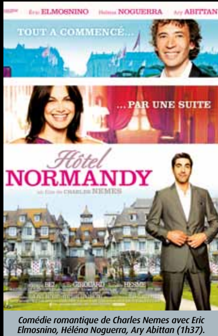
Comédie romantique de Charles Nemes avec Eric Elmosnino, Hélène Noguerra, Ary Abittan (1h37).