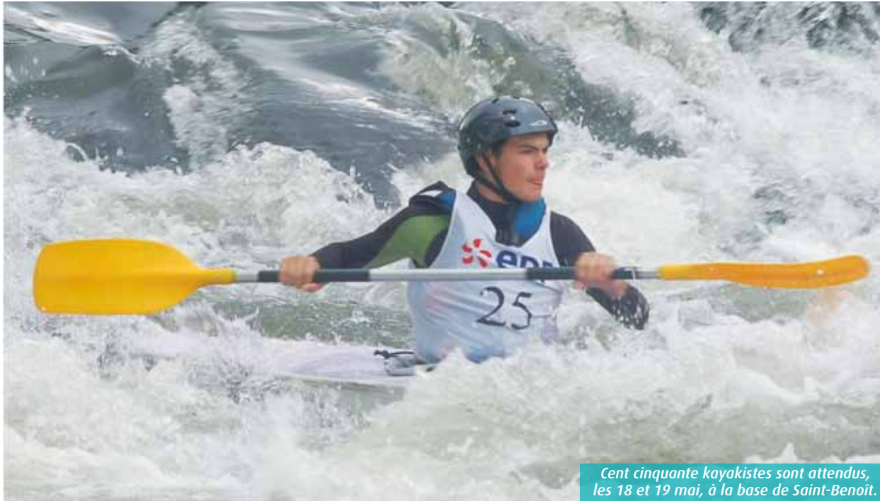
Cent cinquante kayakistes sont attendus, les 18 et 19 mai, à la base de Saint-Benoît.

La base de canoë-kayak de Saint-Benoît accueillera, les 18 et 19 mai, les championnats de France sport adapté de kayak. Cent cinquante compétiteurs sont attendus.