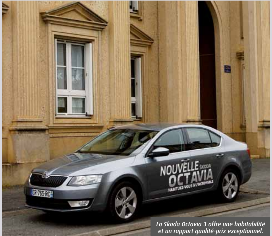
La Skoda Octavia 3 offre une habitabilité et un rapport qualité-prix exceptionnel.

Son point fort est l'habitabilité. En prenant quelques centimètres par rapport à la précédente version, l'Octavia 3 dégage de la place pour les genoux des passagers assis à l'arrière. Le coffre affiche un volume record de 590 litres, malgré la roue de secours. De quoi lui attirer la sympathie des chauffeurs de taxi, qui pourraient bien la choisir pour exercer leur activité professionnelle.