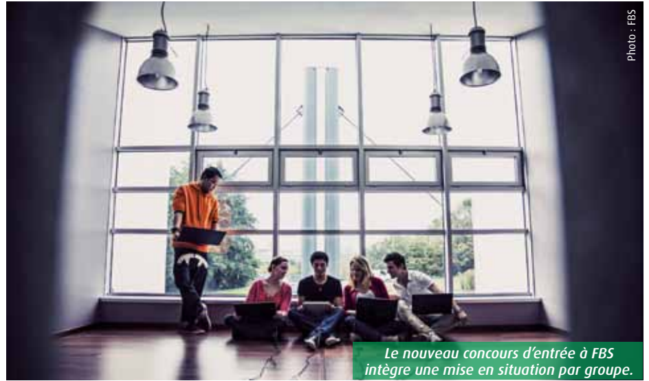
Le nouveau concours d'entrée à FBS intègre une mise en situation par groupe.

Ne parlez plus de concours d'entrée, mais de « Talent