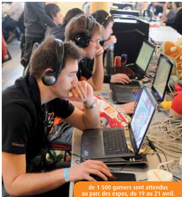
de 1 500 gamers sont attendus au parc des expos, du 19 au 21 avril.

Nouveau lieu, affluence record, tournage d'un film... La 15 e édition de la Gamers Assembly, qui se déroule du 19 au 21 avril au parc des expos de Poitiers, promet déjà d'entrer dans l'Histoire.