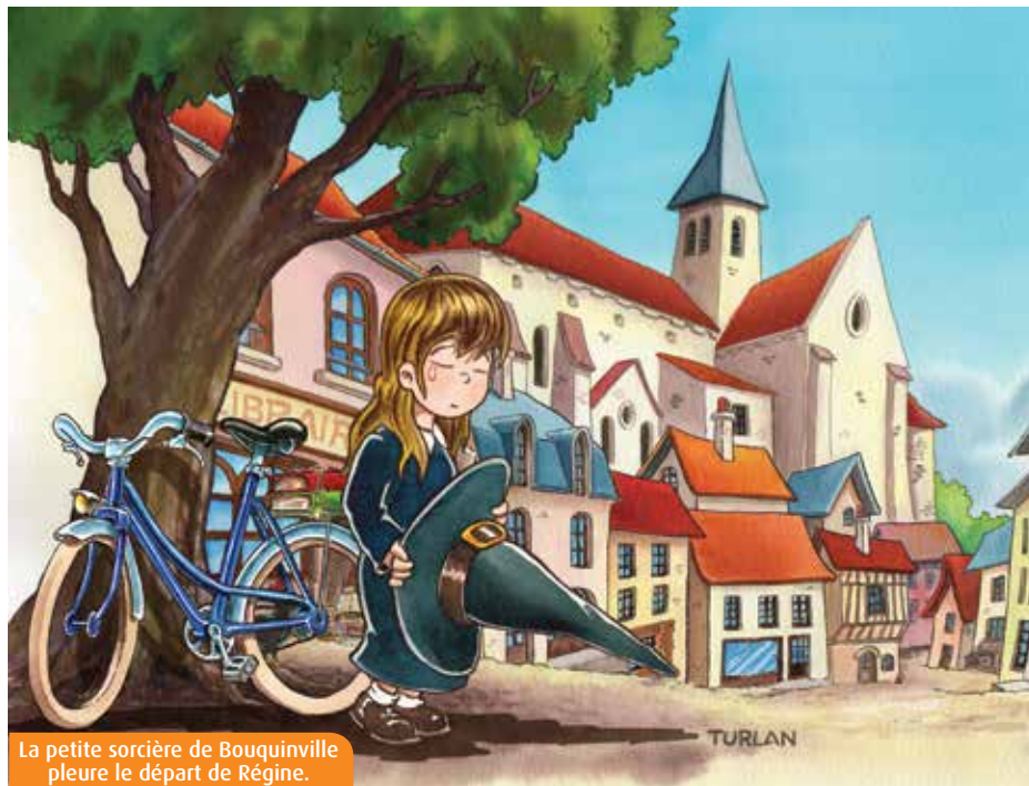
La petite sorcière de Bouquinville pleure le départ de Régine.

Turlan ne le savait pas encore, mais il aurait tôt fait d'appréhender à mieux connaître