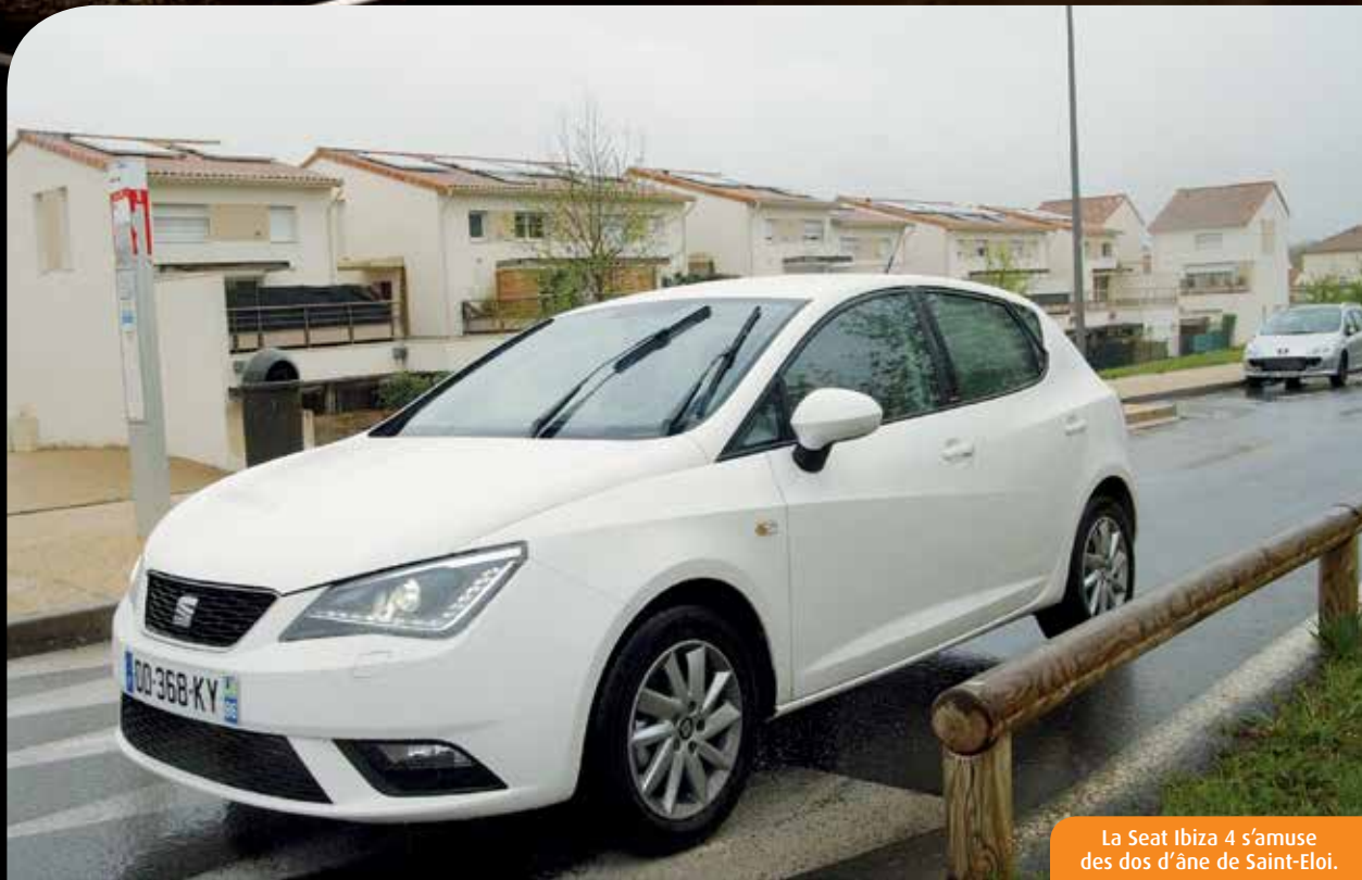
La Seat Ibiza 4 s'amuse des dos d'âne de Saint-Eloi.

Concession Seat, Excel Auto, 230, route de Paris (sortie nord près de l'estacade de la Folie), à Poitiers. 05 49 11 98 10 - www.seat.fr