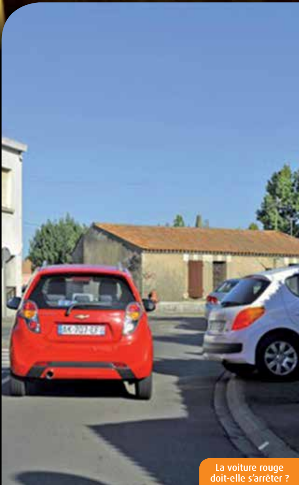
La voiture rouge doit-elle s'arrêter ?