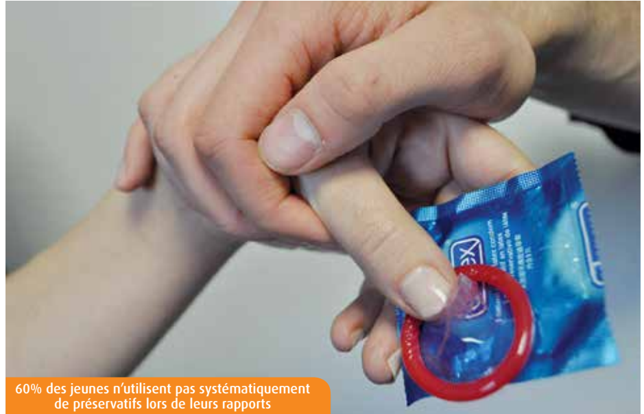
60% des jeunes n'utilisent pas systématiquement de préservatifs lors de leurs rapports

D'après le dernier baromètre santé Poitou-Charentes réalisé par l'ORS, 91,6% des 15-29 ans se sont protégés lors de leur première relation sexuelle. « Il est important de ne pas stigmatiser cette population. Les jeunes ne sont pas irréfléchis. Bien souvent, ils sont conscients des dangers, ce qui n'est pas le cas des plus de 50 ans qui n'ont jamais utilisé de protection et n'ont pas grandi avec la peur du Sida », explique Marie Pluzanski, responsable du service de médecine préventive de l'université