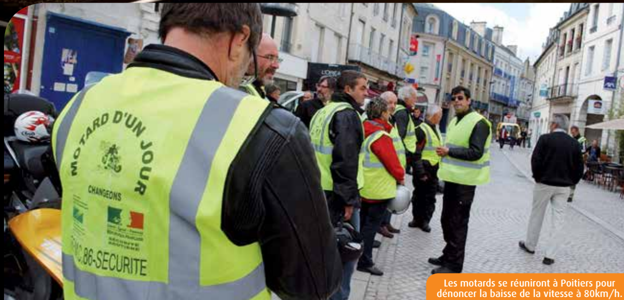
Les motards se réuniront à Poitiers pour dénoncer la baisse de la vitesse à 80km/h.

La nomination de Manuel Valls au poste de Premier ministre n'y changera rien. Ministre de l'Intérieur, il s'était dit favorable à un abaissement de la vitesse légale. Maintenant qu'il est chef du gouvernement, l'association des Motards en colère maintient son appel à la mobilisation nationale pour dénoncer cette « solution de facilité ». Tout est parti d'une préconisation du Conseil national de sécurité routière (CNSR), prévoyant d'abaisser la vitesse sur le réseau secondaire à 80km/h (au lieu de 90km/h), dans l'objectif de réduire le nombre de décès sur la route. David Pais, le représentant local