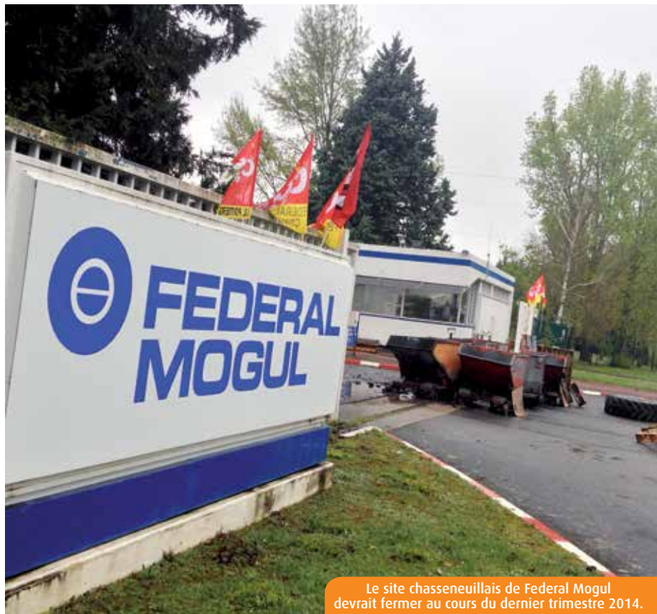
Le site chasseneuillais de Federal Mogul devrait fermer au cours du dernier trimestre 2014.

Dans ces conditions -« un marché qui se durcit, des volumes et des prix en baisse »-, la messe semble dite, même si les représentants du personnel ne veulent pas s'y résoudre. « C'est une catastrophe pour beaucoup de familles, une catastrophe pour le territoire. Les difficultés n'étaient pas une surprise, mais