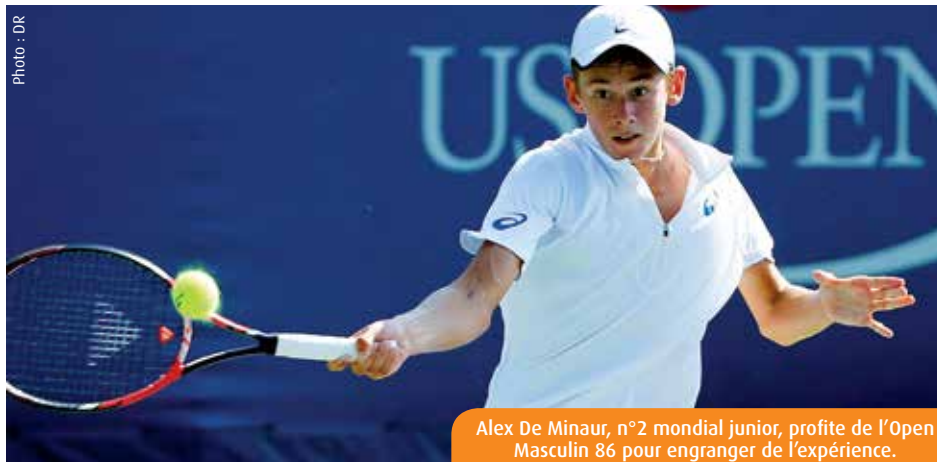
Alex De Minaur, n°2 mondial junior, profite de l'Open Masculin 86 pour engranger de l'expérience.