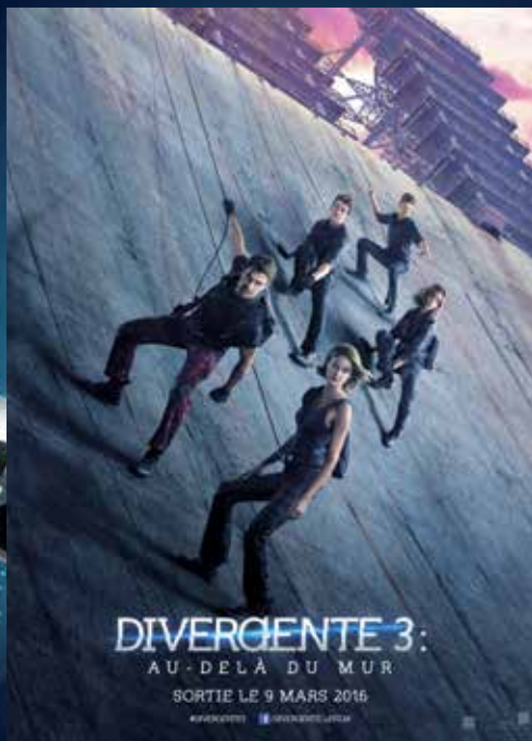
Film de science fiction de Robert Schwentke avec Shailene Woodley, Theo James, Jeff Daniels (2h01).