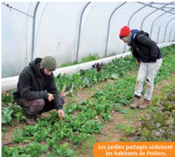
Les jardins partagés séduisent les habitants de Poitiers.