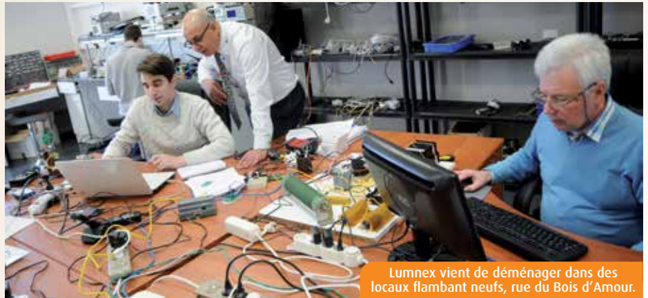
Lumnex vient de déménager dans des locaux flambant neufs, rue du Bois d'Amour.

Il y a quelques mois, la SAS au capital record -1,345M€- a car-