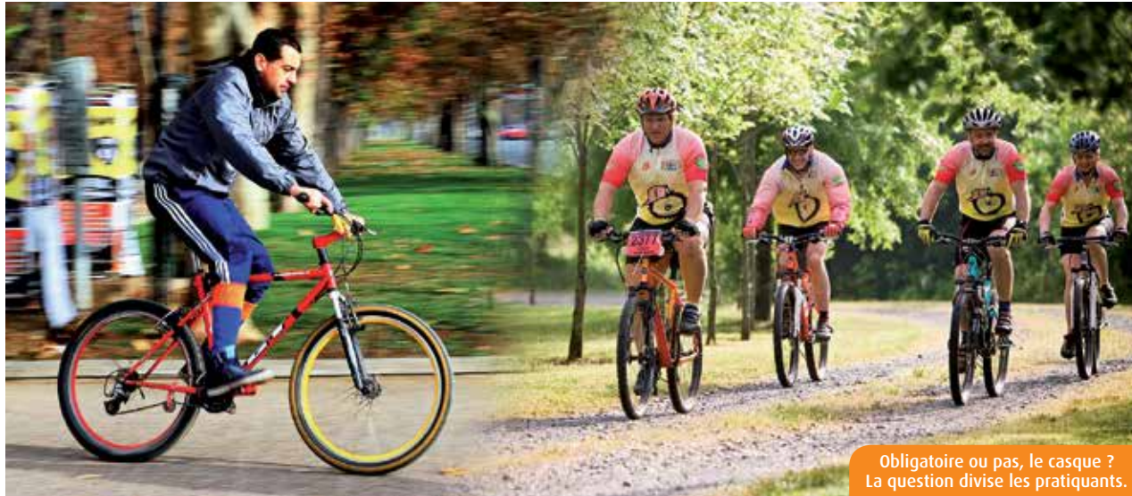
Obligatoire ou pas, le casque ? La question divise les pratiquants.