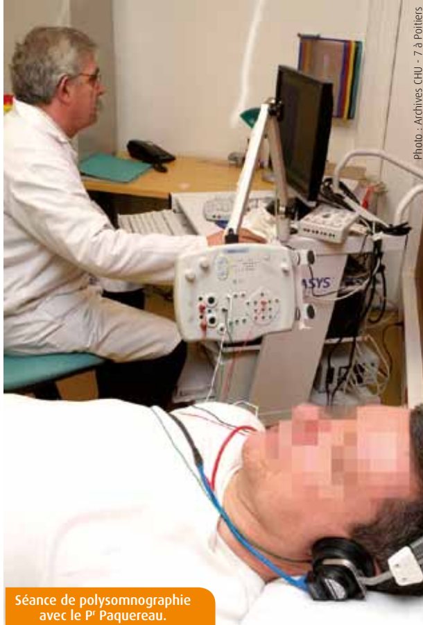
Séance de polysomnographie avec le Pr Paquereau.

de la constatation par le conjoint de ces « coupures de son ») est la fatigue au réveil. Elle est la preuve que le sommeil n'est pas réparateur. Cela entraîne généralement des états de déprime, en tout cas de perte d'intérêt pour les choses de la vie courante, des maux de tête matinaux, des somnolences en cours de journée, des « décrochages » d'attention, voire des troubles de la mémoire. Autre comportement anormal : le fait de se lever deux ou trois fois par nuit pour aller faire pipi.