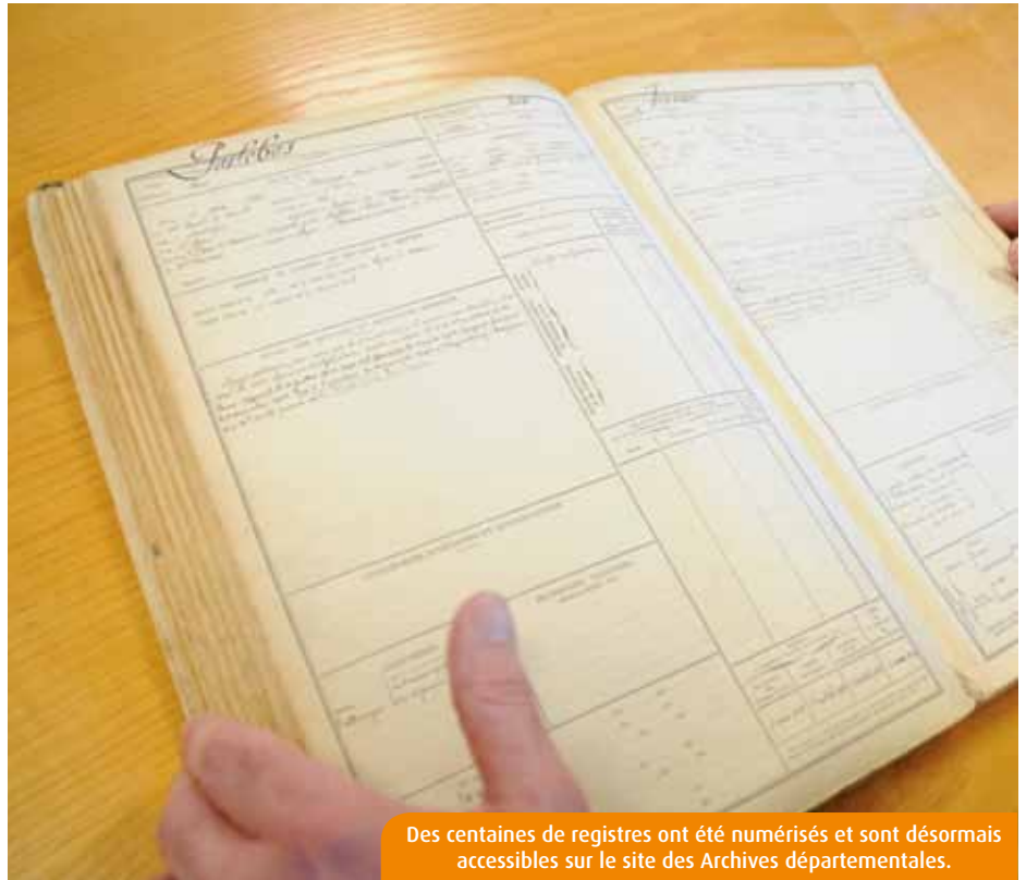
Des centaines de registres ont été numérisés et sont désormais accessibles sur le site des Archives départementales.