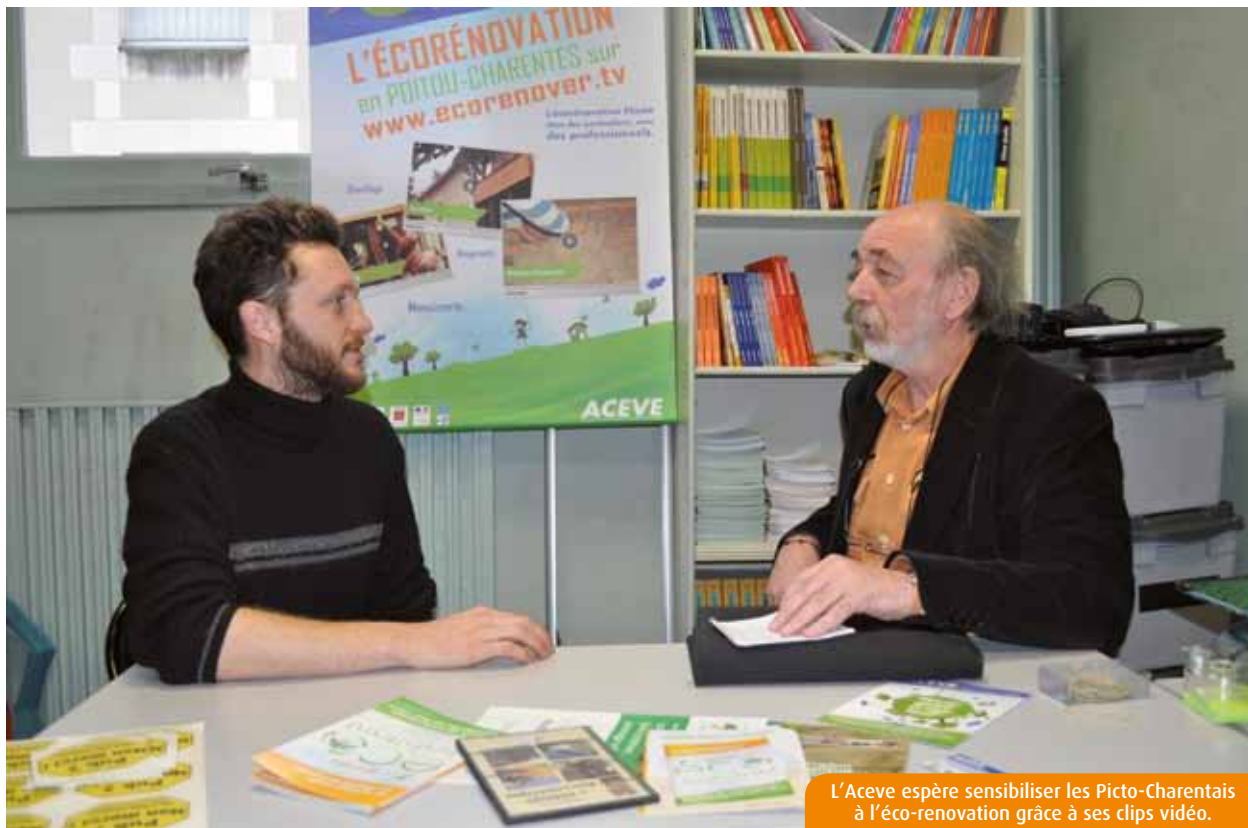
L'Aceve espère sensibiliser les Picto-Charentais à l'éco-renovation grâce à ses clips vidéo.

La biocoop «Le Pois tout vert» vient d'instaurer, dans ses magasins de Poitiers Saint-Éloi, Poitiers Demi-Lune, Poitiers Sud et Chatellerault, un programme de fidélisation, qui s'accompagne d'un acte de solidarité. Présentée en caisse, la carte permet au bénéficiaire de cumuler des points (1 point = 1€ d'achat). A chaque bon d'achat émis, la biocoop verse 10% de sa valeur dans un fonds visant à soutenir les projets de ses partenaires (Groupement d'Agriculteur Bio, Terre de Liens, Enercoop...) ou à accompagner les producteurs en difficulté. Renseignements : www.lepoistoutvert.com