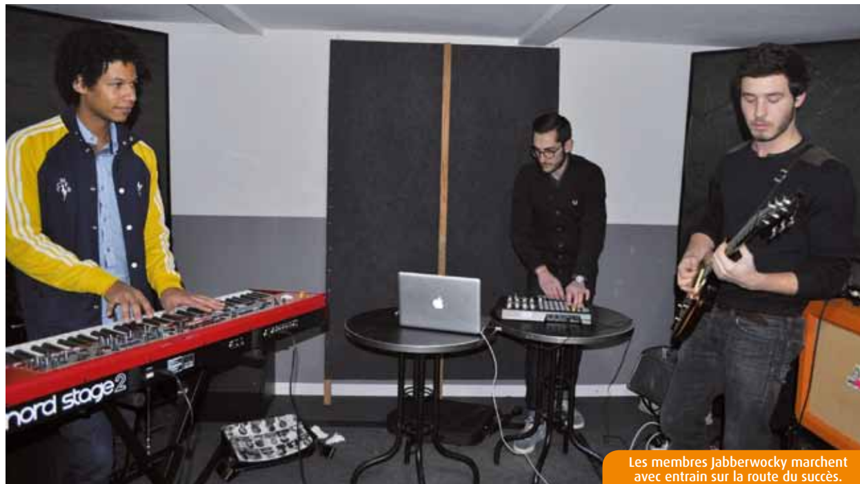
Les membres Jabberwocky marchent avec entrain sur la route du succès.