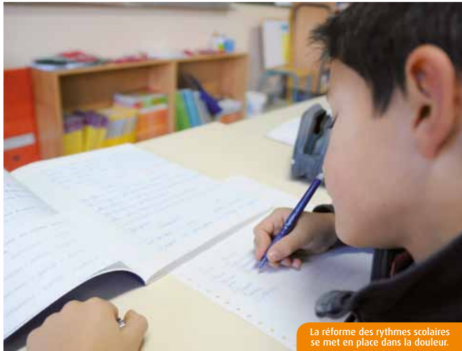
La réforme des rythmes scolaires se met en place dans la douleur.

La belle unanimité de l'été 2012 a depuis longtemps volé en éclats. Des syndicats enseignants aux parents, de la classe politique aux chronobiologistes, le passage de quatre jours à quatre jours et demi a fait consensus. Ce temps-là est révolu, y compris dans la Vienne, où la réforme des rythmes scolaires ne constitue pourtant pas un obstacle majeur, dans la mesure où 44% des établissements du département -notamment à Poitiers- fonctionnaient déjà sur ce tempo. La Fédération des conseils de parents d'élèves déplore la situation, « réaffirme son soutien à la réforme » et appelle « au dialogue sans position dogmatique ». Ils étaient encore cent cinquante enseignants à battre le pavé de la contestation, jeudi dernier à Poitiers, pour dénoncer « la précipitation » de la mesure Peillon et « le bricolage de sa mise en œuvre » (Snuipp). Comme 22% des communes du département, Buxerolles s'est conformée aux 4,5 jours dès la rentrée dernière. La pause méridienne a été allongée et des animations périscolaires ont vu le jour, les mardi et jeudi, de 15h30 à 16h30. « On