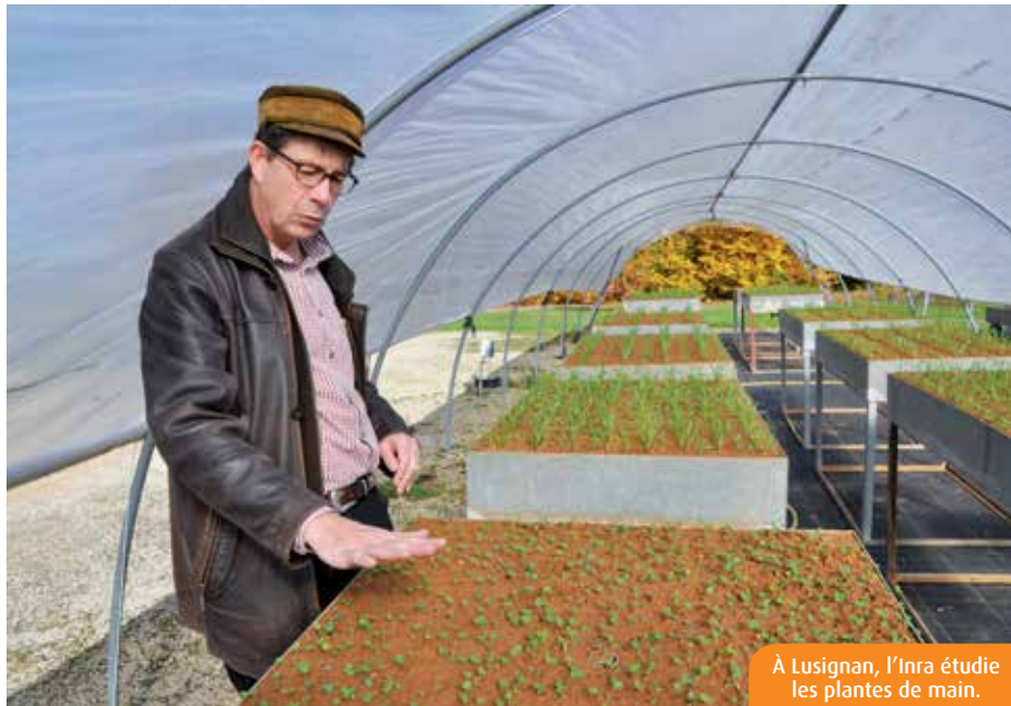
À Lusignan, l'Inra étudie les plantes de main.

Parmi les solutions envisagées pour contrer ce phénomène, l'Inra planche actuellement sur le comportement de plantes à la résistance éprouvée, s'effor-