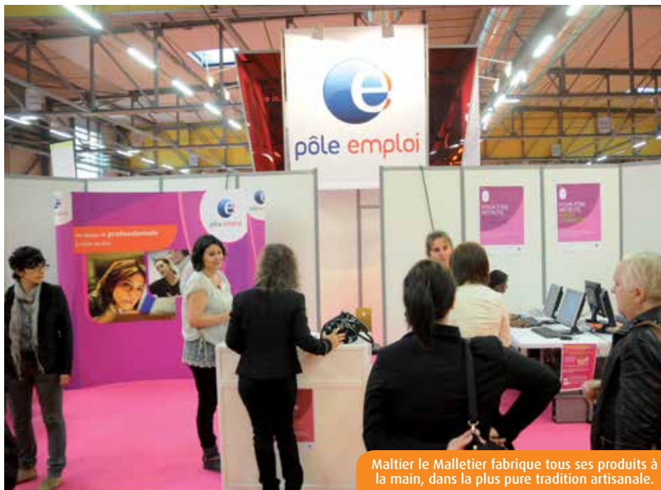
Maltier le Malletier fabrique tous ses produits à la main, dans la plus pure tradition artisanale.

Comme d'habitude, pour parfaire vos choix, des conférences seront données tout au long de la journée. Au menu : « Comment bien se présenter lors d'un entretien d'embauche », « Comment postuler dans le secteur des services à