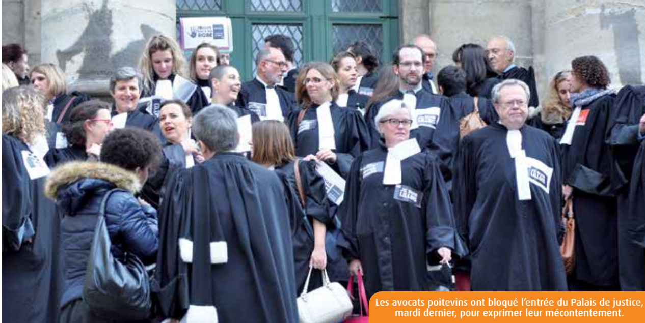
Les avocats poitevins ont bloqué l'entrée du Palais de justice, mardi dernier, pour exprimer leur mécontentement.

Une centaine d'avocats du barreau de Poitiers sont descendus dans la rue, mardi dernier, pour protester contre le projet de financement de l'aide juridictionnelle de la ministre de la Justice. Que revendiquent-ils ? Qui sont-ils ? Décryptage.