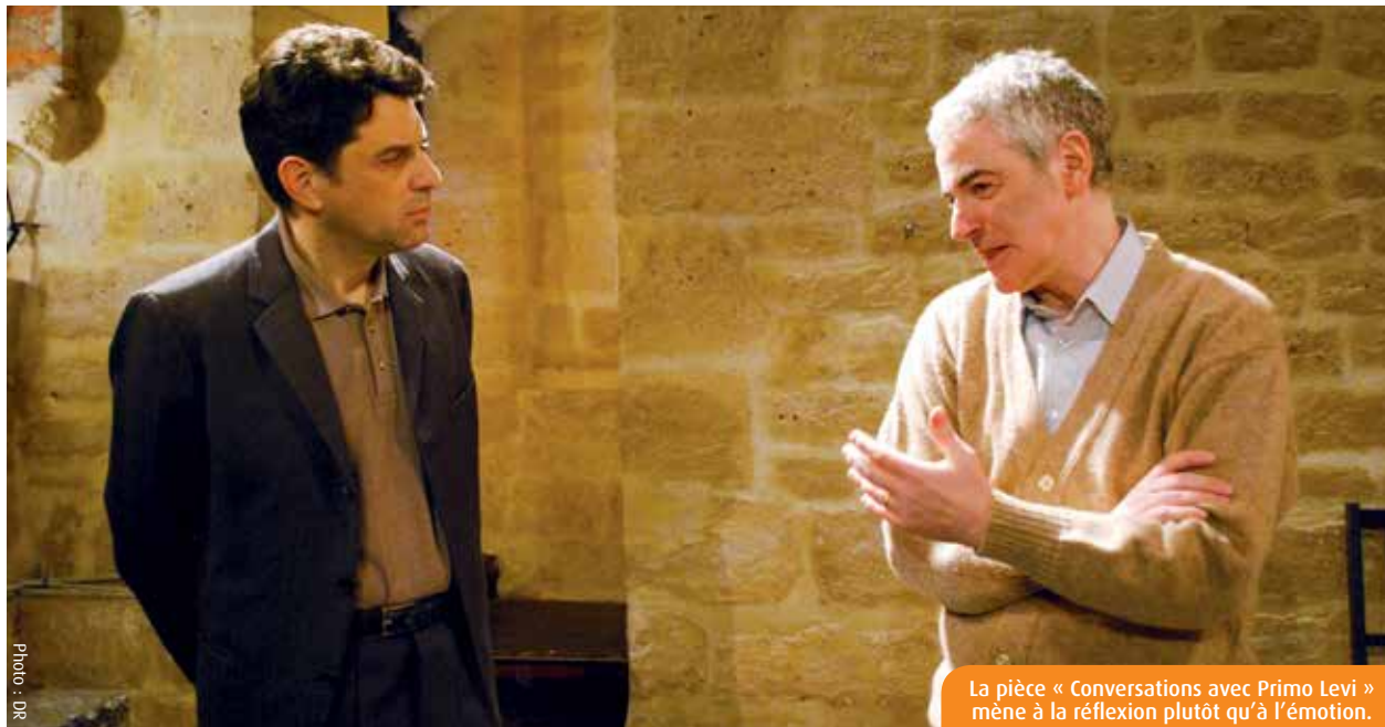
La pièce « Conversations avec Primo Levi » mène à la réflexion plutôt qu'à l'émotion.

Le Tap accueille, le mardi 10 novembre, une représentation de « Conversations avec Primo Levi ». Cette pièce est la première proposée par l'association des « Amis du Théâtre Populaire ». Elle met en scène les différentes rencontres entre Primo Levi et le romancier italien Ferdinando Camon.