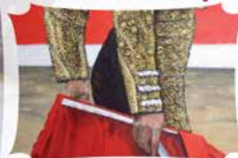
de Sylvie Muzzolini Peintre de la couleur

Maison Mitteault - Domaine de Rouilly 86190 Chalandray Tél. 05 49 60 14 09 - Fax : 05 49 60 70 30 bh@maisonmitteault.com - www.maisonmitteault.com