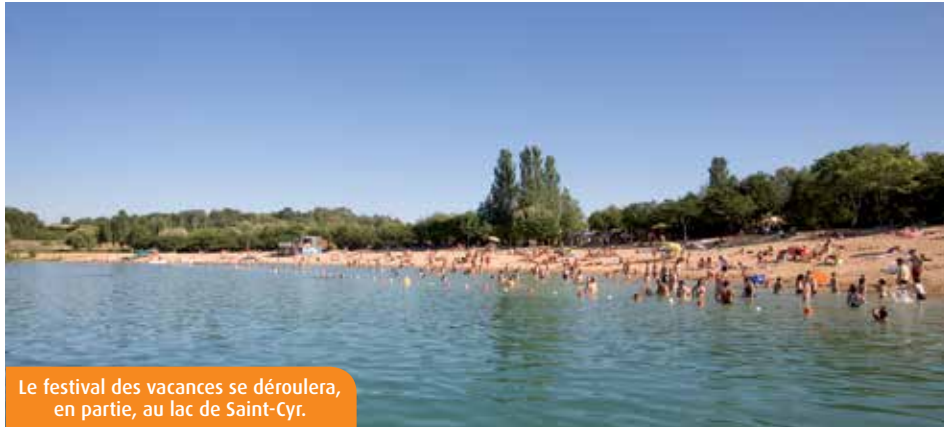
Le festival des vacances se déroulera, en partie, au lac de Saint-Cyr.

Dans la Vienne, cet anniversaire sera célébré en grande pompe... L'association poitevine « Ekitour » (quatre salariés) planche ainsi sur la création d'un Festival des vacances ! Une manifestation unique en France, qui se tiendra les 23, 24 et 25 juin 2016. Il y a quatre ans déjà, au Futuroscope, le Festival du film des vacances avait eu le mérite de mettre en lumière ces petits bonheurs éprouvés à chaque trêve estivale. Cette fois, il ne s'agira pas seulement de