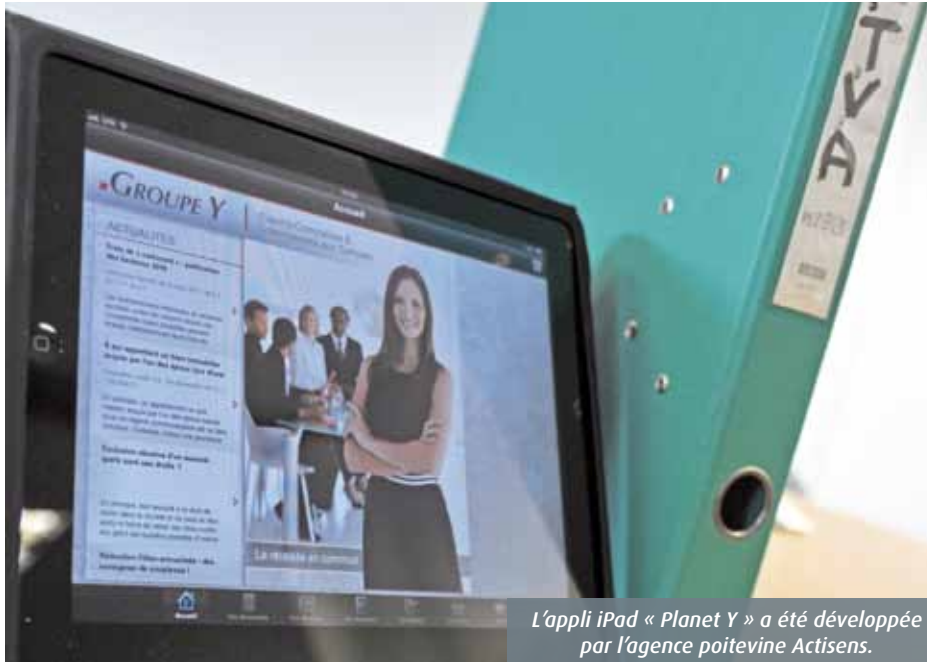
L'appli iPad « Planet Y » a été développée par l'agence poitevine Actisens.

Le saviez-vous ? Depuis sa mise sur le marché en 2010, l'ipad s'est vendu à plus de 600 000 exemplaires dans l'Hexagone et à 15 millions dans le monde ! Alors que la « v2 » est sortie vendredi dernier, la tablette de la marque américaine séduit toujours autant les professionnels, avides de nouveaux usages. Dernier exemple en date : le Groupe Y, cabinet d'expertise comptable présent au Futuroscope, à Niort, Nantes, Paris, Luçon et La Roche-sur-Yon.