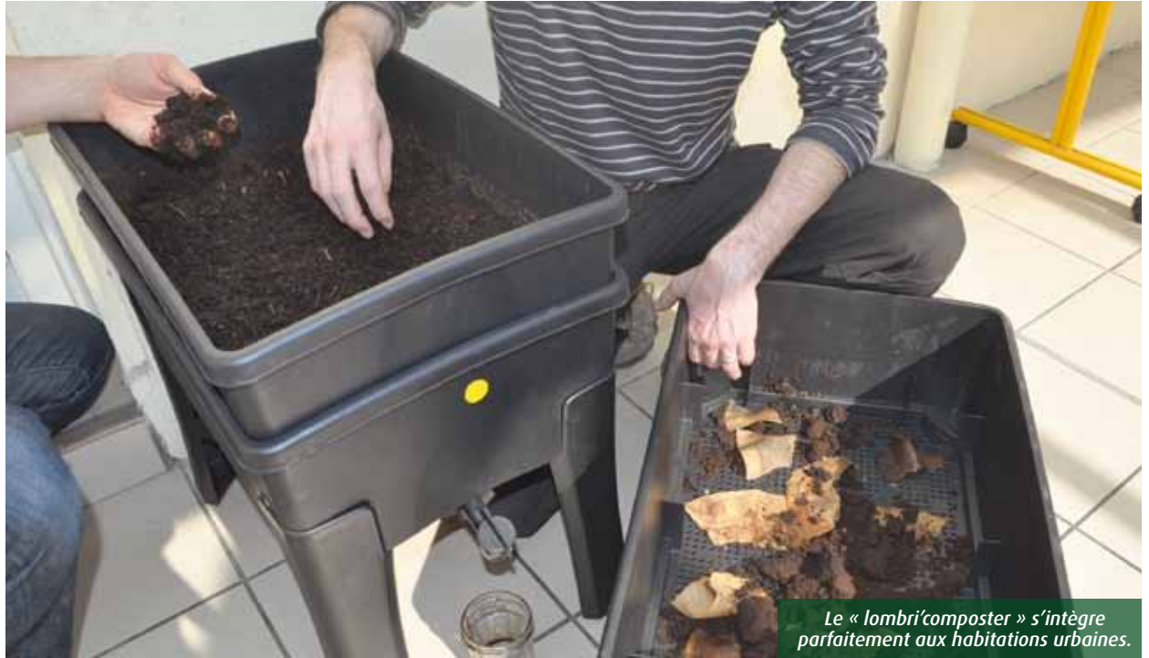
Le « lombri'composter » s'intègre parfaitement aux habitations urbaines.