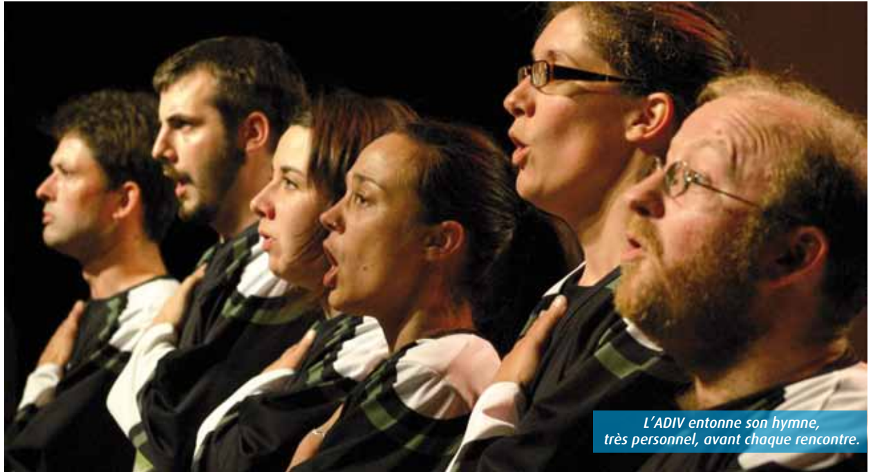
L'ADIV entonne son hymne, très personnel, avant chaque rencontre.