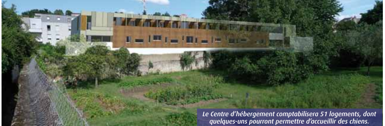
Le Centre d'hébergement comptabilisera 51 logements, dont quelques-uns pourront permettre d'accueillir des chiens.

La construction du centre d'hébergement et de réinsertion sociale «Le Carrefour», rue des Herbeaux à Poitiers, ne laisse pas les riverains indifférents. La réunion publique organisée sur le projet, le 17 mars, a mis en lumière les craintes d'une poignée d'entre eux.