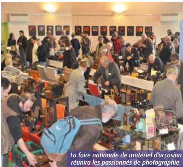
La foire nationale de matériel d'occasion réunira les passionnés de photographie.

« La première année, nous comptons deux tables pour autant d'exposants. » En vingt-cinq éditions, la foire nationale du matériel photographique d'occasion de Montamisé a pris le temps de grandir. Au fil des éditions, les habitués ont eu l'opportunité de voir les stands proliférer.