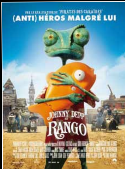
Film d'animation de Gore Verbinski (1h40). À l'affiche au MEGA CGR Buxerolles et au CGR Castille.

Pure merveille de cinéma d'animation, « Rango » saura aussi bien réjouir les adultes que les enfants.