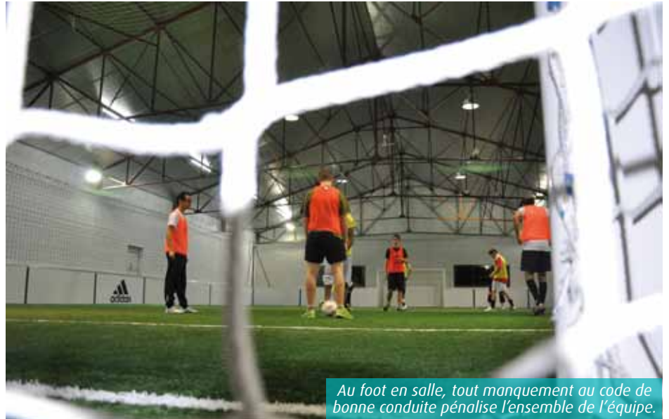
Au foot en salle, tout manquement au code de bonne conduite pénalise l'ensemble de l'équipe.

Depuis la rentrée, le championnat inter-entreprises, que « Foot & Balls » avait monté de toutes pièces l'année passée, accueille douze formations, pour une compétition de quatre mois, renouvelable de janvier à