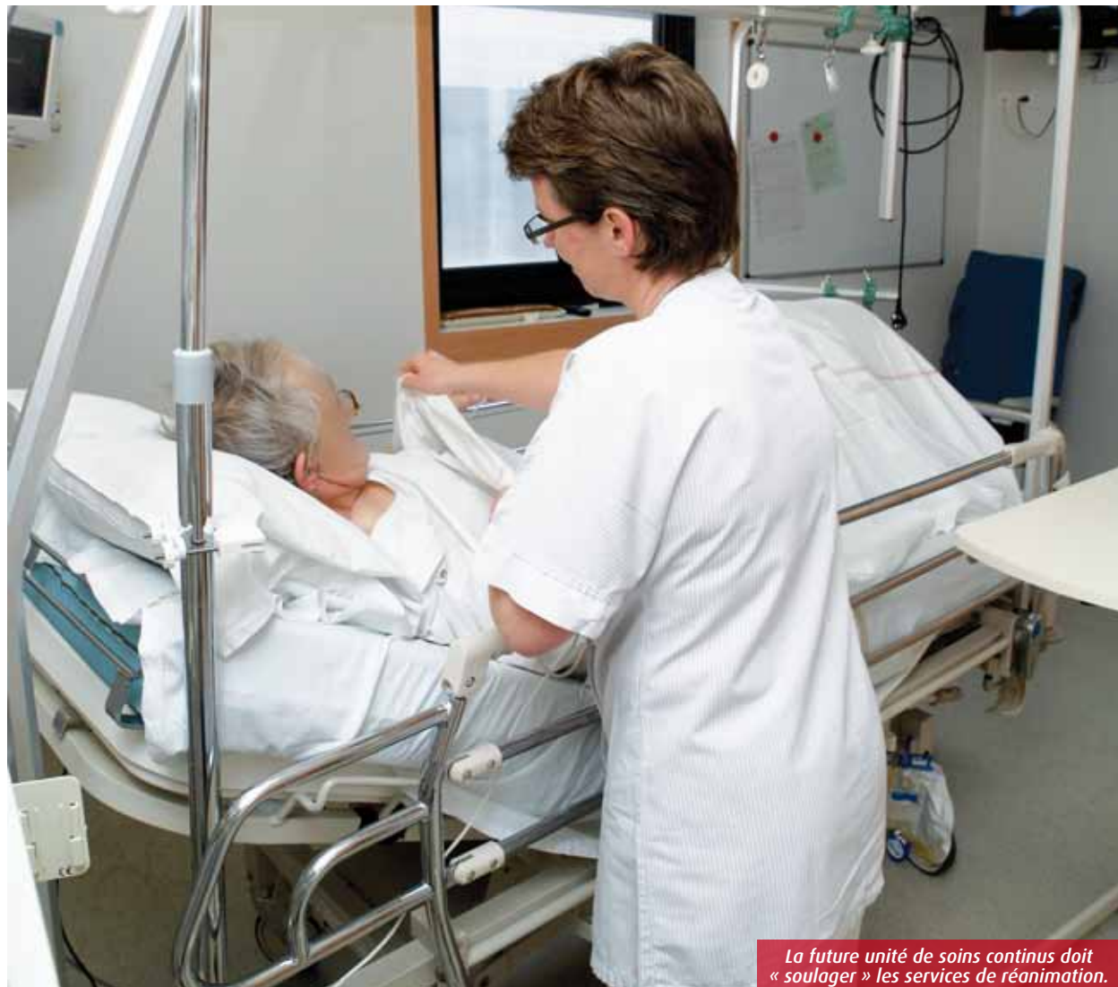
La future unité de soins continus doit « soulager » les services de réanimation.

Pour «désengorger» ses salles de réanimation, le CHU a entrepris de se doter d'une nouvelle unité de soins continus. Ouverture prévue d'ici un an.