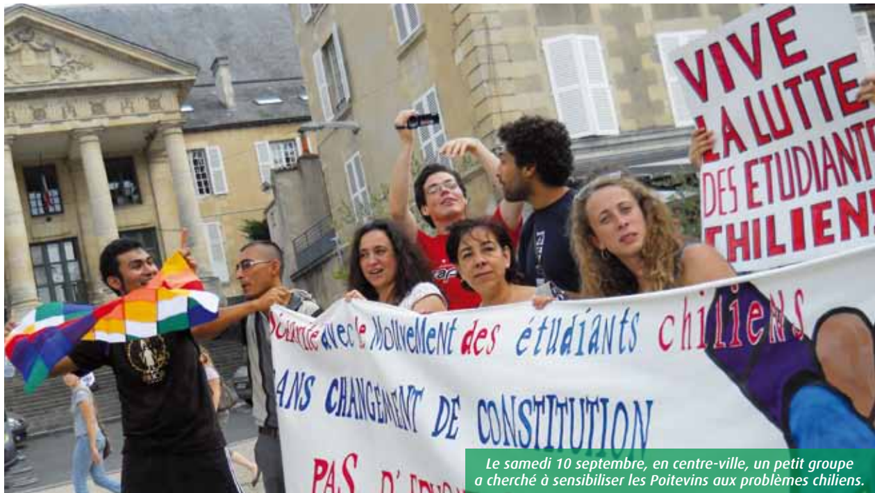
Le samedi 10 septembre, en centre-ville, un petit groupe a cherché à sensibiliser les Poitevins aux problèmes chiliens.