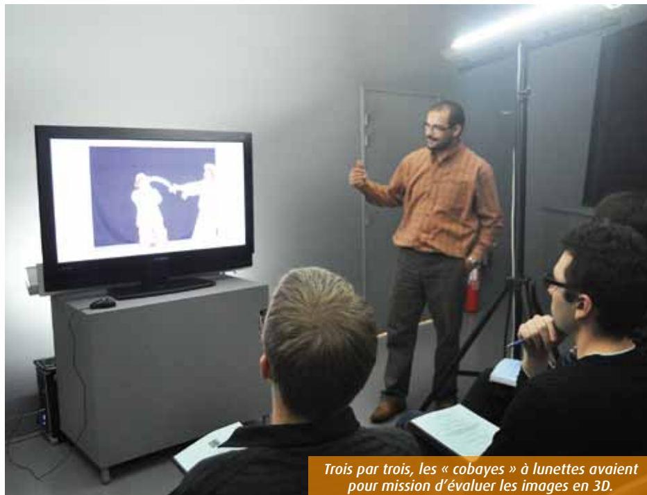
Trois par trois, les « cobayes » à lunettes avaient pour mission d'évaluer les images en 3D.

Le temps de remplir une fiche d'identification et je me