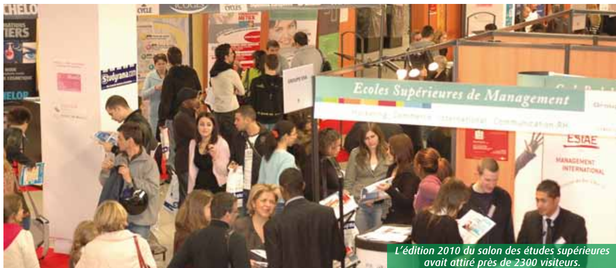
L'édition 2010 du salon des études supérieures avait attiré près de 2300 visiteurs.

Le saviez-vous ? En 2011, près de 13 000 bacheliers de l'académie ont rejoint le monde de l'enseignement supérieur. Ils devraient être à peu près autant l'année prochaine. Et comme avant chaque « migration », les salons destinés à les aiguiller sur la voie royale fleurissent. Premier rendez-vous à ne pas manquer, le salon Studyrama des études supérieures. Le samedi 26 novembre, quelque quarante établissements, représentant environ deux cents formations, enva-