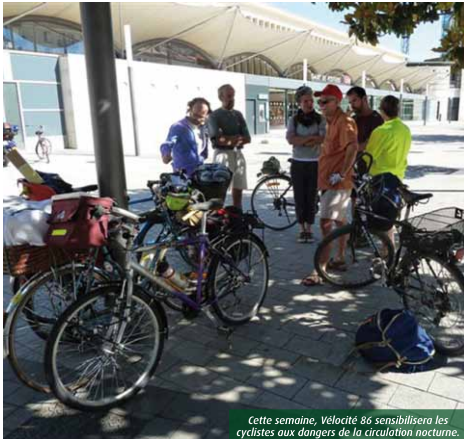
Cette semaine, Vélocité 86 sensibilisera les cyclistes aux dangers de la circulation nocturne.

Les défenseurs de l'usage de la bicyclette au quotidien bénéficient pourtant d'un re-