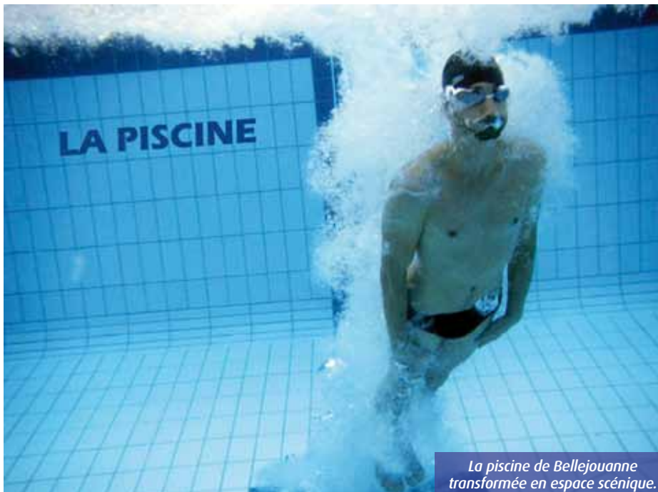
La piscine de Bellejouanne transformée en espace scénique.

■ Antoine Decourt adecourt@7apoitiers.fr