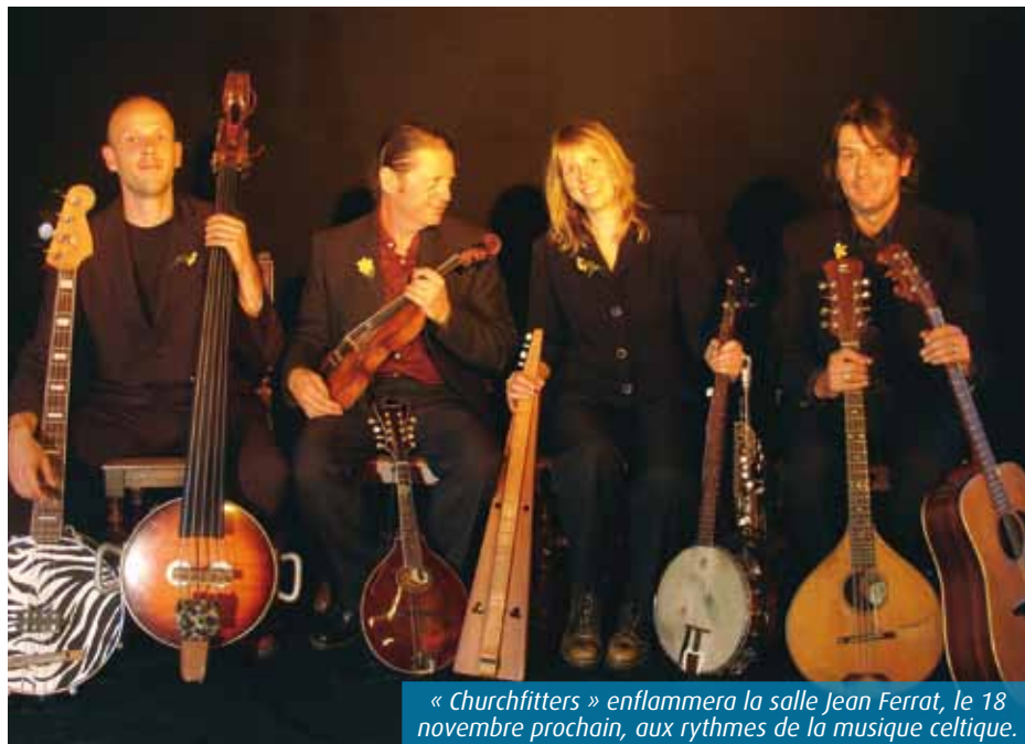
« Churchfitters » enflammera la salle Jean Ferrat, le 18 novembre prochain, aux rythmes de la musique celtique.

Installé en Bretagne depuis quelques années, « Church- fitters » puise son inspiration