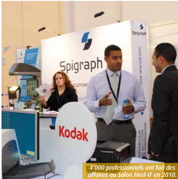
4 000 professionnels ont fait des affaires au Salon Med-IT en 2010.

Sept adhérents du Réseau des professionnels du numérique (SPN) iront à Casablanca (Maroc), la semaine prochaine, pour dénicher les futurs distributeurs de leurs produits high-tech.