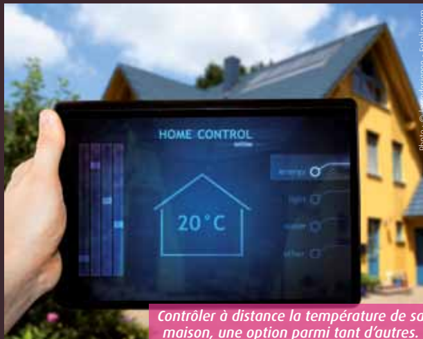
Contrôler à distance la température de sa maison, une option parmi tant d'autres.

Appareils ménagers et matériels vidéo ont eux-mêmes goûté aux joies de la démocratisation. Ce qui était hors de prix aux origines est devenu beaucoup plus accessible avec le temps. On peut donc imaginer que l'intégration progressive des équipements de domotique dans les maisons françaises épousera bientôt la même courbe déflationniste. En l'état, l'« empire » domotique pianote allègrement sur la