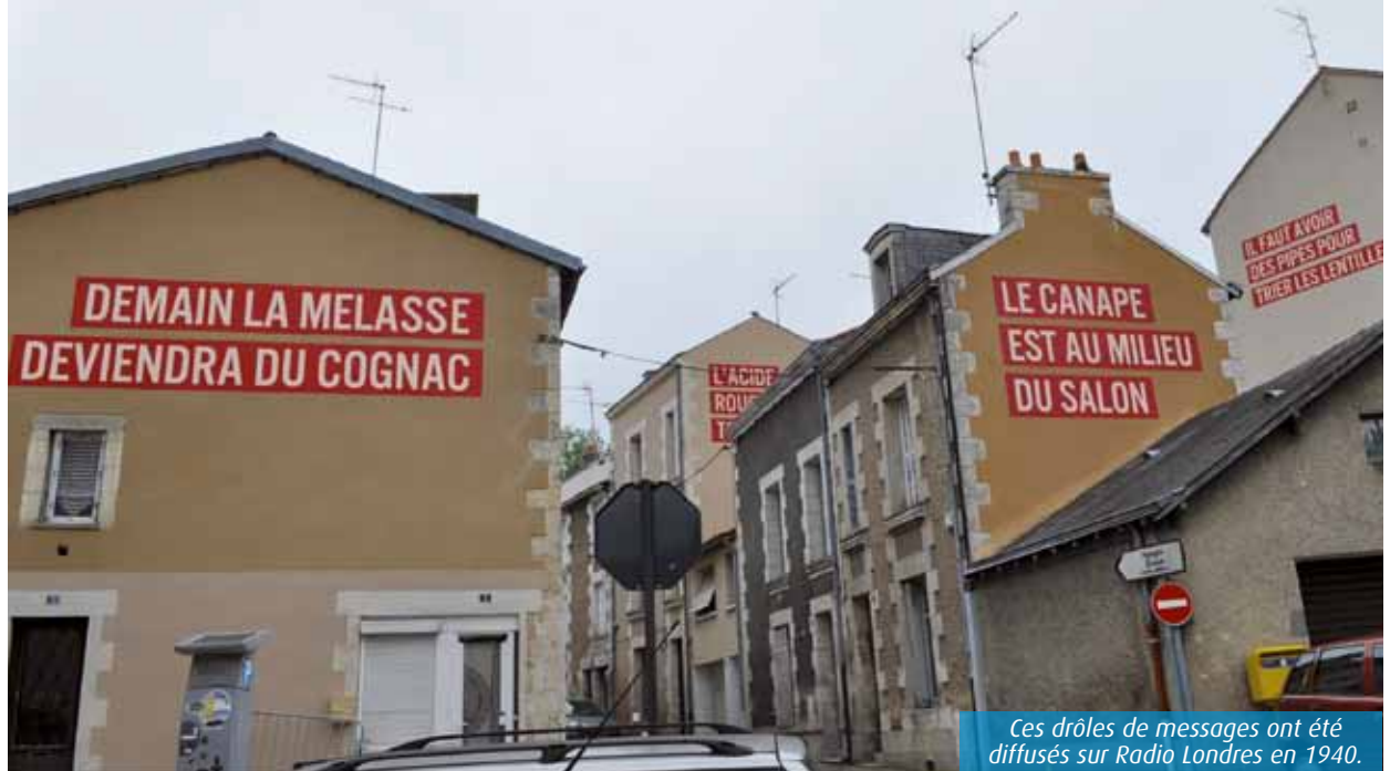
Ces drôles de messages ont été diffusés sur Radio Londres en 1940.

Depuis quelques semaines, les messages codés de Radio Londres s'affichent en grand sur les façades des immeubles du Pont-Neuf, à Poitiers. Cette œuvre monumentale, nommée « Quartier Libre », a été réalisée par le Suisse Christian Robert-Tissot.