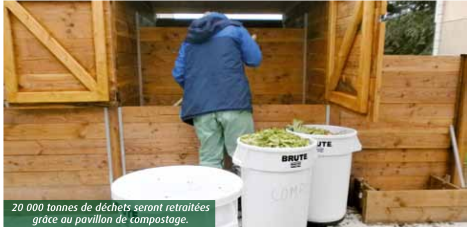
20 000 tonnes de déchets seront retraitées grâce au pavillon de compostage.

Tous les ans, plus de 400 000 repas sont préparés dans la cuisine centrale de Tony-Lainé pour les cantines scolaires et les Ehpad de Grand Poitiers. Jusqu'en mai, les épluchures de fruits et légumes et autres déchets « verts » partaient directement au bac à ordures ménagères. Sacrilège ! Pour réparer cette erreur, la collectivité a mis en place le premier pavillon de compostage du département. Près de 20 000 tonnes de détritus d'origine organique seront