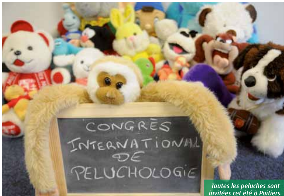
Toutes les peluches sont invitées cet été à Poitiers.