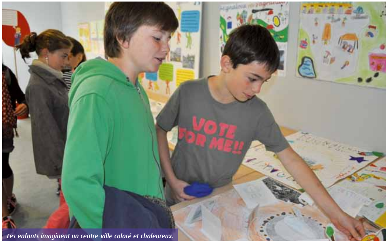
Les enfants imaginent un centre-ville coloré et chaleureux.