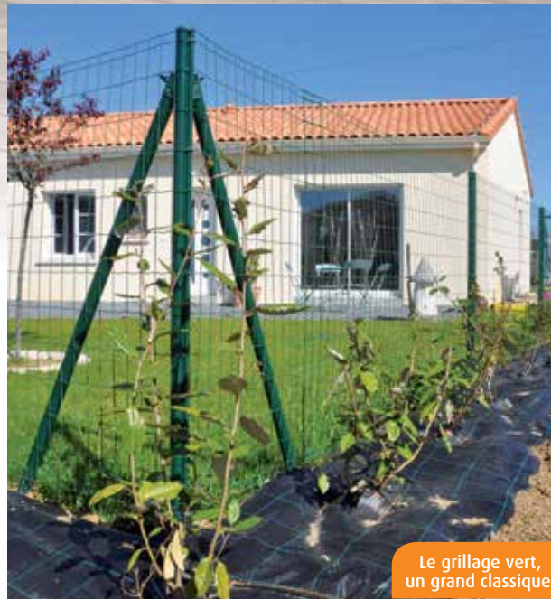
Le grillage vert, un grand classique.

Si les petites clôtures en piquets ou lattes de bois sont éco-