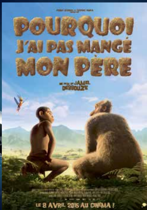
Film d'animation de Jamel Debbouze, avec Jamel Debbouze, Mélissa Theuriou, Arié Elmaleh (1h35).

► Florie Doublet - fdoulet@7apoitiers.fr