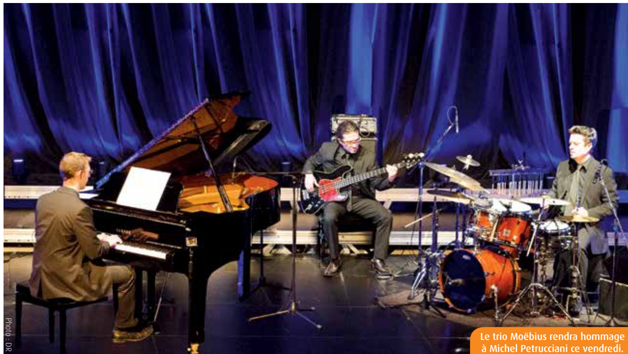
Le trio Moëbius rendra hommage à Michel Petrucciani ce vendredi.