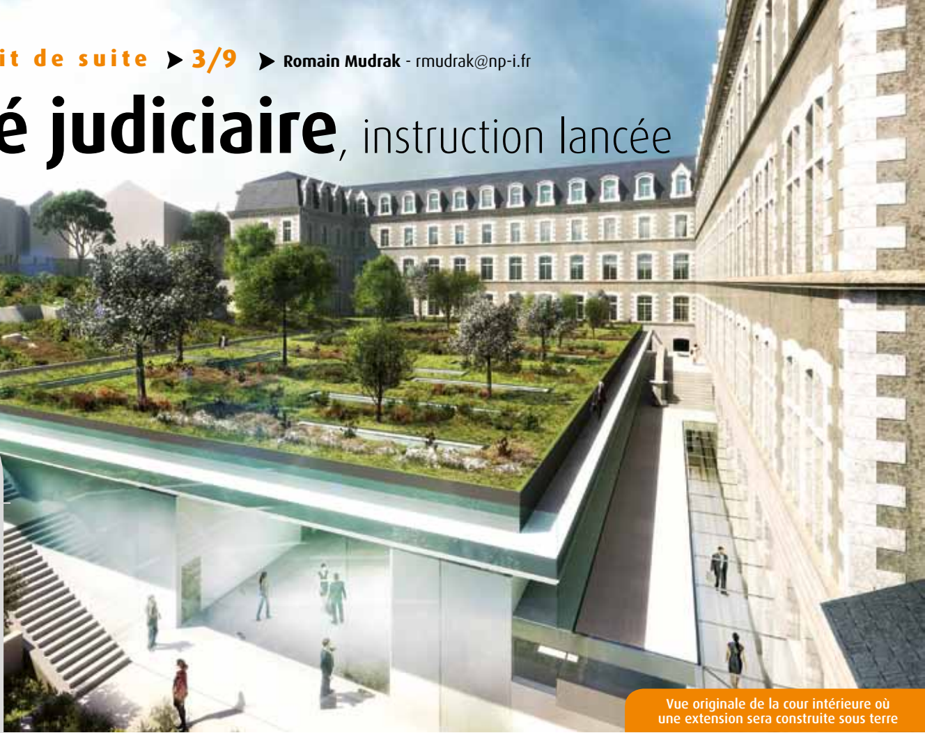
Vue originale de la cour intérieure où une extension sera construite sous terre