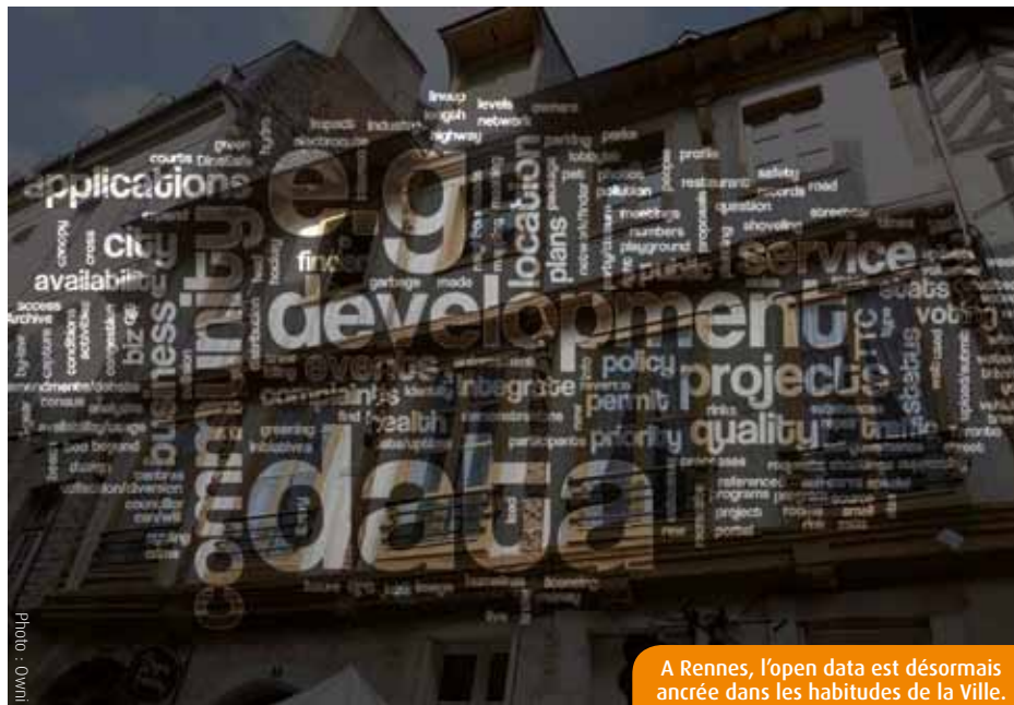
A Rennes, l'open data est désormais ancrée dans les habitudes de la Ville.

À Poitiers, la campagne des Municipales de mars 2014 penche singulièrement vers les transports. La gratuité par ci, deux téléphériques urbains par là, le viaduc bientôt inauguré... Les suggestions ou réalisations ne manquent pas sur la table. Eux préféreraient que les candidats déclarés s'attachent davantage à « construire le Poitiers numérique de demain ». Réunis sous une seule et même bannière, une trentaine de Poitevins, acteurs publics ou privés du secteur, ont dévoilé, la semaine