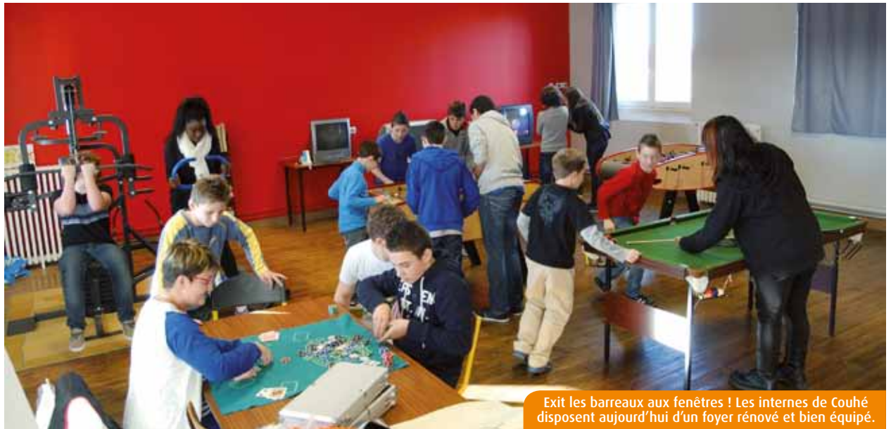
Exit les barreaux aux fenêtres ! Les internes de Couhé disposent aujourd'hui d'un foyer rénové et bien équipé.

L'Assemblée régionale a voté, vendredi dernier, une enveloppe de 500 000€ pour développer le concept de résidence d'artistes dans trente-cinq lycées de la région. Dans la Vienne, le Dolmen avait accueilli, pendant douze semaines, Ronan Mansec, pour évoquer la place de l'individu dans son environnement urbain et ses rêves d'avenir.