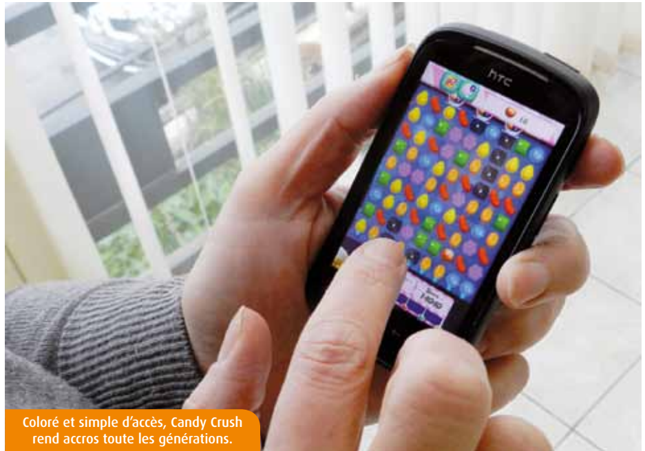
Coloré et simple d'accès, Candy Crush rend accros toute les générations.

Le spécialiste l'affirme : pour beaucoup, y compris et surtout les seniors, l'effet « Candy Crush » favorise l'intégration sociale et