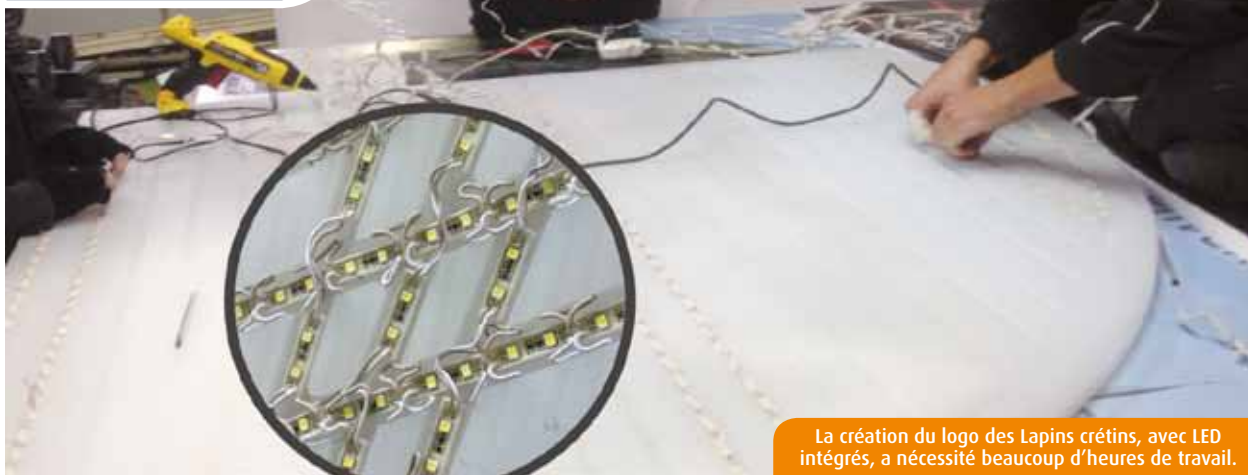
La création du logo des Lapins crétiens, avec LED intégrés, a nécessité beaucoup d'heures de travail.

Fondée en 2007 à Poitiers, Numerixis s'est depuis taillé une place au soleil du marquage publicitaire sous toutes ses formes. La TPE de neuf salariés vient de boucler un projet unique avec le Futuroscope.