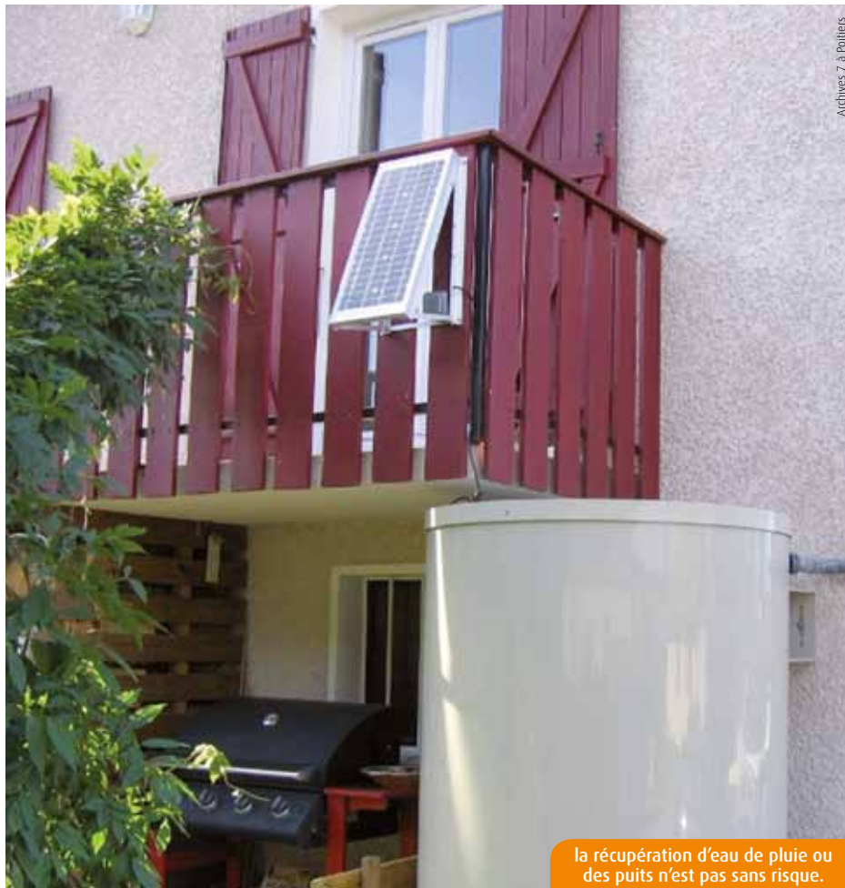
la récupération d'eau de pluie ou des puits n'est pas sans risque.

Des solutions sont mises en œuvre pour éviter toute menace de contamination bactériologique. Il est possible d'aména-