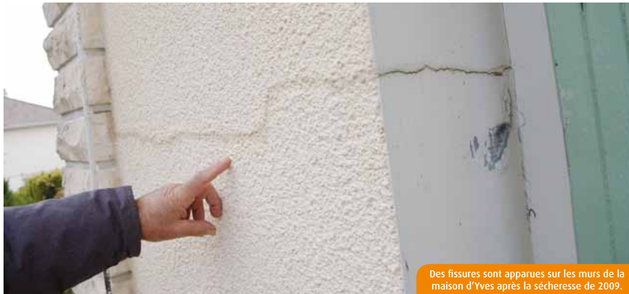
Des fissures sont apparues sur les murs de la maison d'Yves après la sécheresse de 2009.

A Fontaine le Comte, Montamisé, Mignaloux ou encore Poitiers, les mouvements de sol consécutifs à la sécheresse de 2009 ont détérioré des dizaines de maisons. Faute d'arrêt de catastrophe naturelle, leurs propriétaires ne peuvent pas se retourner vers leur assurance.