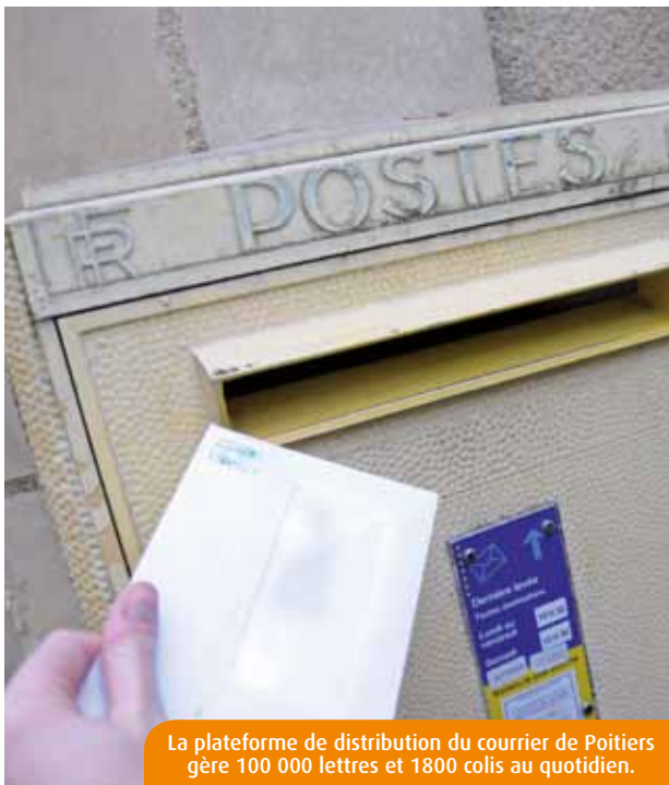
La plateforme de distribution du courrier de Poitiers gère 100 000 lettres et 1800 colis au quotidien.

A Poitiers, La Poste aurait-elle du mal à acheminer le courrier de ses clients dans les délais impartis ? Toujours est-il que certains se plaignent de retards répétés.