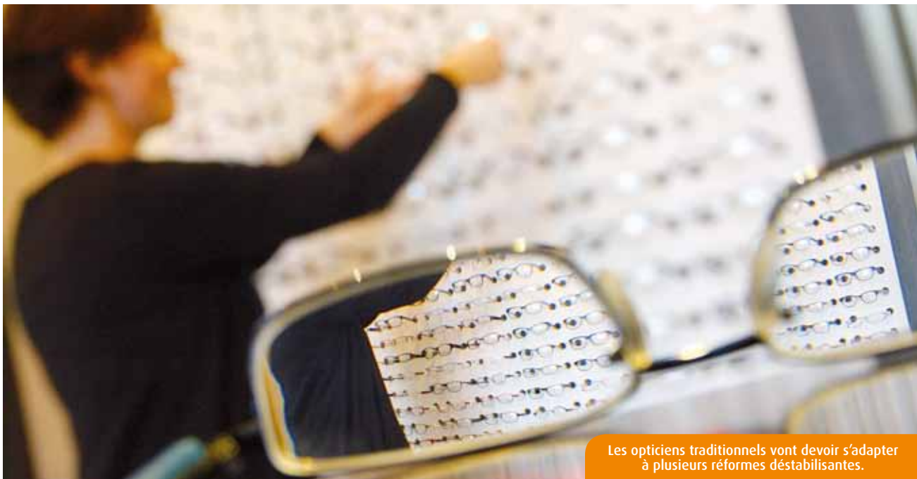
Les opticiens traditionnels vont devoir s'adapter à plusieurs réformes déstabilisantes.