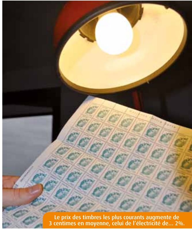
Le prix des timbres les plus courants augmente de 3 centimes en moyenne, celui de l'électricité de... 2%.

On le savait, : la facture d'électricité se gonflera cette année de 2% environ. Le gaz aussi va augmenter, du fait du passage à 20% de la TVA le concernant. Tout comme le timbre poste, pour lequel une hausse de 3 centimes en moyenne est annoncée sur les modèles les plus courants, tels que la lettre verte.