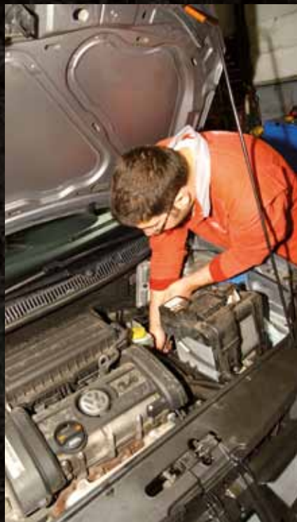
A lire aussi : « Le top 30 des métiers qui recrutent » sur e-orientations.com

Le palmarès obtenu, en octobre, par l'institut Viaoice pour RTL et Le Nouvel Observateur est étonnant. Malgré toutes les difficultés qu'ils rencontrent, les cadres du public, les agriculteurs et les enseignants seraient les plus heureux. Les médecins, pharmaciens et professions libérales n'arrivent qu'en 5 e et 6 e positions. L'argent ne ferait donc pas le bonheur ?