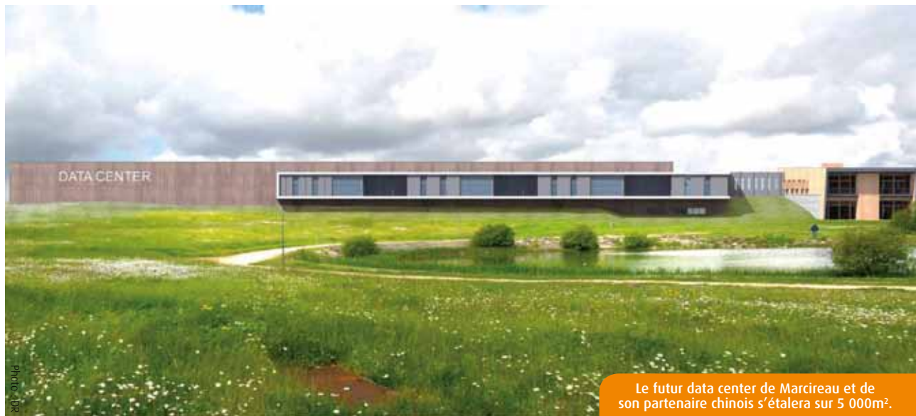
Le futur data center de Marcireau et de son partenaire chinois s'étalera sur 5 000m 2 .

Le « 7 » vous l'a révélé en exclusivité la semaine dernière. L'entreprise Marcireau et son partenaire indien s'apprêtent à bâtir un data center de 5 000m 2 sur la Technopole du Futuroscope. Un investissement de 35M€, avec cinquante emplois prévus à moyen terme.