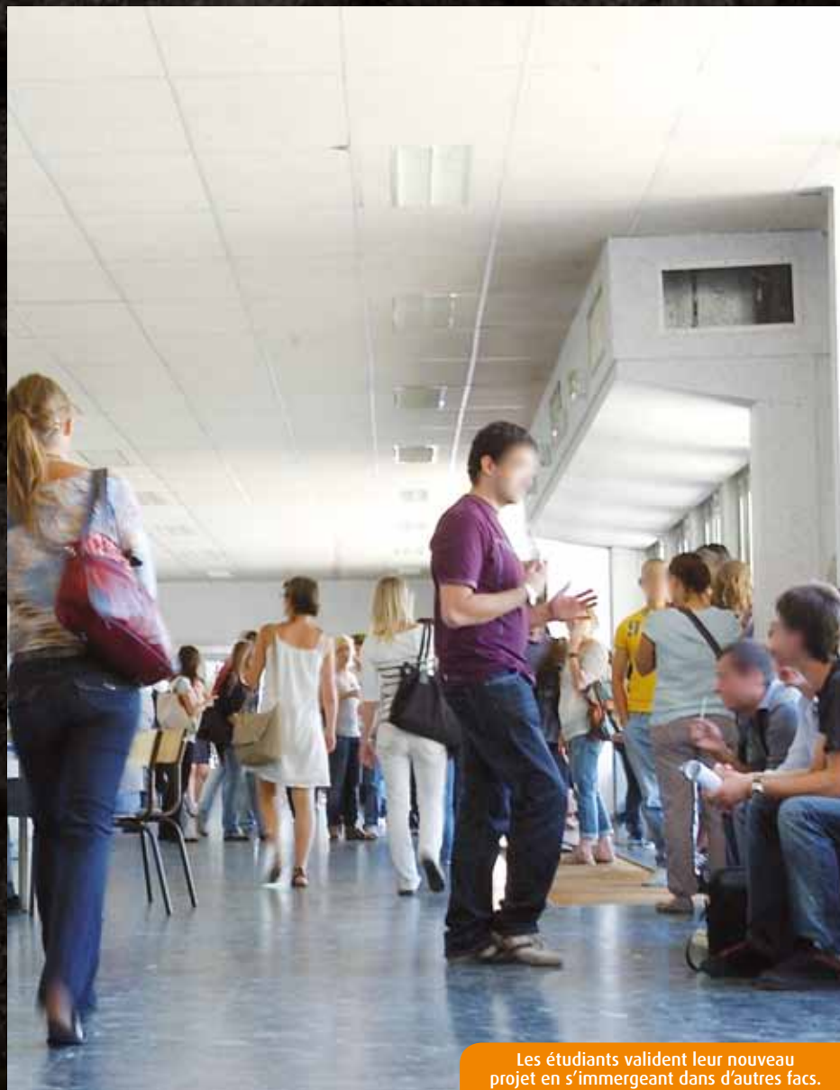
Les étudiants valident leur nouveau projet en s'immergeant dans d'autres facs.