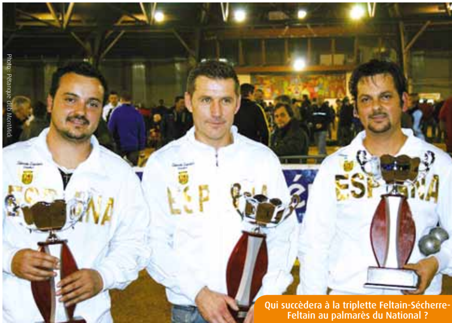
Qui succèdera à la triplette Feltain-Sécherre-Feltain au palmarès du National ?

Qu'à cela ne tienne, l'expérience de ces durs à cuire offre toutes les garanties de succès. A partir de vendredi, ils recevront le renfort d'une poignée d'autres habitués de la grand'messe de janvier pour donner à cette 24 e édition historique le cachet qu'elle est en droit d'attendre. Historique oui, car, pour la première fois à Poitiers, le tournoi des « 55 ans et + » (désolé, on ne dit plus vétérans) proposera, le premier jour, un plateau gargantuesque de 512 triplettes. Au-delà, que de l'ordinaire : un National à 512 équipes, là encore, disputé toute la journée de samedi et