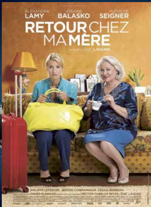
Comédie d'Eric Lavaine, avec Josiane Balasko, Alexandra Lamy, Mathilde Seigner (1h37).