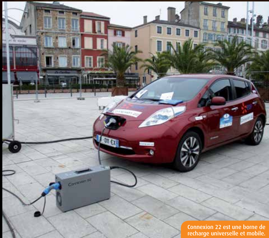
Connexion 22 est une borne de recharge universelle et mobile.