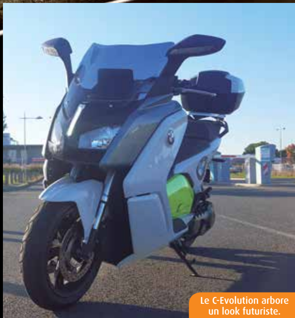
Le C-Evolution arbore un look futuriste.

La renommée de BMW n'est plus à faire dans le monde de la moto. Fabricant à succès de grosses cylindrées, le constructeur bavarois s'essaie, depuis le début des années 2000, aux maxi-scooters. Avec plus ou moins de succès, si l'on jette un œil aux volumes de vente. Mais la donne pourrait bien changer, avec le nouveau bébé 100% électrique de la marque allemande : le C-Evolution. Annoncé comme révolutionnaire, ce scooter classé dans la catégorie des 125 cm 3 dispose de la puissance d'un 600 cm 3 . Un avantage de taille pour l'engin, accessible à tous