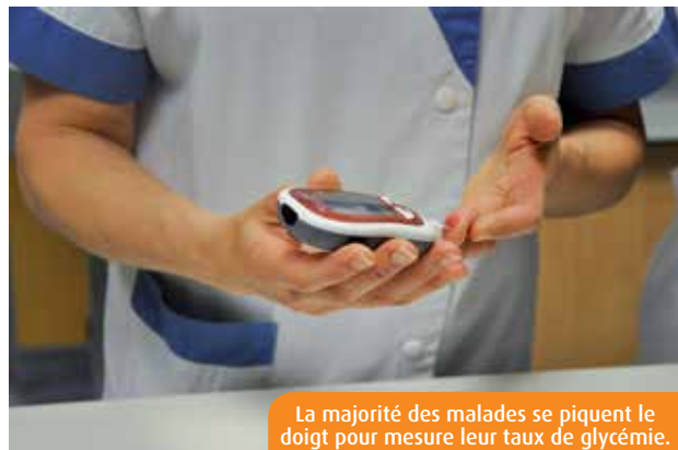
La majorité des malades se piquent le doigt pour mesurer leur taux de glycémie.

La Semaine nationale de prévention du diabète se déroule jusqu'à vendredi. Cette maladie chronique touche une personne sur onze dans le monde. Aujourd'hui, des innovations thérapeutiques sont proposées aux malades, mais elles ne sont pas toujours remboursées.