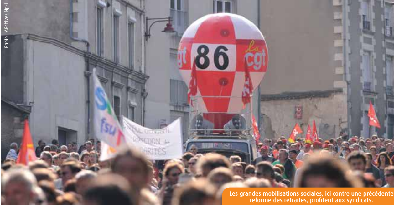
Les grandes mobilisations sociales, ici contre une précédente réforme des retraites, profitent aux syndicats.