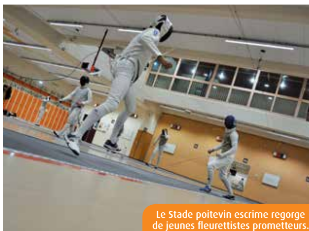
Le Stade poitevin escrime regorge de jeunes fleuretistes prometteurs.