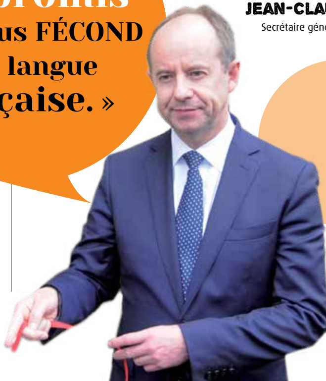
Jean-Jacques Urvoas Ministre de la Justice, en marge de sa visite à Poitiers.