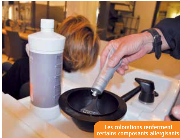
Les colorations renferment certains composants allergisants.

Passionnée désormais des teintures « 100% naturelles à base de plantes tinctoriales ». « Elles cachent parfaitement les che-