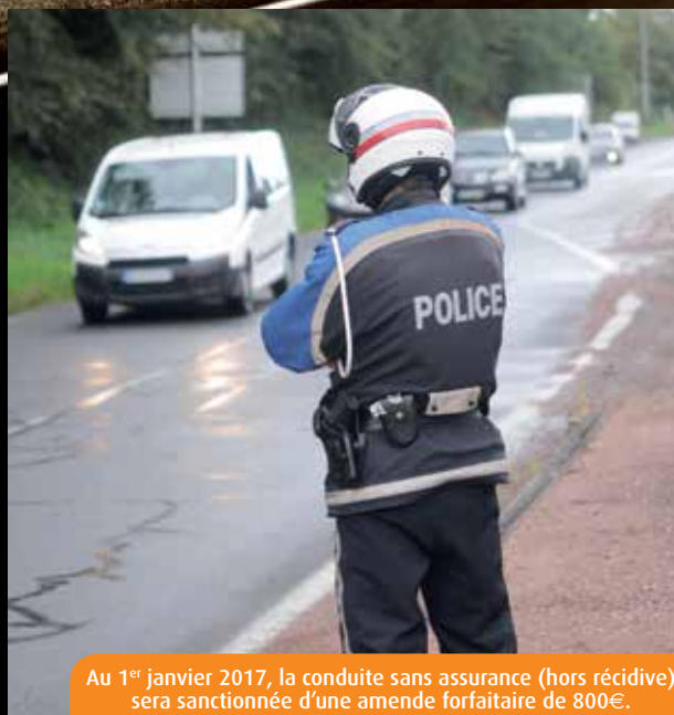
Au 1 er janvier 2017, la conduite sans assurance (hors récidive) sera sanctionnée d'une amende forfaitaire de 800€.

« Les chiffres 2015 montrent que la non-assurance reste plus que jamais un enjeu majeur en matière de sécurité routière puisque, contrairement aux idées reçues, conduire sans assurance est souvent révélateur de comportements à risques, explique la direction du FGAO. Les conducteurs non-assurés se révèlent plus dangereux que les autres, en particulier parce