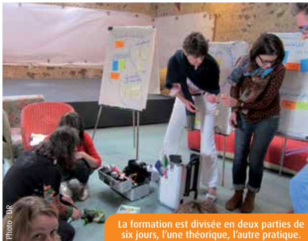
La formation est divisée en deux parties de six jours, l'une théorique, l'autre pratique.

A u Cnam, on peut obtenir un diplôme d'ingénieur, se former tout au long de la vie dans les secteurs du commerce, de l'économie, de l'informatique, mais aussi obtenir un certificat... de créativité ! Depuis huit ans, le Conservatoire national des arts et métiers du Poitou-Charentes s'associe à Créa-Université pour proposer une formation de douze jours, visant à développer les compétences créatives individuelles et