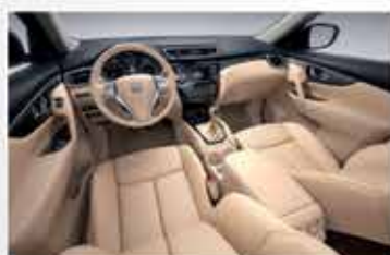
Large espace intérieur