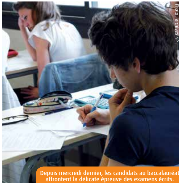
Depuis mercredi dernier, les candidats au baccalauréat affrontent la délicate épreuve des examens écrits.