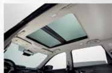
Toit panoramique ouvrant*