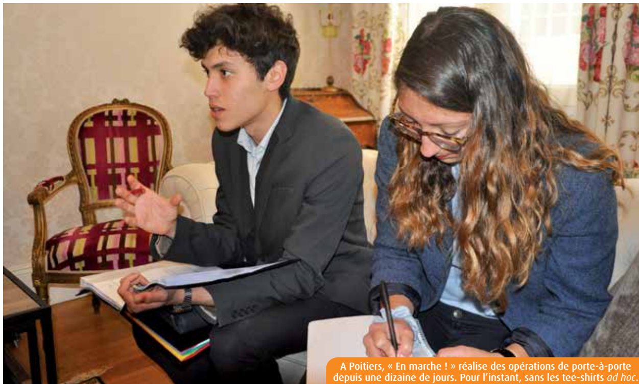
A Poitiers, « En marche ! » réalise des opérations de porte-à-porte depuis une dizaine de jours. Pour l'instant, sans les tee-shirts ad hoc .

Lancé par le ministre de l'Economie Emmanuel Macron, le mouvement « En marche ! » compte des partisans dans la Vienne. Qui ont démarré une vaste opération de porte-à-porte pour recueillir l'avis des habitants sur l'état du pays.