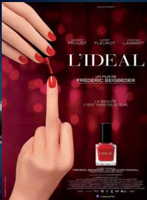
Comédie de Frédéric Beigbeder avec Gaspard Proust, Audrey Fleurot, Anamaria Vartolomei (1h30).