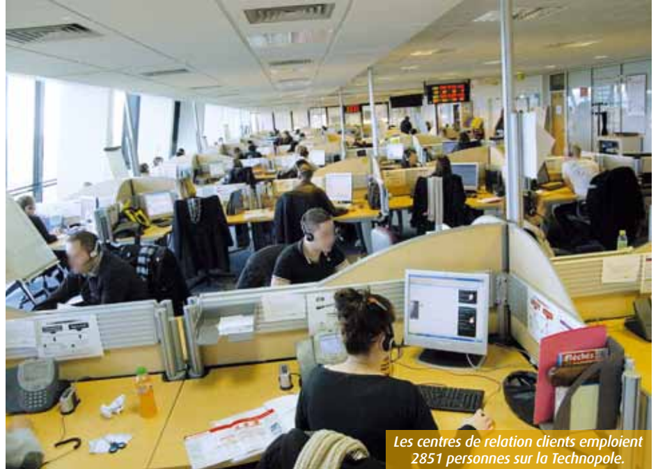
Les centres de relation clients emploient 2851 personnes sur la Technopole.

Plus gros employeur privé du département (1200 salariés), LaSer Contact suscite d'ailleurs des inquiétudes après son rachat par le groupe Armatix. Les délégués CGT s'émeuvent de l'ouverture d'un centre au Portugal en particulier et de la