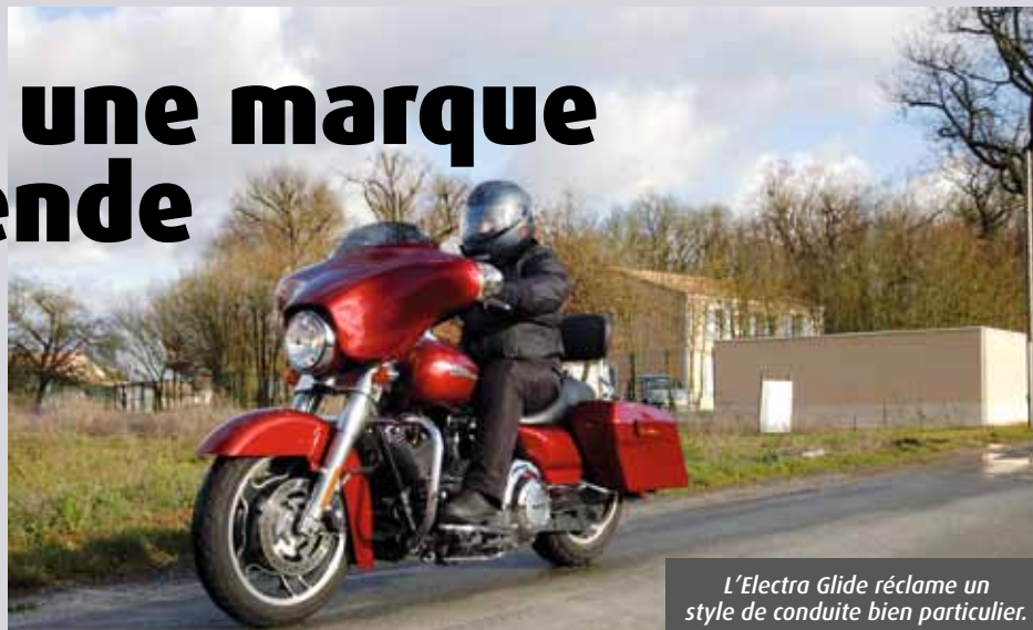
L'Electra Glide réclame un style de conduite bien particulier.

minutes, ce détail est oublié. « J'ai les jambes très écartées, ce qui m'empêche de faire corps avec la machine. Contrairement à d'autres motos, celle-ci se conduit plus avec les bras qu'avec les genoux, surtout à faible vitesse. Là aussi, c'est une habitude à prendre. Le poids n'est pas un problème », commente « JB ».