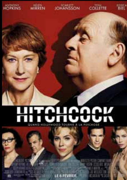
Biopic de Sacha Gervasi avec Anthony Hopkins, Helen Mirren, Scarlett Johansson (1h38).