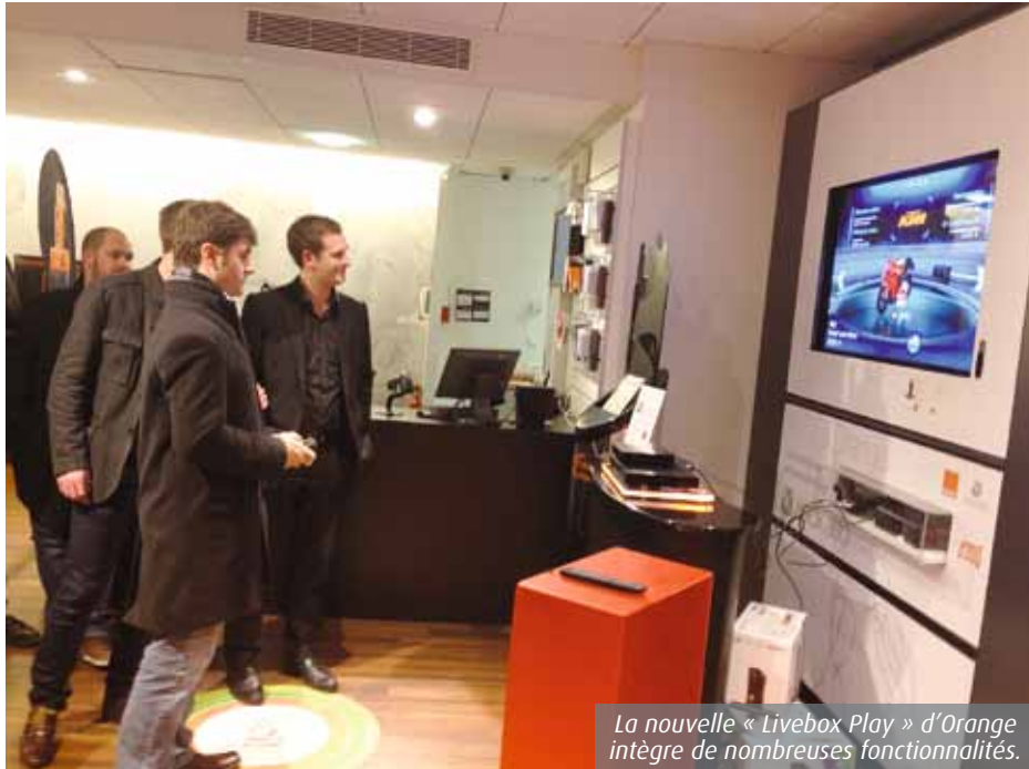
La nouvelle « Livebox Play » d'Orange intègre de nombreuses fonctionnalités.

Mardi 5 février, Poitiers Notre-Dame. Le staff d'Orange a convié quelques twittos dans sa boutique du centre-ville... après la fermeture. Au menu : la découverte de la nouvelle Livebox Play, dont la sortie est prévue le surlendemain. Après une petite demi-heure de « démo », le verdict tombe : cette box devrait séduire les adeptes du « global service ». A l'instar d'un joystick, sa télécommande permet de