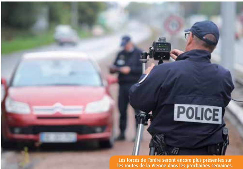
Les forces de l'ordre seront encore plus présentes sur les routes de la Vienne dans les prochaines semaines.