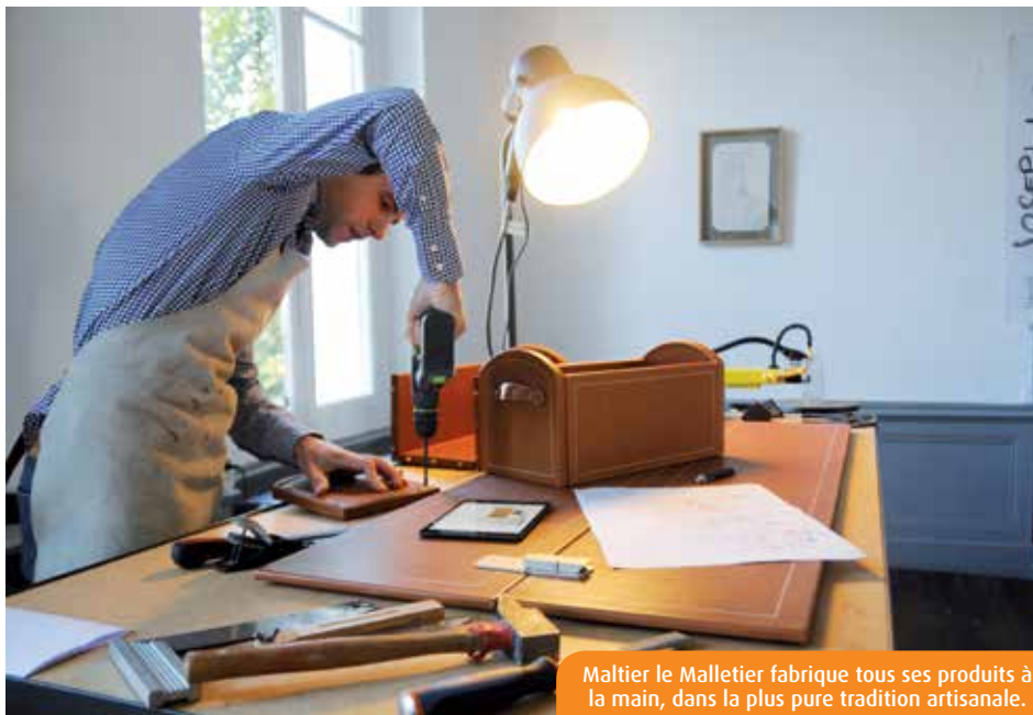
Maltier le Malletier fabrique tous ses produits à la main, dans la plus pure tradition artisanale.

« En 2016, nous devrions voir émerger une dizaine de projets de malles avec, pour chacun, plusieurs pièces à fabriquer », esquisse le fondateur et dirigeant de Maltier le Malletier. Singapour, la Corée du Sud, le Qatar, la Chine... Autant de pays exotiques dans lesquels sacs à main et accessoires ont fait le bonheur d'amateurs de luxe à la française. Mais l'œuvre de persuasion se révèle longue et délicate, dans un monde du luxe aux frontières établies. Son premier coup d'éclat, le malletier