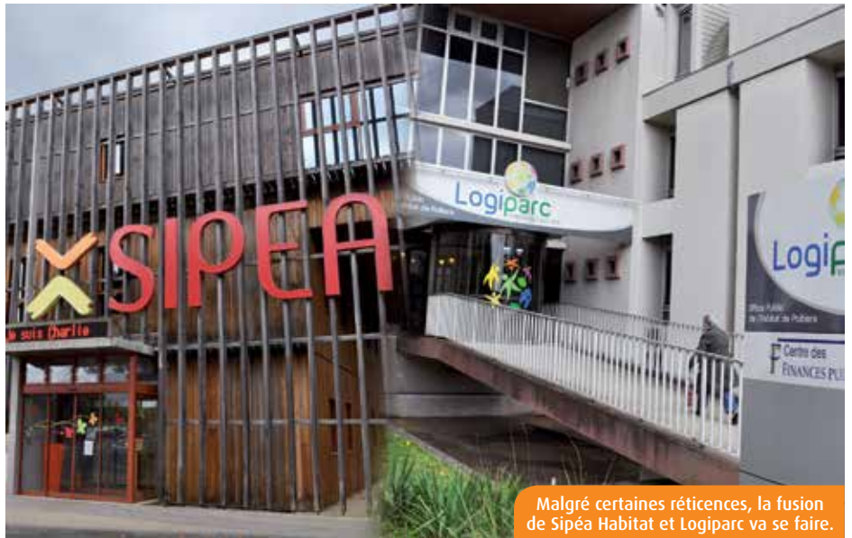
Malgré certaines réticences, la fusion de Sipéa Habitat et Logiparc va se faire.