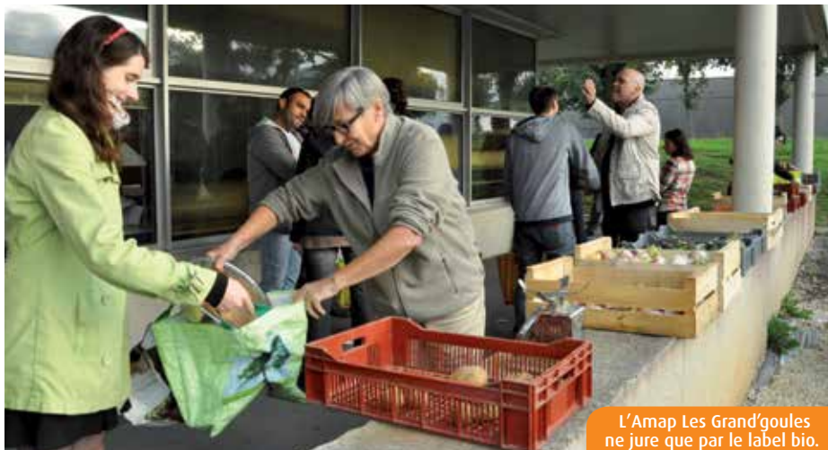
L'Amap Les Grand'goules ne jure que par le label bio.

En France, près de 50 000 familles seraient adhérentes à une Association pour le maintien d'une agriculture paysanne (Amap). Le succès de ces structures permettant de s'approvisionner en produits locaux et de qualité est grandissant. Mais quels engagements tiennent-elles réellement ?