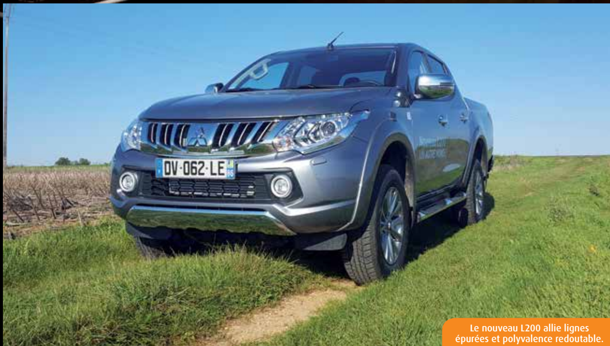
Le nouveau L200 allie lignes épurées et polyvalence redoutable.

Peinture métallisée : 590€. Pack Mitsubishi Navi Way (navigation, mains libres Bluetooth, connexion intelligente smartphone) : 950€. Retrouvez le détail des options sur www.mitsubishi-motors.fr