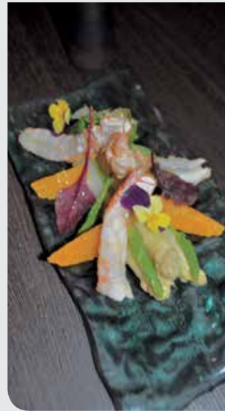
Le Vingélique 37, rue Sadi-Carnot. Poitiers. 05 49 55 07 03.

Epluchez vos asperges et ficelez-les en grosses bottes. Faites-les cuire douze minutes dans de l'eau salée, puis rafraîchissez-les dans de l'eau glacée. Egouttez-les et faites-les mariner dans une vinaigrette au jus d'orange (deux tiers de jus d'orange, un tiers de vinaigre, un tiers d'huile). Vous pouvez ajouter le jus d'un citron dans la marinade. Poêlez à vif des quartiers d'orange. Décortiquez les langoustines puis poêlez-les à leur tour. Dressez et dégustez !