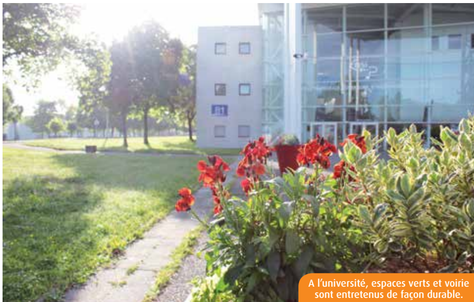
A l'université, espaces verts et voirie sont entretenus de façon durable.