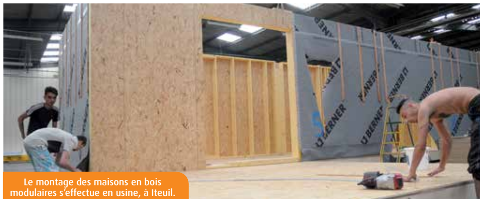
Le montage des maisons en bois modulaires s'effectue en usine, à Iteuil.

A raison de trente foires par an dans le Grand Ouest, dont celle de Poitiers, qui a débuté samedi, France Bois Modulaire a mar-