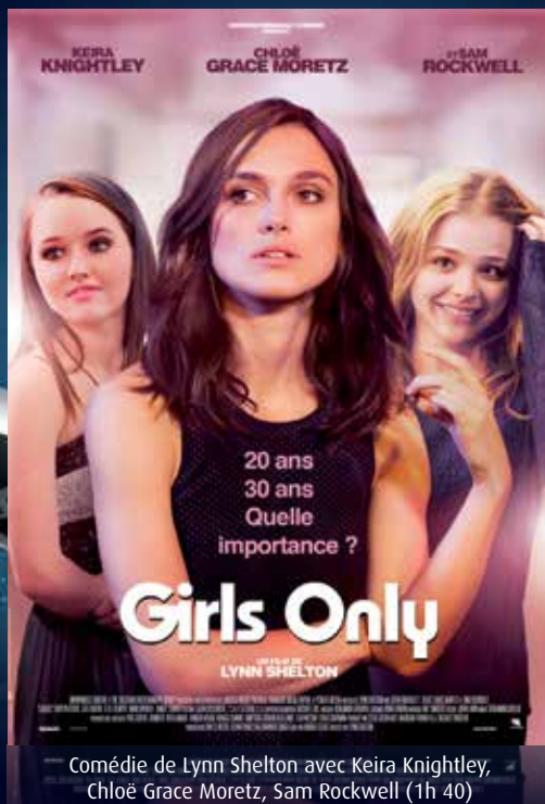
Comédie de Lynn Shelton avec Keira Knightley, Chloë Grace Moretz, Sam Rockwell (1h 40)