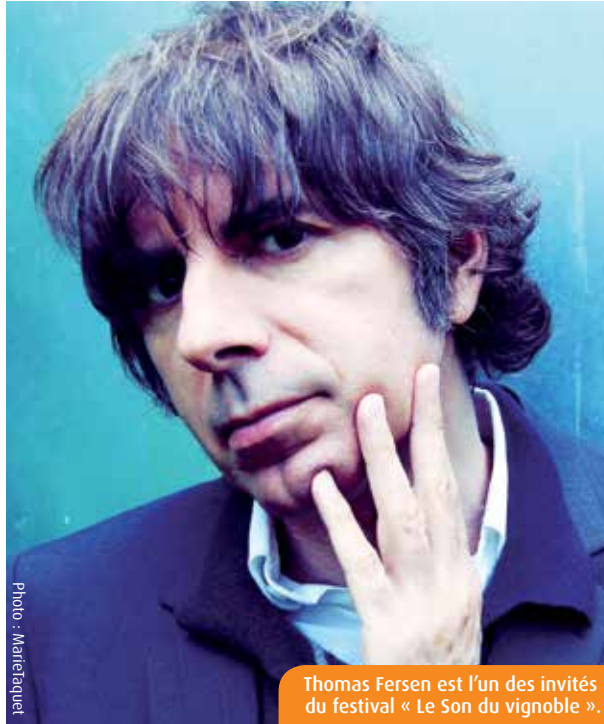
Thomas Fersen est l'un des invités du festival « Le Son du vignoble ».

A 9 ans, je chantais comme une comptine La Chauve-souris, à 15 ans, je rêvais d'une aussi belle histoire d'amour que celle du papillon Pégase et de son ampoule et, à 25 ans, je découvre que vous avez un grain de beauté sur la fesse