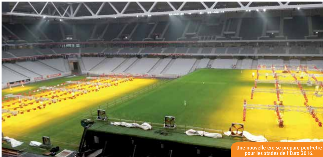
Une nouvelle ère se prépare peut-être pour les stades de l'Euro 2016.