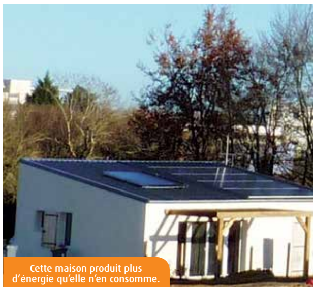
Cette maison produit plus d'énergie qu'elle n'en consomme.

A Saint-Benoît, deux pavillons gérés par Habitat 86 produisent plus d'énergie qu'ils n'en consomment. Il s'agit de « maisons à énergie positive ». Une première régionale pour un bailleur social.