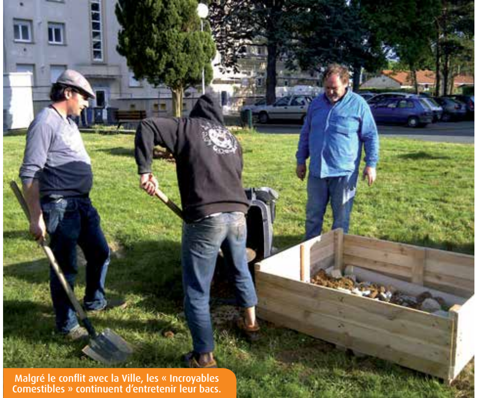
Malgré le conflit avec la Ville, les « Incroyables Comestibles » continuent d'entretenir leur bacs.

Le mouvement propose une mise à disposition gratuite d'aliments cultivés par tout un chacun. Plusieurs bacs sont installés devant l'Auberge de jeunesse de Bellejouanne, la rue du Petit Ruisseau et dans quelques recoins de Poitiers-Sud. « Offre son temps celui qui peut et prend celui qui veut », expliquent les membres du mouvement. Seulement voilà, la Ville ne semble pas adhérer à cette idéologie. « Ils viennent à 7h du matin détruire les bacs à coup de bulldozer, sans même nous prévenir !, s'insurge le