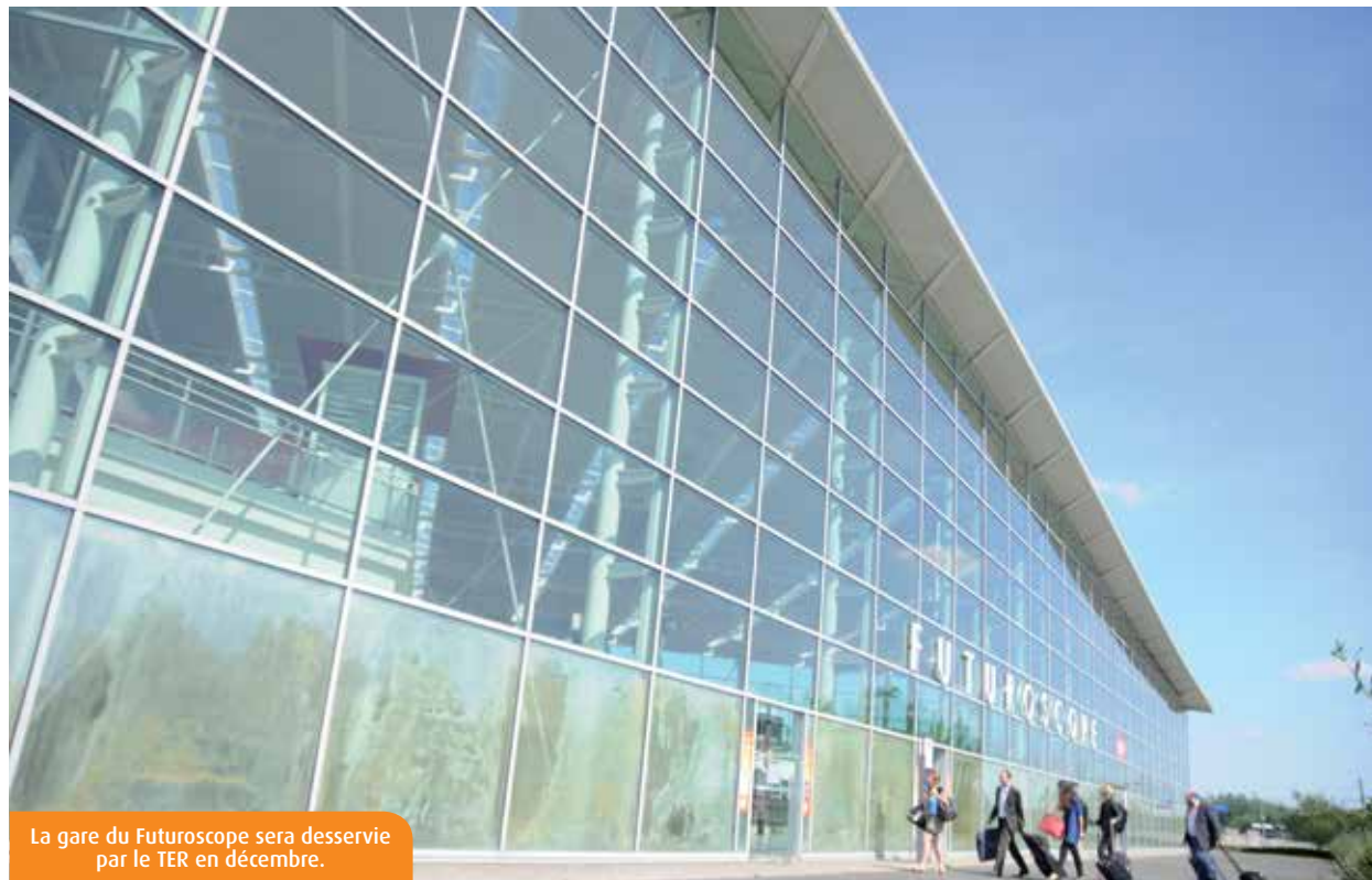
La gare du Futuroscope sera desservie par le TER en décembre.

A partir de décembre, onze allers et retours seront assurés par des TER entre Poitiers et la gare du Futuroscope. Les usagers seront ensuite transportés vers les zones d'activité en bus. Positionnés à des horaires stratégiques, matin, midi et soir, ces trains devraient séduire les salariés de la Technopole.