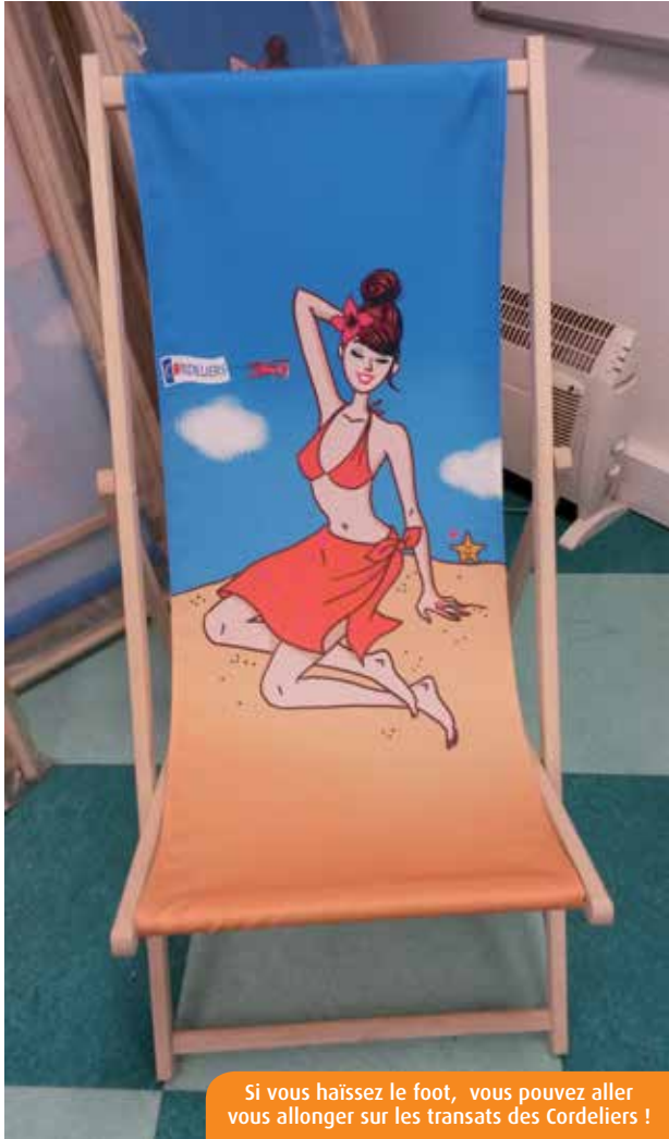
Si vous haïssez le foot, vous pouvez aller vous allonger sur les transats des Cordeliers !

Vous haïssez le football et vous êtes catastrophé par la Coupe du monde ? Ne vous inquiétez pas, le « 7 » vous a trouvé plusieurs alternatives.