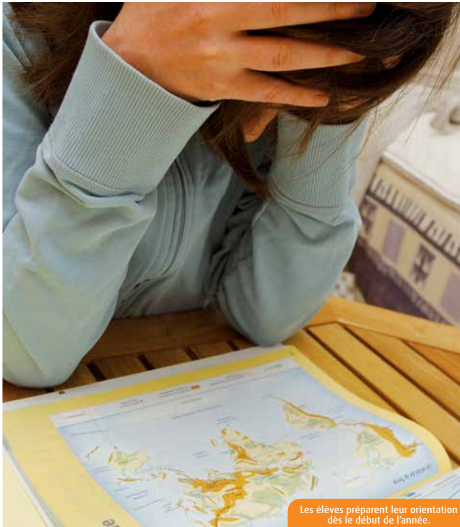
Les élèves préparent leur orientation dès le début de l'année.