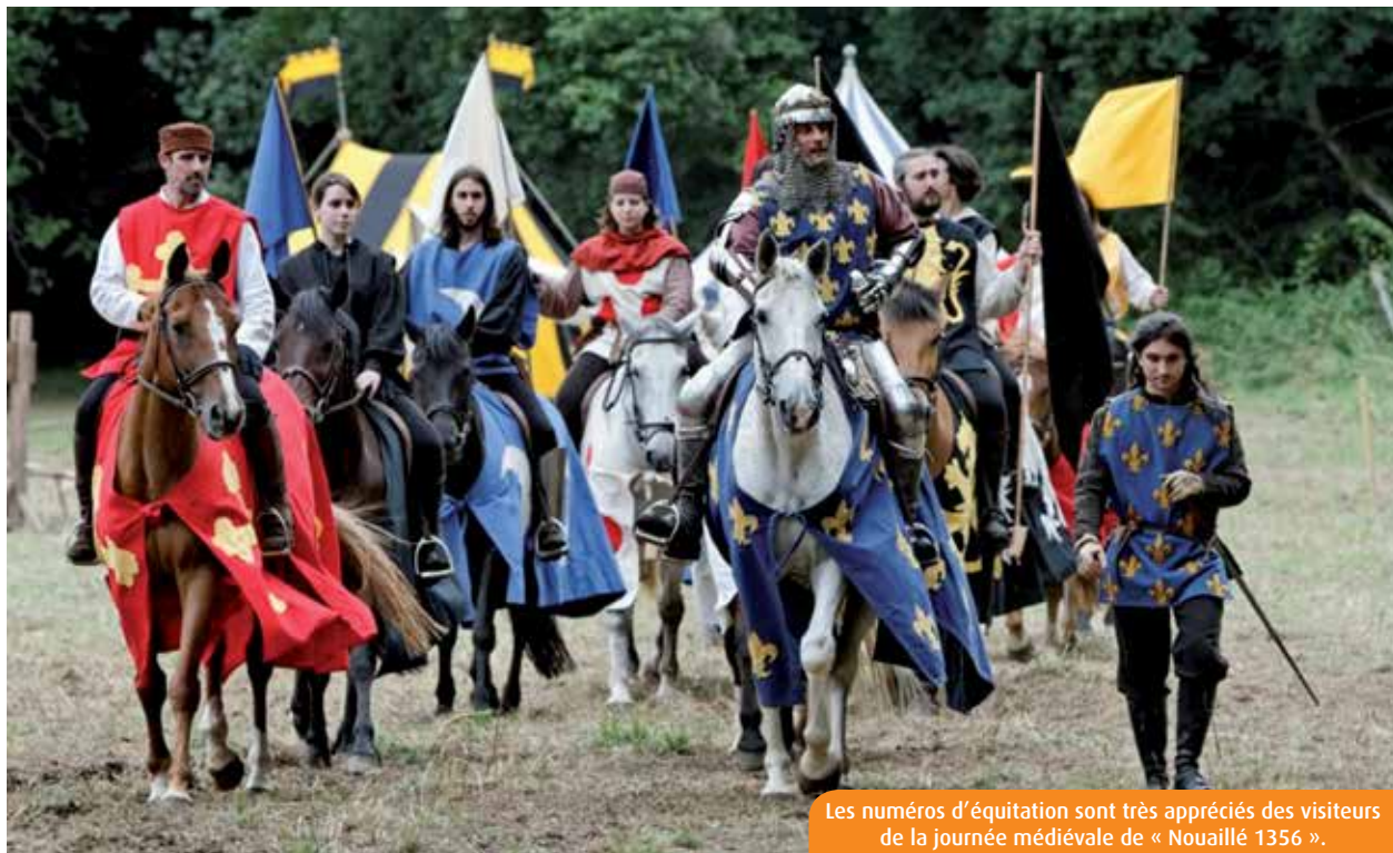
Les numéros d'équitation sont très appréciés des visiteurs de la journée médiévale de « Nouaillé 1356 ».