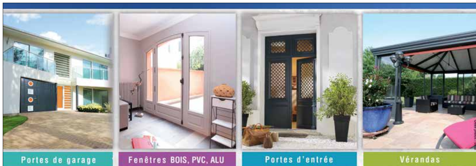
Portes de garage

Côté budget, les prix varient entre 1 500 et 4 000€ selon l'épaisseur, les performances techniques et acoustiques, l'habillage et la marque de la porte. Pour une pose optimale, le recours à un serrurier est vivement conseillé.