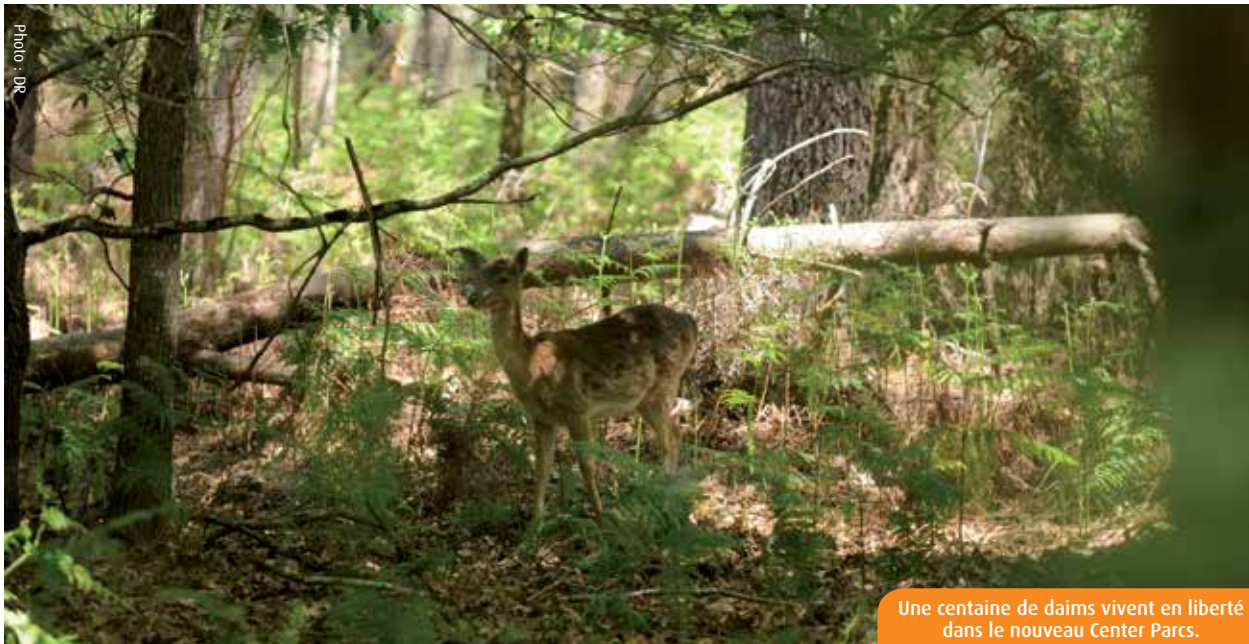
Une centaine de daims vivent en liberté dans le nouveau Center Parcs.

Dans le Nord-Vienne, le chantier de construction du cinquième Center Parcs français touche à sa fin. Le 15 juin, les premiers vacanciers seront accueillis sur le Domaine du Bois aux daims. Les réservations seraient déjà « très encourageantes ».