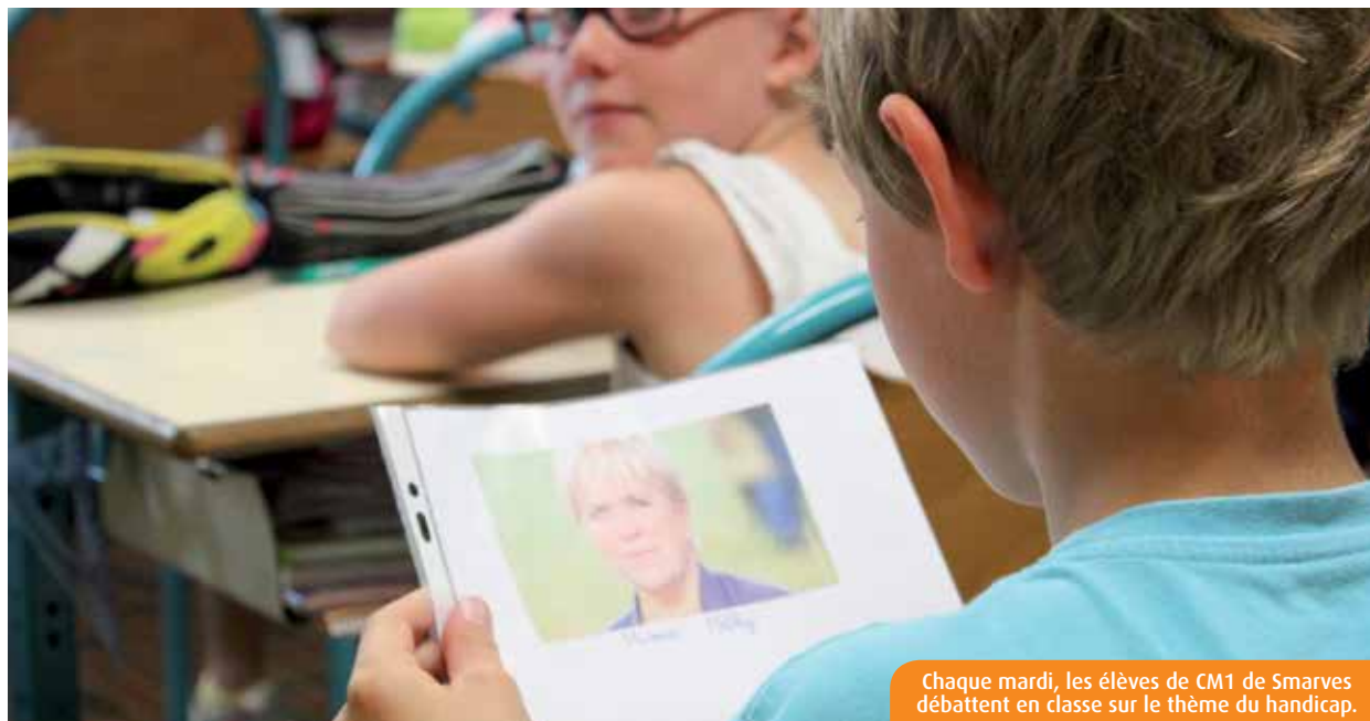
Chaque mardi, les élèves de CM1 de Smarves débattent en classe sur le thème du handicap.