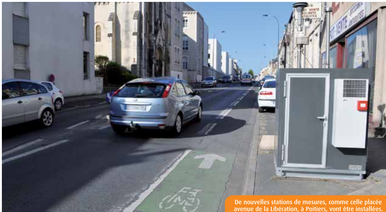
De nouvelles stations de mesures, comme celle placée avenue de la Libération, à Poitiers, vont être installées.