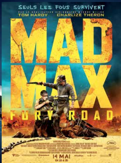
Film d'action de George Miller avec Tom Hardy, Charlize Theron, Nicholas Hoult, Zoé Kravitz (2h)