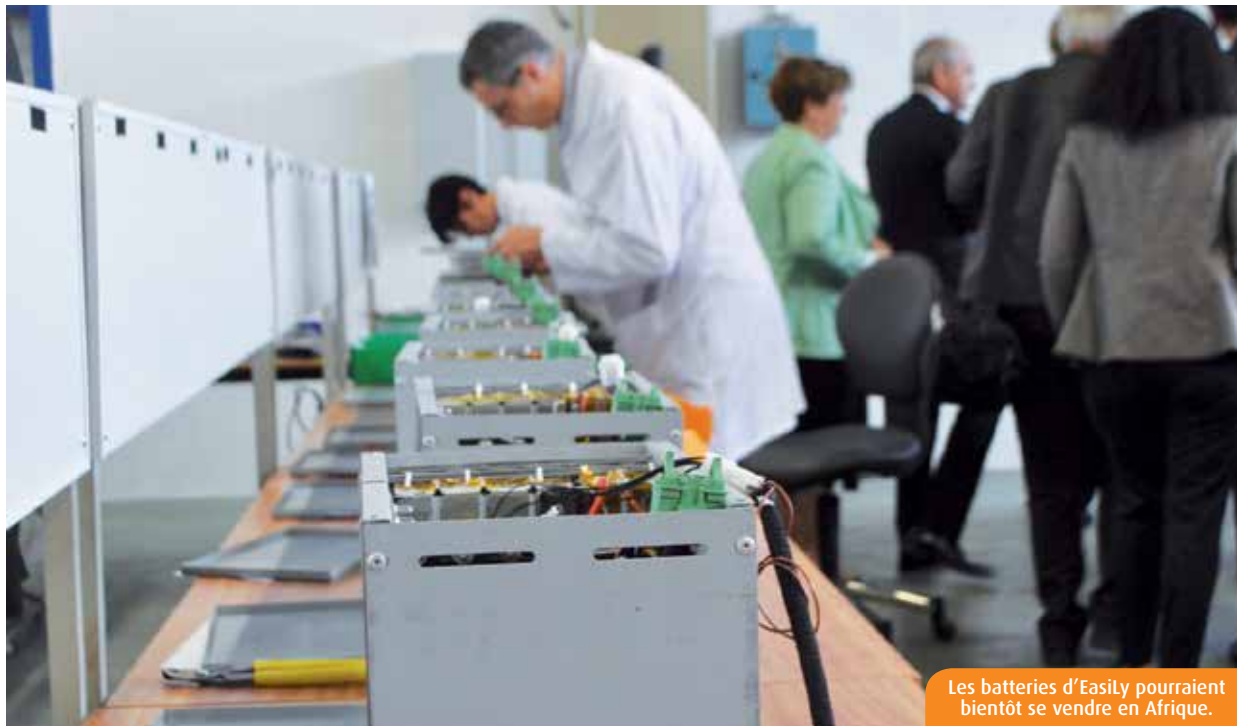
Les batteries d'EasyLi pourraient bientôt se vendre en Afrique.