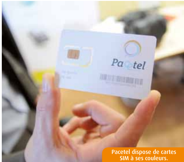
Pacotel dispose de cartes SIM à ses couleurs.

Six PME picto-charentaises spécialistes des réseaux et de l'informatique s'associent pour créer un nouvel opérateur télécoms. Nom de code : Pacotel. Cible : les entreprises.