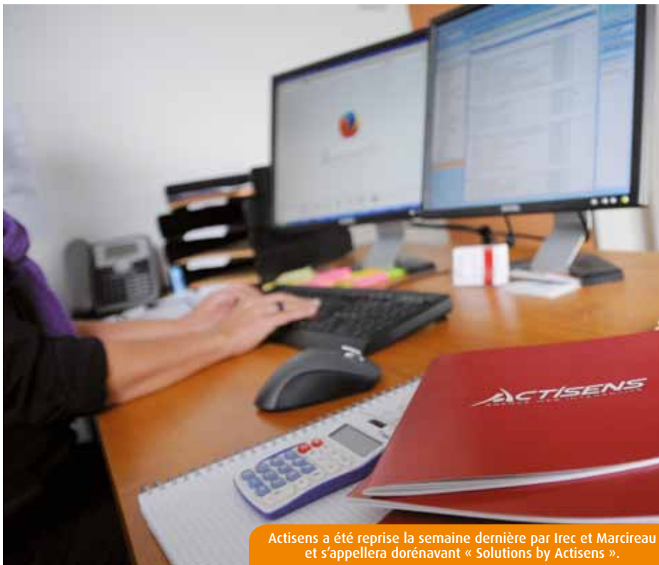
Actisens a été reprise la semaine dernière par Irec et Marcireau et s'appellera dorénavant « Solutions by Actisens ».