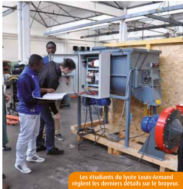
Les étudiants du lycée Louis-Armand règlent les derniers détails sur le broyeur.

Les élèves de BTS « Conception et réalisation de systèmes automatiques » du lycée Louis-Armand ont réalisé un broyeur à céréales. En décembre, cette machine sera expédiée vers le Burkina Faso, où elle aidera les agriculteurs locaux à fabriquer des farines d'alimentation avicole.