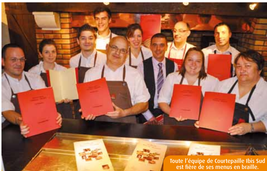
Toute l'équipe de Courtepaille Ibis Sud est fière de ses menus en braille.