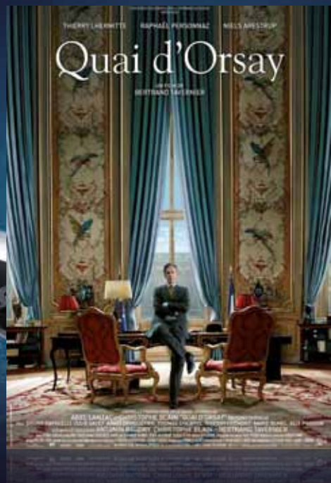
Comédie de Bertrand Tavernier avec Thierry Lhermitte, Raphaël Personnaz, Niels Arestrup (1h53).