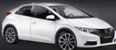
CIVIC 1.6 i-DTEC