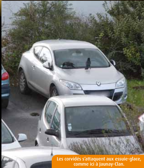
Les corvidés s'attaquent aux essuie-glaces, comme ici à Jaunay-Clan.

Impossible de dater précisément le phénomène, mais une chose est sûre : les corvidés adorent déchiqueter les essuie-glaces... Tentative d'explication.