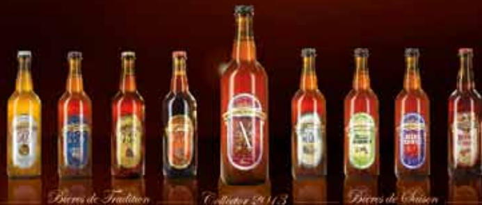
Bières de Tradition

51, route de Cian - 86170 Neuville de Poitou