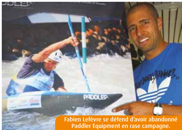
Fabien Lefèvre se défend d'avoir abandonné Paddler Equipment en rase campagne.

Les deux salariés de la société Paddler Equipment, installée sur la Technopole du Futuroscope, accusent leur gérant de les avoir « abandonnés ». Le champion du monde de kayak Fabien Lefèvre crie au mensonge et craint pour sa notoriété.