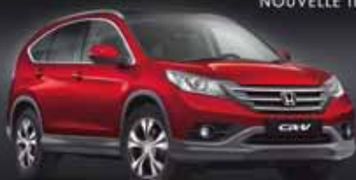
CR-V 1.6 i-DTEC