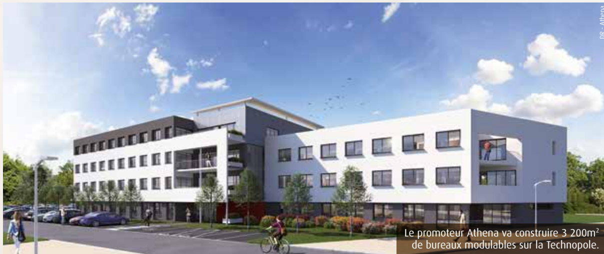
Le promoteur Athena va construire 3 200m 2 de bureaux modulables sur la Technopole.

L'Arena concentre toutes les attentions. Pourtant ce n'est pas le seul chantier engagé sur la Technopole du Futuroscope, qui apparaît toujours aussi attractive. Hôtels, simulateur de chute libre, vague artificielle ou encore plateforme de recherche et immeubles de bureaux... Zoom sur les projets de 2020.