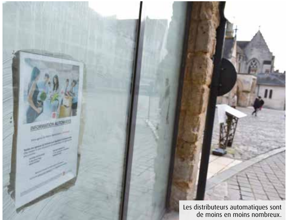
Les distributeurs automatiques sont de moins en moins nombreux.

A Poitiers, la vitrine à l'angle de la place De-Gaulle et de la rue de la Regratterie, à proximité du marché Notre-Dame, est désormais peinturlurée de blanc. Le distributeur automatique de billets (DAB) a fermé. Idem de l'autre côté de la place, où l'Agence postale a baissé rideau, emportant avec elle son DAB. A Châtelleraut, l'équipement, très prisé les jours de marché place Duplex, qui se trouvait à l'angle de la rue Bourbon et de la rue Colbert, a lui aussi disparu. En France, 81,3% des communes n'ont pas de distributeur automatique de billets. Et près de 3 000 d'entre eux ont fermé en trois ans. Ce phénomène est lié à une dématérialisation croissante qui se traduit dans les pratiques. Le nombre moyen de retraits d'espèces par an et par carte est en baisse : 25,4 en 2012 contre 22 en 2016. Pour être rentable, un DAB doit désormais recenser 5 000 retraits par an, contre 3 000 il y a quelques années. Inéluctablement, se posent les questions de la rationalisation et de la rentabilité. Du côté des établissements bancaires, le sujet se révèle