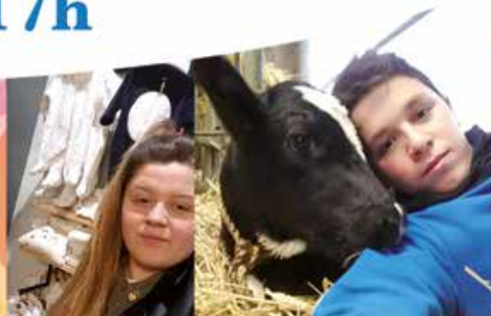
Commerces • Agriculture • Services à la personne

NOUVEAUTÉ Votre MFR est centre de formation d'apprentis