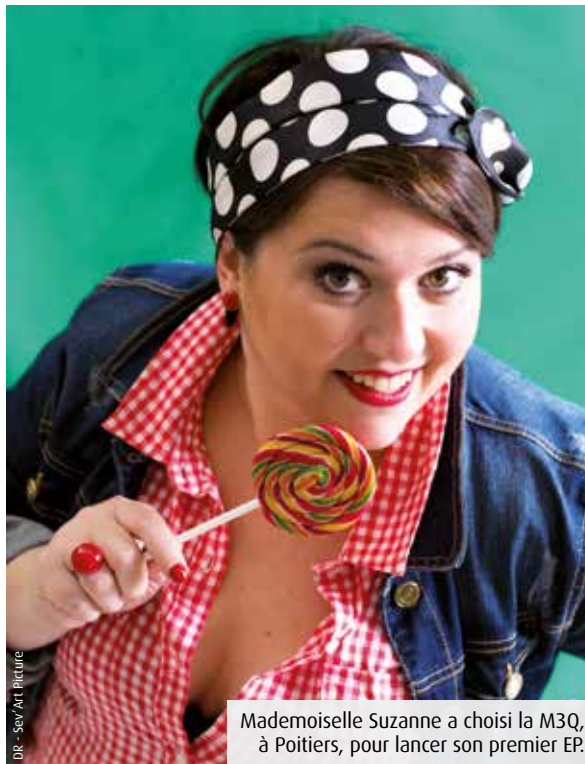
Mademoiselle Suzanne a choisi la M3Q, à Poitiers, pour lancer son premier EP.

Dans son premier EP Haut les corps , sorti début janvier, Mademoiselle Suzanne a sélectionné sept titres. Dans ses tiroirs, d'autres textes attendent leur heure. La pétillante jeune femme qui se dessine derrière ce mystérieux pseudonyme a toujours chanté, beaucoup lu aussi, avant d'oser écrire. Sur les hommes, les femmes, les hommes et les femmes, en jouant avec les mots avec humour et délicatesse. « Le féminisme n'est pas un gros mot, c'est vouloir l'égalité des droits entre les hommes et les femmes. C'est une cause importante mais je n'ai pas envie de l'attaquer de manière frontale. » A quoi bon puisque, de toute façon, « les hommes et les femmes viennent de deux planètes différentes », sourit la Châtelleraudaise, originaire de Saint-Gervais-les-Trois-Clochers. Aujourd'hui assistante sociale, l'ancienne élève de terminale L option théâtre du lycée du