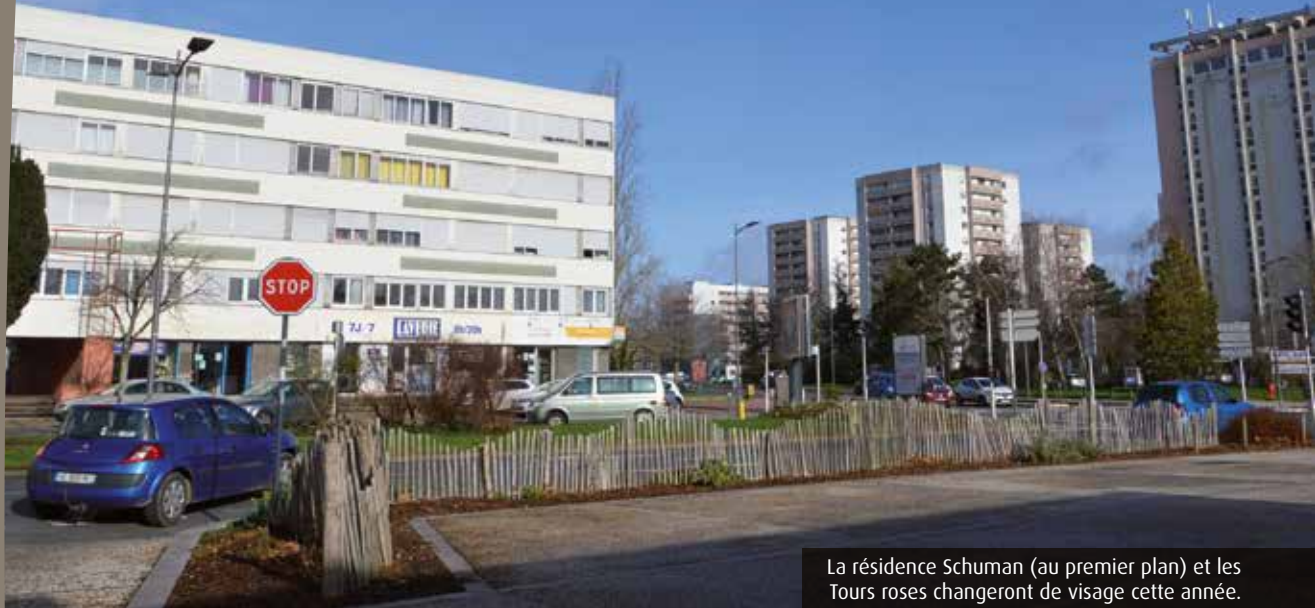
La résidence Schuman (au premier plan) et les Tours roses changeront de visage cette année.

L'Agence nationale de contrôle du logement social (Ancols) a publié, en novembre dernier, un rapport de contrôle pour l'année 2017 particulièrement défavorable à Ekidom. Il met en lumière une « organisation marquée par de nombreux dysfonctionnements » et une « gestion perfectible des réclamations techniques ». Le bailleur social rappelle que cette évaluation s'est déroulée sur la première année post-fusion entre Logiparc et Sipéa. La direction insiste aussi sur la « Réduction de loyer de solidarité et l'augmentation du taux de TVA qui impactent la production, les réhabilitations et le gros entretien ». Et indique que le taux de vacance de logements est passé de 7,58% en février 2018 à 5,97% en septembre 2019. Le rapport et la réponse d'Ekidom sont disponibles sur ancols.fr