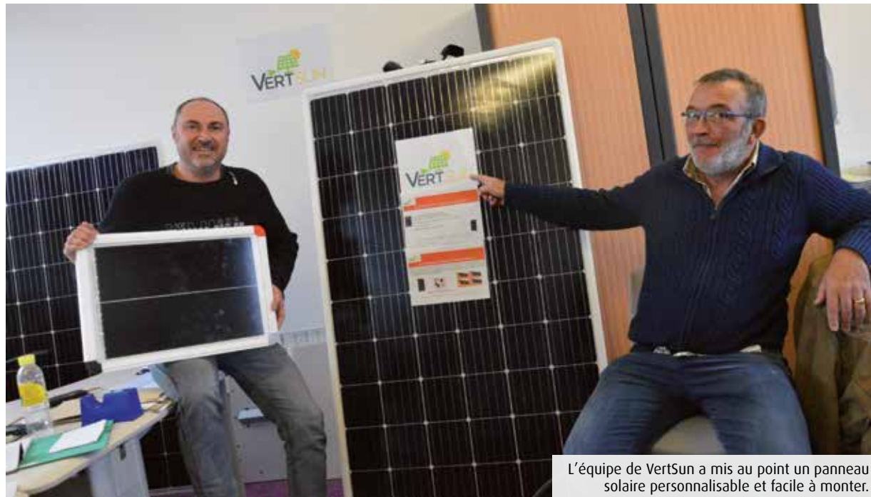
L'équipe de VertSun a mis au point un panneau solaire personnalisable et facile à monter.

Tous les ans, Vienne Nature sort son calendrier des rendez-vous nature et environnement proposés par une vingtaine d'associations du département. L'édition 2020 est désormais disponible, en ligne sur vienne-nature.fr/sorties-nature , ou en version papier aux sièges des associations partenaires. Y sont recensés les événements prévus pour les 40 ans de la réserve naturelle du Pinail, de nombreuses sorties botaniques, des ateliers de cuisine sauvage, des balades nature en canoë, des sorties à la découverte de la biodiversité... Nouveauté cette année, le calendrier comprend des présentations de sites naturels à visiter dans le département.