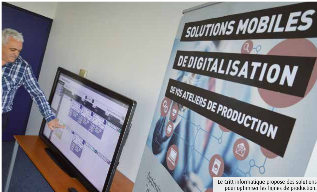
Le Critt informatique propose des solutions pour optimiser les lignes de production.