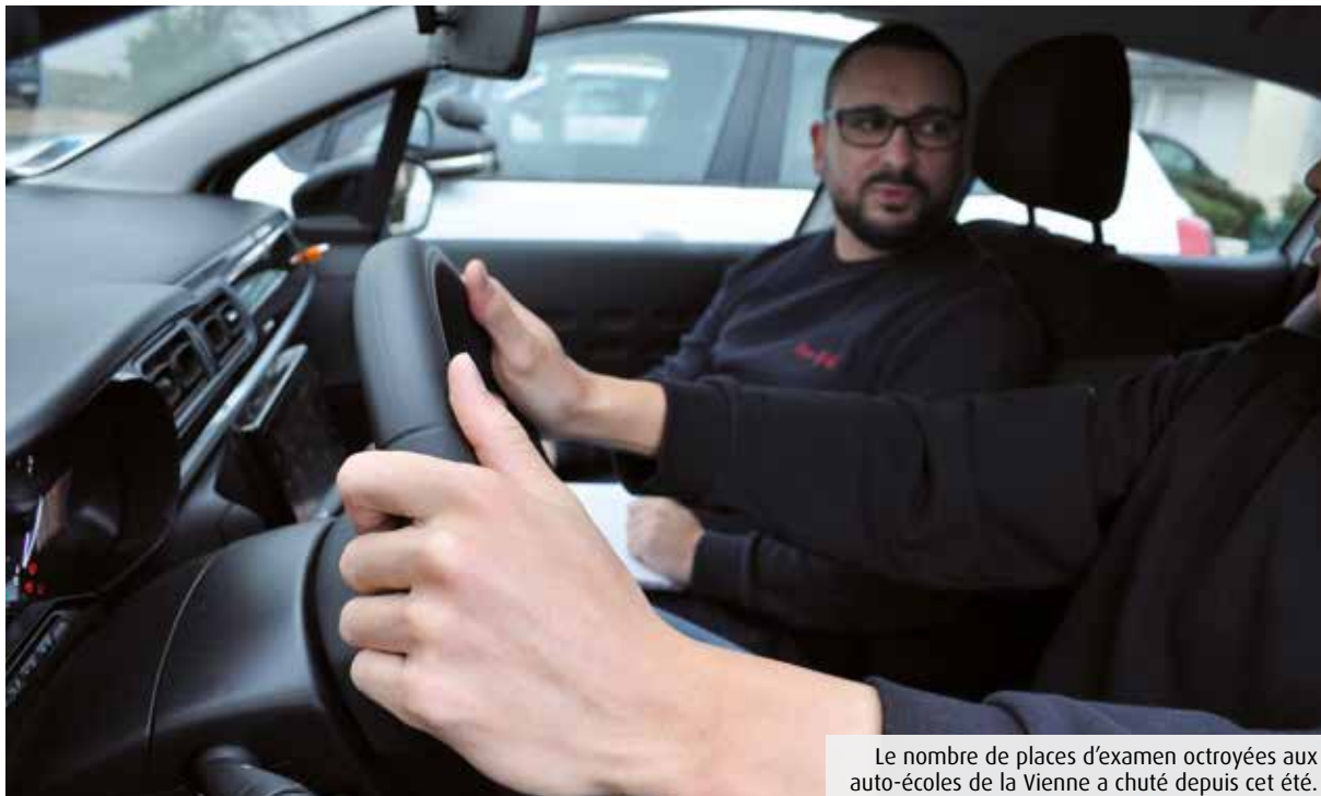
Le nombre de places d'examen octroyées aux auto-écoles de la Vienne a chuté depuis cet été.

Au mois d'août 2019, une inspectrice du permis de conduire a quitté la Vienne sans être remplacée. Depuis, les délais d'examen s'allongent et le nombre de places se réduit. Les auto-écoles du département s'inquiètent.