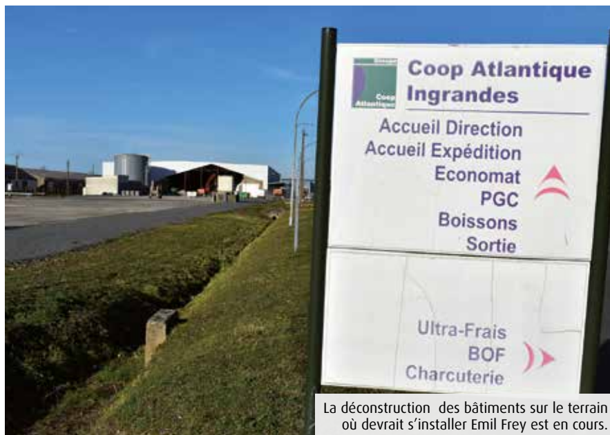
La déconstruction des bâtiments sur le terrain où devrait s'installer Emil Frey est en cours.