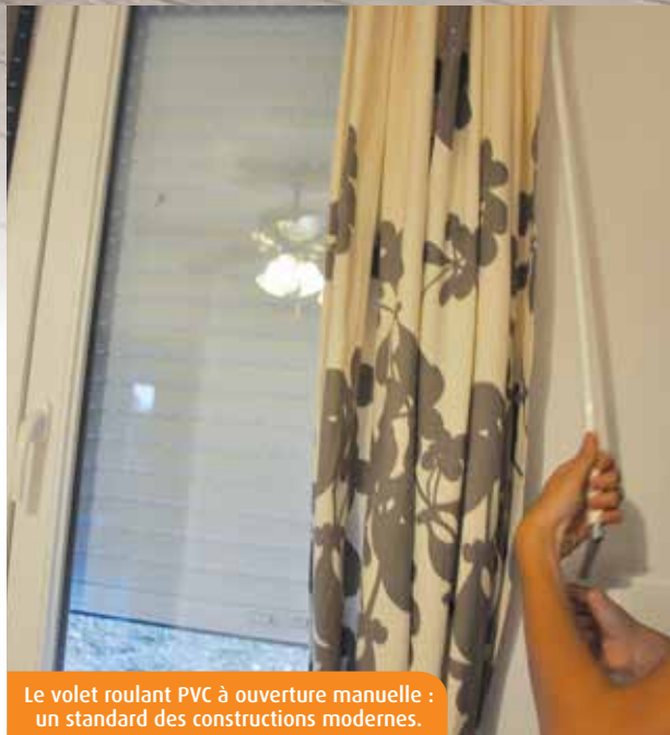
Le volet roulant PVC à ouverture manuelle : un standard des constructions modernes.

Aluminium, PVC et bois (le fer s'est quelque peu noyé dans le bouillon du modernisme) sont les trois matériaux référents dans la composition des volets. Si votre premier critère de sélection est de disposer d'équipements faciles à entretenir, l'aluminium et le PVC combleront tous vos désirs, qu'ils se présentent en modèles pliants, battants ou roulants. Bien que plus chaleureux et plus isolant, le bois nécessite un minimum de surveillance, l'apposition d'une couche de lasure, tous les deux ou trois ans, étant conseillée.