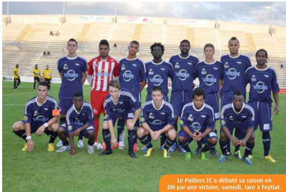
Le Poitiers FC a débuté sa saison en DH par une victoire, samedi, face à Feytiat.