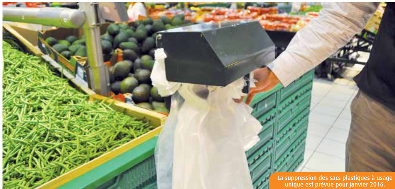
La suppression des sacs plastiques à usage unique est prévue pour janvier 2016.

Dès le 1 er janvier 2016, les sacs plastiques seront bannis des commerces d'alimentation. Des solutions alternatives sont envisagées... mais elles comportent quelques inconvénients.