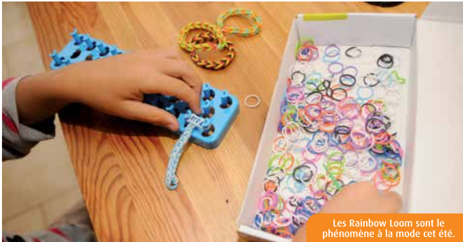
Les Rainbow Loom sont le phénomène à la mode cet été.

Importé en France à l'automne 2013, ce jeu d'origine américaine est devenu un véritable phénomène. « Les enfants en font tout le temps, on ne peut plus les arrêter », sourit une animatrice du centre. « J'en ai plein chez moi !, acquiesce une blondinette de 7 ans. J'en fais quand ma Nintendo DS n'a plus de piles. » « Oui, c'est quand même mieux que de passer tout son temps à jouer à la console, c'est plus créatif »,