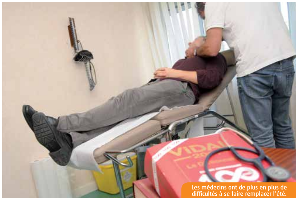
Les médecins ont de plus en plus de difficultés à se faire remplacer l'été.

Le président de l'Union régionale des professionnels de santé médecins libéraux ne jette pas la pierre aux jeunes praticiens.