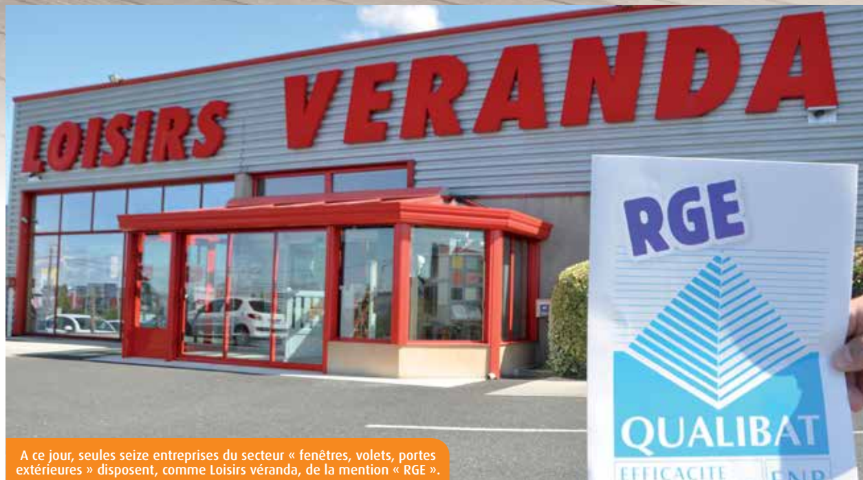
A ce jour, seules seize entreprises du secteur « fenêtres, volets, portes extérieures » disposent, comme Loisirs véranda, de la mention « RGE ».

Selon le ministère, le nombre d'artisans répondant aux critères définis par le gouvernement est aujourd'hui insuffisant. Le texte de loi de la ministre de l'Écologie, Ségolène Royal, prévoit donc de renforcer la formation des acteurs du secteur, à hauteur de 50 000 artisans qualifiés d'ici la fin 2015. Pour obtenir la mention « RGE », les entreprises concernées par la transition énergétique doivent d'abord choisir un organisme certificateur. Pour le secteur « fenêtres, volets, portes extérieures », trois sont agréés : « Qualibat », « Eco-artisans » et « Les Pros de la performance énergétique ». Une fois l'inscription faite, pour tout ou partie de l'activité générique, le chef d'entreprise doit se former (puis former ses collaborateurs) aux énergies renouvelables, via le programme FeeBat. Deux sessions, là encore payantes, sont au programme. La constitution d'un dossier auprès de l'organisme certificateur retenu intervient après ces deux étapes. Son examen est effectué en commission d'experts, en plusieurs fois si nécessaire. S'il est validé, l'entreprise est référencée auprès des particuliers sur le site dédié renovation-info-service.gouv.fr. C'est à cette adresse que vous trouverez la liste officielle des professionnels « RGE ».