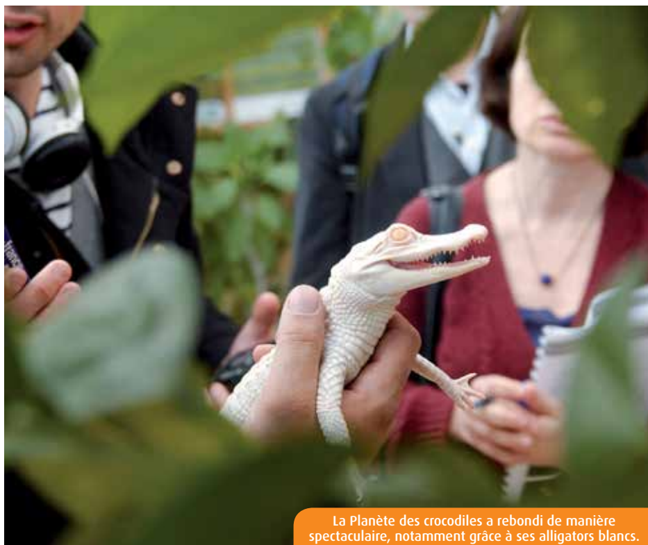
La Planète des crocodiles a rebondi de manière spectaculaire, notamment grâce à ses alligators blancs.