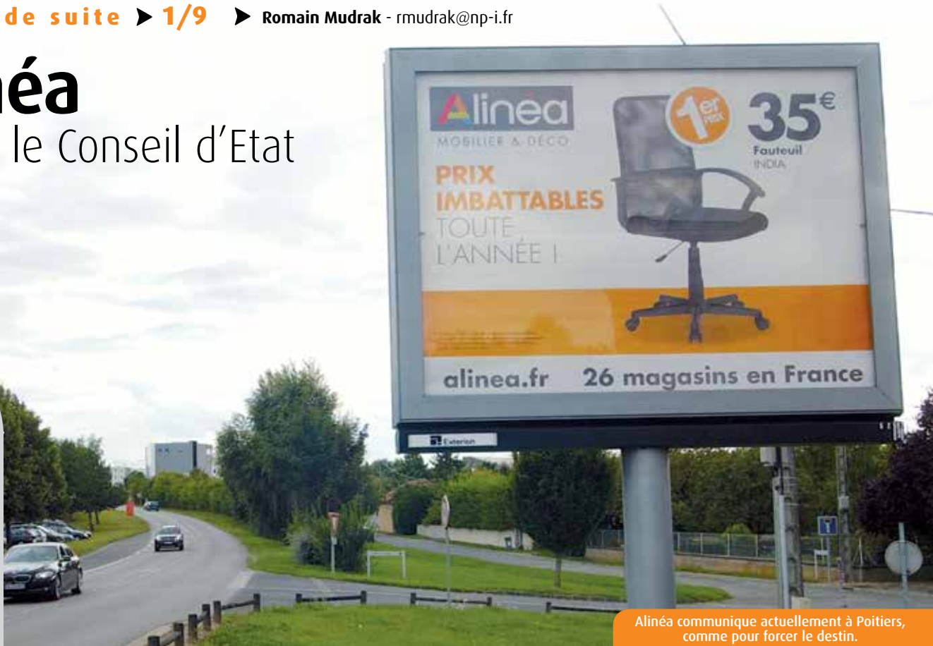
Alinéa communique actuellement à Poitiers, comme pour forcer le destin.