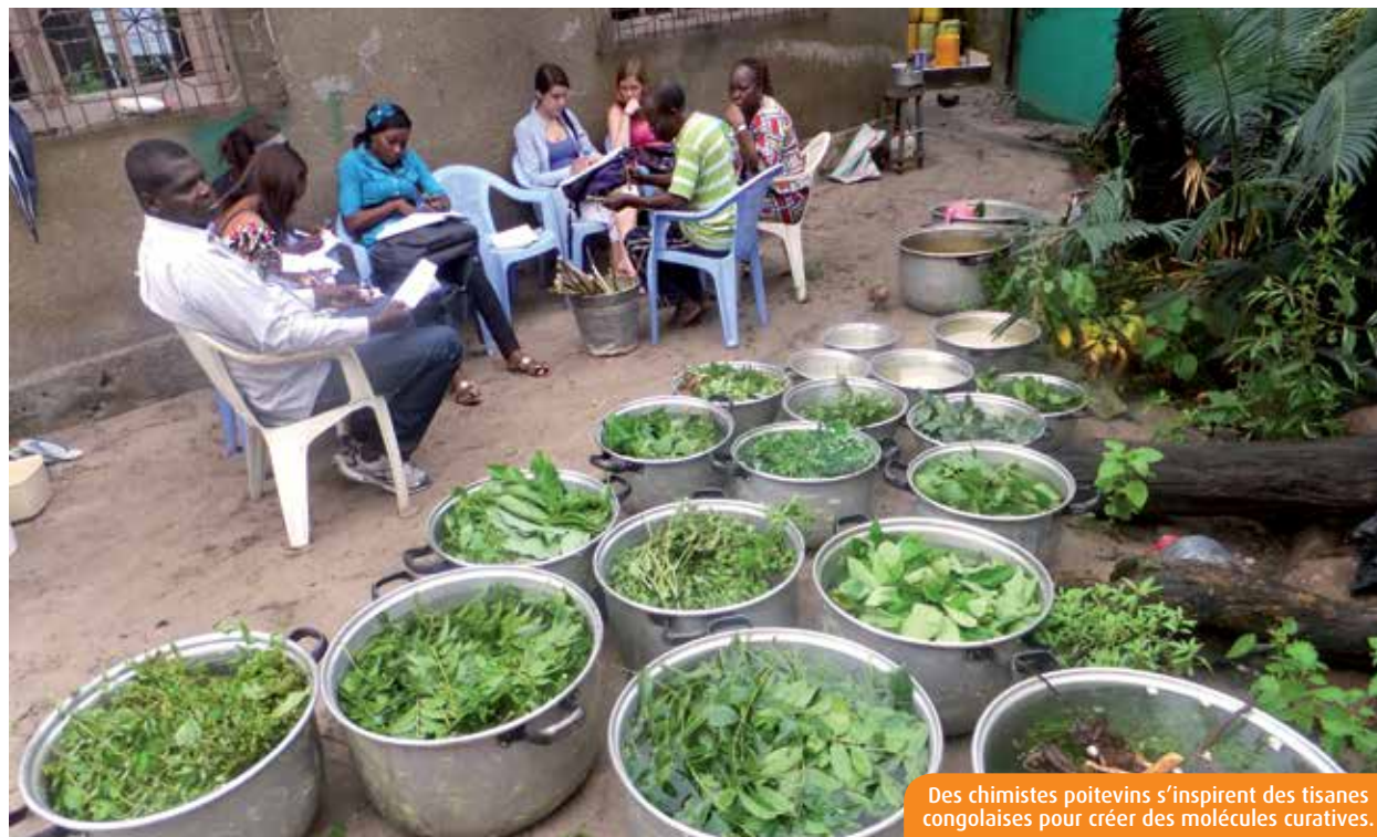
Des chimistes poitevins s'inspirent des tisanes congolaises pour créer des molécules curatives.

En stage au Congo, deux étudiantes en chimie de l'université de Poitiers ont rencontré des « tradipraticiens », qui soignent les malades grâce aux plantes. Aussi mystiques qu'elles puissent paraître, leurs recettes intéressent les chercheurs poitevins.