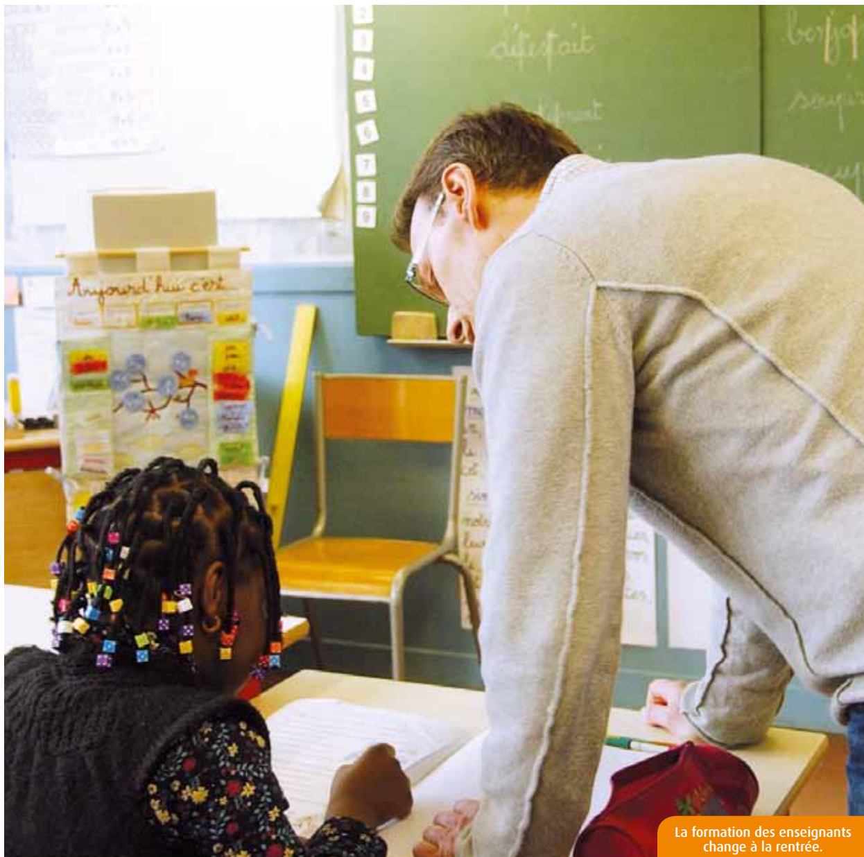
La formation des enseignants change à la rentrée.

L'espace d'exposition de la faculté des Sciences humaines et Arts accueillera, du 30 août au 10 septembre, une exposition thématique réalisée par les étudiants du programme intensif Erasmus « Essep » (European summer school in epigraphy - Poitiers). Ce programme forme les étudiants à l'épigraphie antique et médiévale. L'entrée est libre, du lundi au vendredi, de 8h30 à 18h30 (bâtiment E18, niveau 3, 8, rue René-Descartes), et le samedi, de 9h à 17h (23 bis, rue des Carmélites).