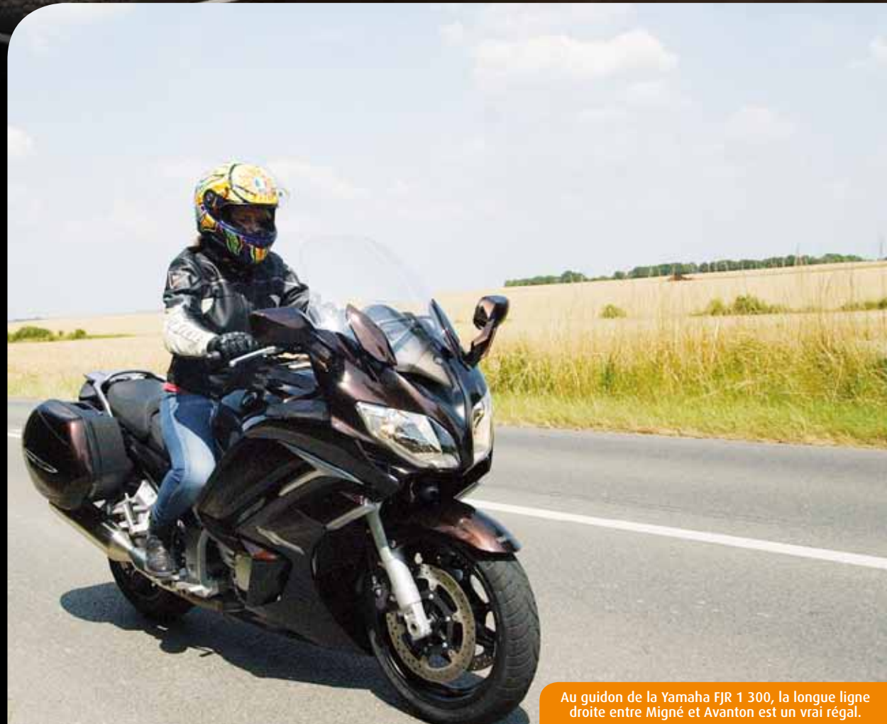
Au guidon de la Yamaha FJR 1 300, la longue ligne droite entre Migné et Avanton est un vrai régal.

Les forces de l'ordre ont multiplié les contrôles lors des vacances d'été et ont constaté bon nombre d'infractions. A titre d'exemple, sur le seul week-end du 9 au 11 août, police et gendarmerie ont relevé quarante-six vitesses excessives, huit conduites sous l'empire d'un état alcoolique, trois conduites après usage de stupéfiants, ainsi que soixante dix autres infractions (usage du téléphone au volant, défaut de permis de conduire, non port de la ceinture de sécurité, non apposition d'assurance, non respect de la signalisation...). Quinze permis de conduire ont été retirés sur le champ. Pour rappel, sur les sept premiers mois de l'année, dans le département de la Vienne, cinquante-cinq accidents, treize tués et cent quatre vingt-cinq blessés avaient été enregistrés.