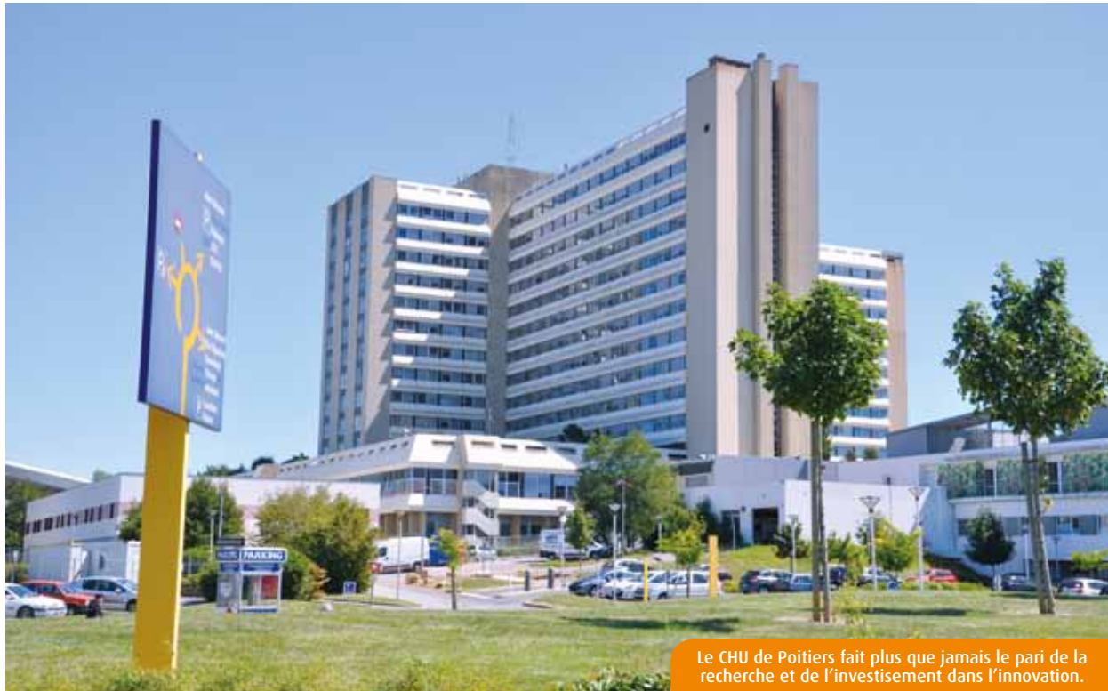
Le CHU de Poitiers fait plus que jamais le pari de la recherche et de l'investissement dans l'innovation.