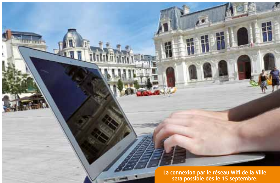
La connexion par le réseau Wifi de la Ville sera possible dès le 15 septembre.

Sur le papier, le projet recueille un maximum de suffrages. Proposer un point d'accès à Internet, sur la place publique de Poitiers, rien de plus logique pour une ville en voie d'ouverture sur le numérique. Dès la mi-septembre, vous pourrez ainsi vous connecter gratuitement à partir de l'une des vingt-cinq bornes Wifi implantées à proximité des places Leclerc et De Gaulle, du Jardin des Droits de l'Homme, du parvis du Tap, du square Magenta, des jardins de Puygarreau, ou encore de la médiathèque François-Mitterrand. « Ce service sera proposé aux habitants et visiteurs disposant d'un appareil numérique », précise Grand Poitiers. Un système d'authentification, via un portail générique, permettra d'organiser les flux de connexion. Tout irait pour le mieux dans le meilleur des mondes si cet investissement -entre 30 000