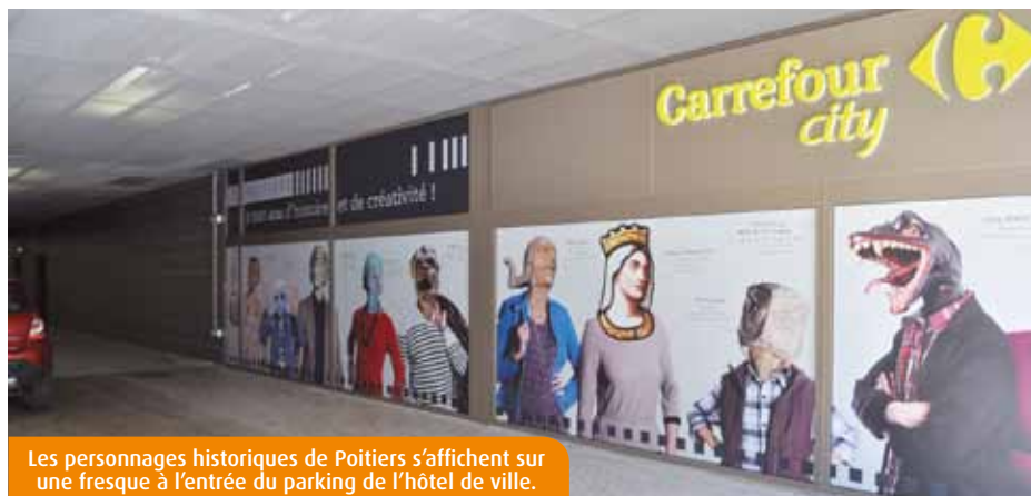
Les personnages historiques de Poitiers s'affichent sur une fresque à l'entrée du parking de l'hôtel de ville.

En pénétrant dans le parking de l'hôtel de ville, les automobilistes tombent désormais nez-à-nez avec la Grand'Goule, Robothespian (le robot malicieux du Futuroscope) et même... Jeanne d'Arc. Ces personnages historiques ou emblématiques de la ville de Poitiers sont une dizaine à saluer les passants sur une fresque de treize mètres de long. Cette « vitrophanie » est un prolongement de la campagne de communication réalisée dans le métro parisien, en février et mai derniers. Le succès fut retentissant, puisque le site Internet de