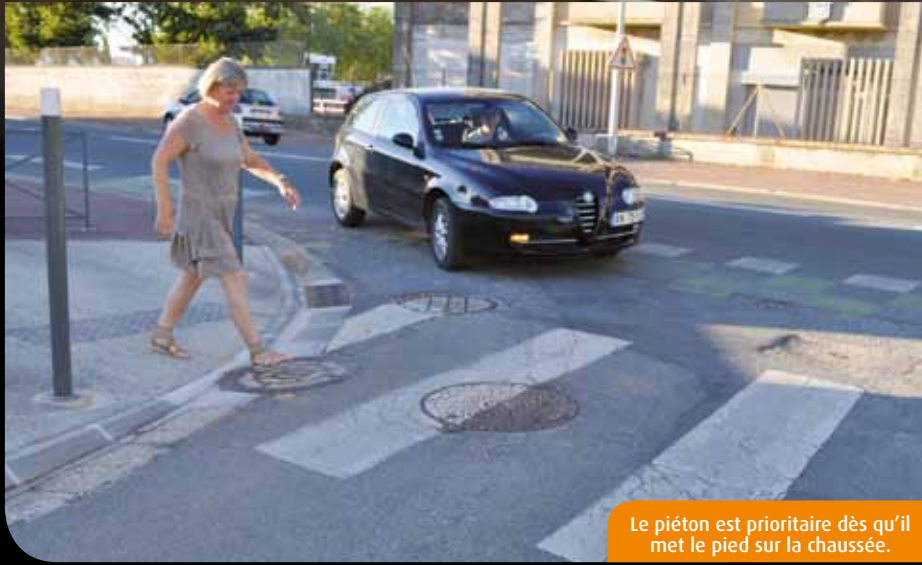
Le piéton est prioritaire dès qu'il met le pied sur la chaussée.

chances de survie lors d'un choc à 30km/h, mais que cette statistique descend à 20% à 60km/h. Enfin, notez que les rollers sont considérés comme des piétons ! De ce fait, ils circulent sur les trottoirs et non sur les pistes cyclables. »