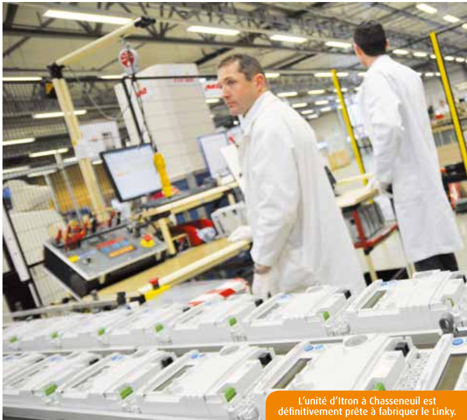
L'unité d'Itron à Chasseneuil est définitivement prête à fabriquer le Linky.

sait qu'ErDF retiendra plusieurs industriels. A commencer par ceux qui l'ont accompagné dans la phase de développement du produit ? Réponse au printemps 2014, date à laquelle les fournisseurs seront désignés.